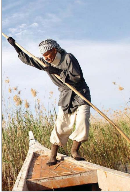
رأته، وهو الفصحى (نبات كنبات الزرع غير عززال: عندما يبيض الزرع، إذ يصبح عرضة لتناول أبة يجاوز الزرع في الطول وله سنبل وحب نثقي أسمن) الدلائل مملزمتان لم تلح في فرق دلالي النواحي والاسميا التخزين، حيث ترتداه إيلاً لكي تقتد به فيقوم الفلاحون بيضاء، مكان التوالفة لأنها لا تشكل حرجاً على المتكلم.

هناك أضافات تادور في خلدنا وكان لها الصّاح المعلن في الاستعمال اللهجي العامي لمدينة الناصرية، إذ كنا نعرض عنها صفاً ونفخ من دونها طرفاً وترتفع عن استعمالها خشيةً، ظناً منا أنها مولدة . وكاننا لم نولد من رحم الفصحى. فما زالت قايمة في متن اللسان، نابضة في الضمير اللغوي، مهمة على رف النسيان حتى صدمات يهددها الانقراض ويعتورها الوهلي.