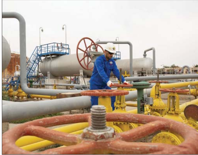
بغداد/ عماد الامارة

قال مختص بالشأن الاقتصادي إن آراء المختصين عن جولات التراخيص التي أبرمتها وزارة النفط قد تباينت، فهناك من عدها بداية صحيحة لتطوير الصناعة النفطية في العراق بينما عدها آخرون بمثابة ارتكان ثروة العراق النفطية للشركات الأجنبية، لكن يبقى لهذا النوع من الاستثمار العديد من الزايا رغم وجود مجموعة تؤيده وأخرى تنتقده كونها ترى فيه مجموعة من السلبيات.