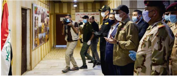
● رئيس الوزراء يلتقي القيادات الامنية خلال زيارته قضاء الطارمية أمس