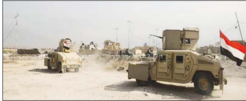
بغداد / الصباح