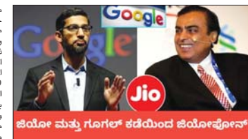
مؤتمر صحفي مشترك بين Google و Jio.

ومع أخذ ذلك في الاعتبار، فإنه ليس من المستغرب رؤية غوغل تطور حاسب كروم بوك يعمل بنظام التشغيل كروم و ميسمي داخلها.