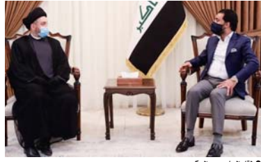
بغداد / الصباح