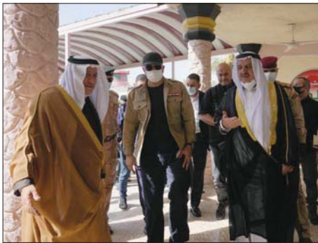
رئيس الوزراء يلقي شيوع ووجه الطارمية

أكد رئيس الوزراء، مصطفى الكاظمي، رفضه للشائعات التي تحاول النيل من قواتنا البغلة لافتاً إلى أن الاتهامات التي توجه لها لمجرد الحديث وبغثة القوات الأمنية «باطلة»، مطالباً الإذاعة العام بفتح تحقيق مع من اتهم قواتنا البغلة بالباطل. وذكر بيان لمكتب رئيس مجلس الوزراء الإعلامي، لفته «الصباح»، أن «الكاظمي أجرى، أمس الاثنين، زيارة تفقدية إلى قضاء الطارمية، وعقد حال وصوله اجتماعاً مع قيادات الأمنبة المكنة بأمن