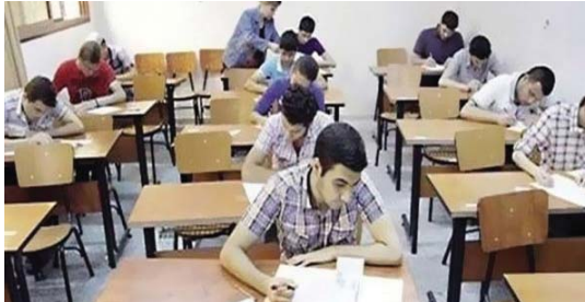
● قاعة امتحانية - اربيل

شدد النائب الاول لرئيس مجلس النواب، حسن الكعبي، على ضرورة الانتباه الى رصانة الشهادة العراقية التي يحملها الطالب العراقي، بينما افتتحت لجنة التربية التابعة مع الوزارة على مقترح تأجيل موعد الامتحانات لطلبة السداس الاعدادي الى الاول من ايلول المقبل. ويحسب بيان صادر من المكتب الاعلامي لمكتب النائب الاول شملت الصباح، نسخة منه فقد "تأس الكعبي أمس اجتماعاً للجنة التربية التابعة بكامل اعضائها، بحضور وزير التربية علي حميد خلف ومسؤولي الوزارة، لبحث موضوع امتحانات السداس الاعدادي، وأجداً افضل الحلول المتاحة بما يخص اداء الامتحانات في ظل الظروف الحالية". وقال الكعبي: ان الغاية من هذا الاجتماع هو توحيد وجهات النظر فهذه الامتحانات تنقل الى السلطة التشريعية من اولياء امور الطلبة والمنتخبين بالتصويت بالجلسات التربوي والمنتخبين بالمجلس التشريعي تقابلها سياسات وأليات تعامل وزارة التربية تطبيقها الى ان يتم الاتفاق على افضلها