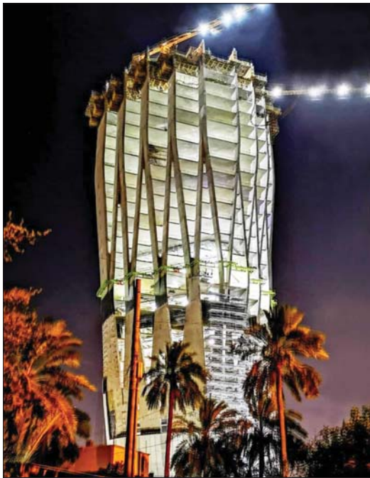
● بنائية البنك المركزي قيد الإنشاء

وتضمن عودة العراق إلى عضوية المجلس ثمة التعاون المشترك مع الدول الأعضاء، خلال الفترة الماضية في مجال الإنتاج البرامجة، بعد التجربة الأخيرة لبرنامج بيت للكل، في الإنتاج المشترك بين مصر والعراق والأردن وفلسطين. ويشارك بالاجتماعات رؤساء وممثلو الهيئات الإذاعية والتلفزيونية الأعضاء، في الاتحاد والأمانة العامة للأجهزة الدول العربية والأجهزة الدائمة للاتحاد والمنظمات العربية والإقليمية والدولية المتخصصة.