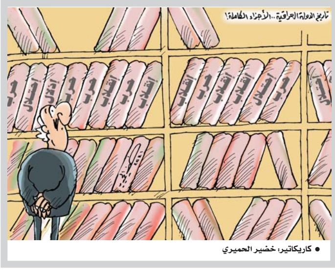
● كاريكاتير: خضير الجيميري

من الواضح ان ما حصل من تفجيرات معده لا بصورة منظمة ومدروسة سلفاً، خصوصاً ونحن نعلم ان أغلب الجيوب والأركان الإرهابية الهمة والكبيرة، قد دمرت بعطبات عسكرية سابقة، ان ما حصل لا يمكن ان يكون بعيداً عما يجري في سوريا، خصوصاً في ظل المواقف الأخيرة من العراق، بعدم وقوفه عن مشرور التغيير في سوريا، والمواقف الأخيرة للعراق في تبني سياسية الحياد، في مواقف الجامعة العربية من القضية السورية، مما أعطى حافزاً للمجماعات الإرهابية في سوريا، للتصحر لضرب العراق من الداخل، للاستقرار، إلا بعد نهاية الأزمات في المنطقة عموماً.