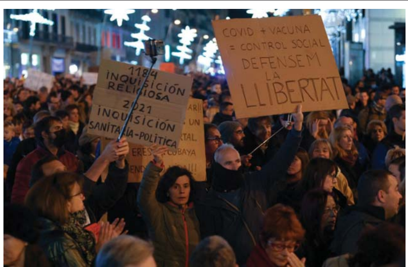
تظاهر الآلاف في مدن أوروبية ضد إجراءات الحظر الحكومية المتعلقة بكورونا ضد التطعيم الذي أقرته بعض الدول. فني برشلونة تظاهر الآلاف احتجاجا على التصريح الصحي المعمول به في كتالونيا، كما اندلعت تظاهرات معارضة لإجراءات الحظر المتعلقة بكورونا في لوكسمبورغ.

علقت وزارة الخارجية الصينية على انعقاد قمة القادة من أجل الديمقراطية التي نظمتها الولايات المتحدة، معتبرة أن واشنطن تعاكس تيار التاريخ.