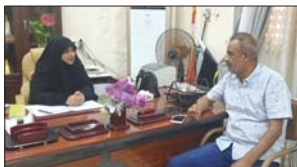
مروان (الصباح) يجاور مديرية بيئة المحافظة

ولكي تتوفر الحماية اللازمة للطيور المهاجرة، وخصوصا النادرة منها لا بد من اتخاذ الاجراءات اللازمة من قبل الجهات المعنية والتي تسهم في الحد من انتشار ظاهرة الصيد الجائر الذي يقطن بالطيور ويمنع اصطياد الطيور النادرة وتلك المعرضة للانقراض، لذا