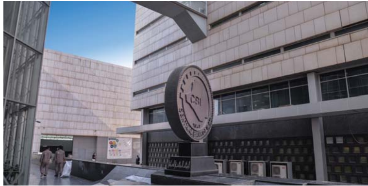
● تصوير رغبى اموري

● بغداد: أحمد صيد ربه في مواجهة التخمينات والتحذيرات التي تطرحها مؤسسات نقدية دولية، في ما يخص الاقتصاد العراقي، كان البنك المركزي العراقي، قد راكم الاحتياطي النقدي لديه من العملة الصعبة إلى 64 مليار دولار، الأمر الذي يجعله اقتصاداً مستقرًا ومريحاً.