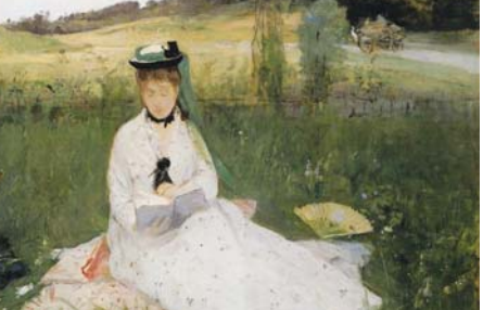
لوحة بريت موريس