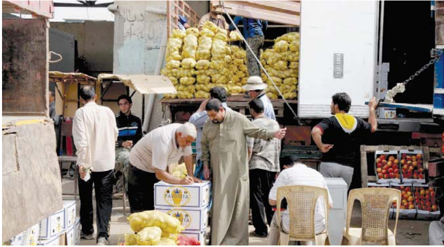
● تجار الفرد يلقون بالوم على تجار الجملة