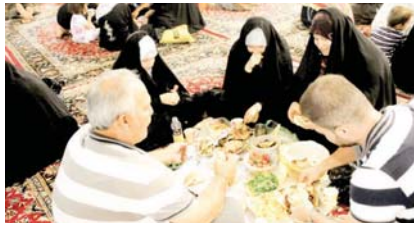
التنزهات برغم هلتها صارت متنش العائلة

تقتضي معظم الأسر وقتها بعد الإفطار بممارسة المشاعر الدينية وجلسات الأحاديث والتسامر، وشرب الشاي والتسليفة ومشاهدة التلفاز وزيارة الجار لجاره».