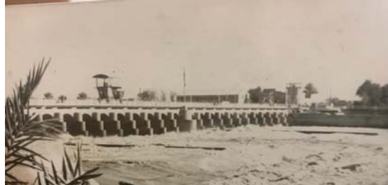
● نشأت نخز ان الجاه فهارت معلماً سياسيا

لكل مجلس رمضاني لؤلؤ وأداء، ولكل متشد طريقة مثل للحصول على رضا السامع المشاهد.