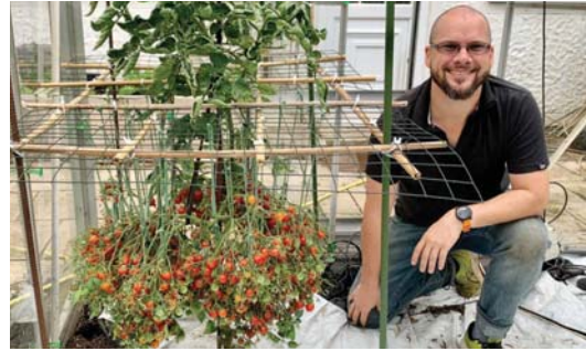
● ترجمة: ليندا ادور

من أنشاء 1269 حبة طماطم هي نبتة واحدة. طماطم هي نبتة واحدة، وقد أثبت ذلك العام الماضي، عندما حقق إنجازا بكسر الرقم السابق، وزراعة 839 ثمرة طماطم هي نبتة زعت في دفيئة. لكن يبدو أن تلك كانت البداية فقط، فيد بضة أسابيع، حطم سميت رقمه كسر هذا الرقم، معتادا