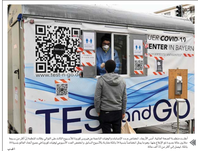
أعلنت منظمة الصحة العالمية، أمس الأربعاء، انخفاض عدد الإصابات والوفيات الناتجة عن فيروس كورونا للأسبوع الثالث على التوالي وقالت المنظمة إن أكثر من سبعة ملايين حالة جديدة تم الإبلاغ عنها، وهو ما يمثل انخفاضاً بنسبة 24 بالمائة مقارنة بالأسبوع السابق، وانخفض العدد الأسبوعي لوفيات كورونا في جميع أنحاء العالم بنسبة 18 بالمائة، ليصل إلى أكثر من 22 ألف حالة.

قضت محكمة فيدرالية في نيويورك، بسجن أميركي مهم بأنه قرصان معلوماتية وخبير في العمليات المشفرة لمدة تزيد على خمس سنوات بتقديمه نصابك ولاية كوريا الشمالية للتواصل على العتبات الدولية من خلال العمل العام وداين ويليامز إن المحكمة فدرالية بسجن غريفيث لمدة 63 شهراً، مضيافاً أن كوريا الشمالية تشتت من دون أدنى شك تهديداً لأمننا القومي، وقد ثبت التلصق (في بونغ غانغ) مراراً وتكراراً إن لا شيء يمنع من انتهاك قوانيننا.