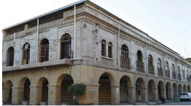
كانت المكتبة مخصصة ببيع الكتب الصادرة باللغة الإنكليزية

كان من النادر جداً أن يزور مقفول العراق بغداد من دون أن يحثوا الخطى إلى مكتبة ماكينزي التي كانت تقع في قلب شارع الرشيد شريان بغداد الثقافي والاقتصادي معاً، التي رفدت المثقف العراقي بكل ما هو جديد وراق في سنوات القرن المنصرم مما كانت تطبعه لندن وأوروبا عموماً من كتب ومؤلفات غالية في الشراء الفكري.