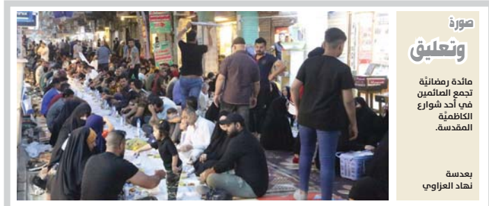
صورة وتعليق مائة رمضان تجمع الصائمين في أحد شوارع الكاظمية المقدسة.