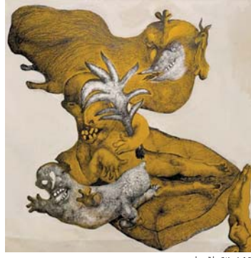
• تخيلت باقر ماجد

هزّ الرجل رأسه موافقاً، وأردف قائلًا "أه، نعم، الحرارة لا تطاق إنهم يضمون هذه المراجح للزينة فقط". وهو يشير إلى المراجح المسجحة بالزيت، تهتفت المرأة واستقرت في جلستها في انتظار القطار ليطلق صفارته متطلقاً نحو مرفق ابوتس، ميتا كان الزكباب خيلط من الأجسام المتعزّة، والكريهة الراحة والثجكة وكان هناك كذلك عدّة قليل من الأجسام النظيفة التي أرسلت عبيزاً خافساً من الأسفل، وكانت تتلذذ بكل لحظة برغبة ولوع، ويرغم قديريها العالي لدماثة خلق الرجل الجالس بعينها، إلا أنّ رائحة فمه الكريهة جعلتها تدم على قبول دعوتها للجلوس. عرفت أبيجي بأمر الرائحة أول مرّة عندما تحدثت الرجل عن المراجح فتحدثت في قرارة نفسها أن يكفّ عن العديث، لكن الحوادث المأثورة في القطار المزدحم كانت سبباً كافياً لإيقاظ رغبته بالحديث، فالتفت لنفسها "لا متأس من تحفل هذه الرائحة الخائفة، كل ما حولها كان يُشعرها بالترقب والعثبان، كانت