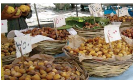
● فئض في منتوج التمور ومع ذلك تستورد

باتفاقية مسبقة بين الفلاح والتاجر لغرض حصر المحصول ومن ثم عرضه بسعر يرضيهم، بالأساس كان الفلاح يبحث عن فرصة لبيع محصول البطاطا، واليوم يخزنها في برادات خاصة ولا يعرضها للبيع وذلك من أجل رفع أسعارها وهنا يأتي دور وواجب رجال مكافحة الجريمة الاقتصادية، وأتساءل من خلاكم أي من مما يجري في سوق الجملة أو ما يسمى بعلاوي الخضار والمحاصيل الزراعية؟، وأين هم من الموظف الذي يساقنا على أرفاقنا ويقف معنا في السوق رغم حصوله على مرتب يكفيه ويكفي أسرته؟، وأين هم من عمال النظافة الذين لا يعملون إلا بعد أن يجمع لهم مبلغاً من المال، أعتقد أن هذه الأسئلة مهمة في طرحها قبل