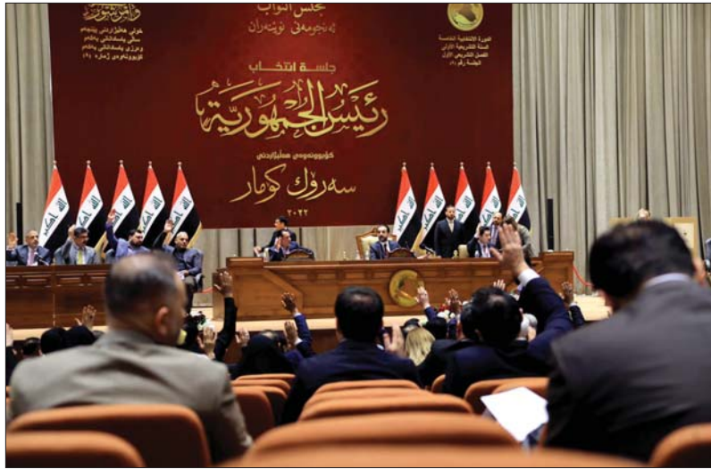
حسم التحالفتان ورتاستي الجمهورية والوزراء بحاجة إلى وقت