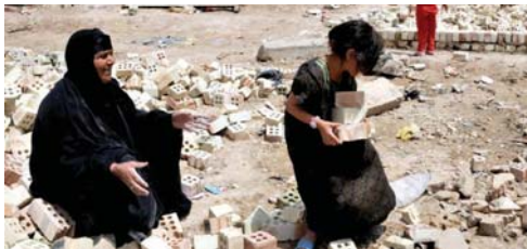
• حين تضطر المرأة إلى أن تكون هي الأب والاب