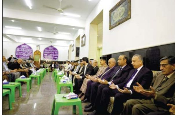
● رئيس الوزراء رحيل حسب الشيخ جعفر خسارة للأدب والإبداع العراقي

حضر رئيس الوزراء، مصطفى الكاظمي، أمس الأربعاء، مجلس عزاء الشاعر الكبير حسب الشيخ جعفر الذي أقيم في منقطة شارع فلسطين بالمصامة بغداد. وقدم الكاظمي أحرز التعازي والمواساة إلى عائلة الشهيد ومحبيه، وإلى الأسرتين الثقافية والأدبية في العراق. سائلًا الله جل وعلا أن يتقدمه بوفاء رحمة، ويستكفه سبحانه، ويطلع محبيه الصبر والسلوان. وقال رئيس الوزراء، إن الراحل كان عوناً للإبداع الفكري العراقي، وعموداً سامقاً وصلت أشارة وزدهرت أشعاره وكتاباتاته إلى أفق الأرض، ورحيله شكل خسارة للأدب والإبداع العراقي. إن ذلك، أجرى رئيس الوزراء اتصالاً هاتفياً بجلالة الملك عبد الله الثاني بن الحسين عاهل المملكة الأردنية الهاشمية، أطمان فيه على صحة جلالاته إثر خضوعه لعملية جراحية. وقدم الكاظمي، خلال الاتصال، أطيب أمنياته للعاهل الأردني بسرعة المتأمل للشفاء التام، وللشعب الأردني الشقيق دوام التقدم والاستقرار، وللعلاقات الثابتة بين البلدين المزيدي والإزهار والتكامل.