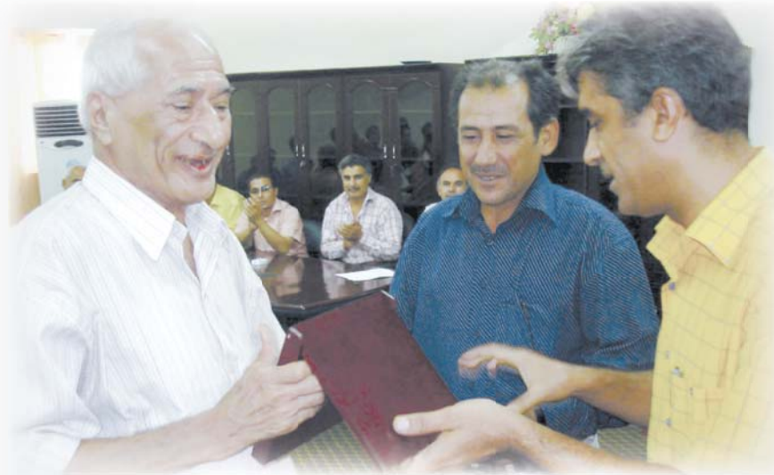
● احتفالية الجريدة عام 2010 بمناسبة صدور كتابه الغرسة والعكاز ضمن سلسلة كتاب الصباح الشهري