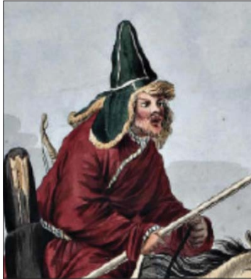
● أول لوحة وفقت قلنسوة أوشانكا