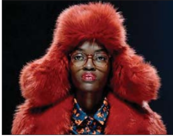
● أوشانكا دخلت الموضة الغربية

ترتديها النساء، كما يمكن أن تظهر هذه الأيام ببساطة على زي المشاهير من رينا إلى كيم كارديشان، ويظهر مصمم الأزياء، إنشاء العالم تصميمهم حول كيفية ارتدائها وتصميمها إلى الملابس الأساسية للشباب القديم، كما لا تزال أوشانكا رمزاً لرجال سيبيريا والحطابين الأقوياء.