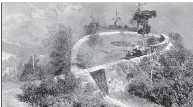
● صورة التقطت عام 1910 للقطار على جبال الهمالايا