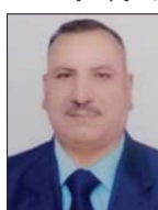
● مثر عباس