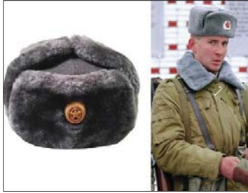
● استخدمتها البحرية الروسية سابقاً