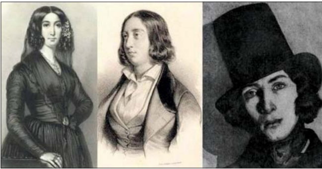
أورور دوبي حاملة لقب النوبير جورج ساند

واحد من بين عناصر كثيرة ضمن الخلفية التي يعتمد عليها الكاتب في كتاباته، وأنا كنت النساء تاجحات الغلبة، فيجب أن يعزى ذلك قبل كل شيء، إلى أهمية كتابتهن. والأمم الأكثر أهمية في الواقع، والذي يجب أن يجعل الرجال والنساء، فخورين، هو أن يعيد الكتابة التي كانت تحمل لقب الكاتبة جورج صاند، لو كانت موجودة اليوم، لكانت بنشر كتابها باسمها الحقيقي (أورور دوبي) بالتأكيد!!