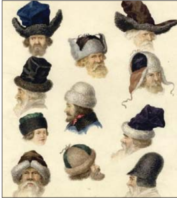
● نماذج من القلنسوة في القرن التاسع عشر