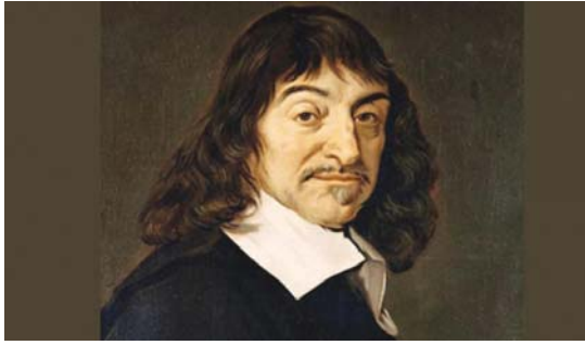
● النفس عند ديكارت هي الجوهر المتكبر

الأردة عند ديكارت ويسمى هذا رجاء، الكراهية، أو العزن والغضب. وتأثير كل من تلك الانفعالات على الحركات وعلى المظهر الخارجي، لذلك فإن معرفة الانفعالات وتحديدها يجعلنا نتصلها عن الأفكار، لأن الإخراط في الانفعالات يجعل الموضوعات تظهر للمخيلة ويذهب النفس. يذهب ديكارت عكس الرواقين الذين يطالبون الإنسان بتعديل الحواس المهيجة أو الحزينة، لكي يصل إلى حالة من الطمأنينة والسلام، بأن تمتع بالعبادة يكمن في أن يعيش الإنسان تلك التأثيرات في حركة الدم ويضاهي القلب، فيصنف ديكارت حركة الدورة الدموية وكيفية تدفق الدم واتساع