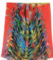
● لوحة شيلا كرايدر