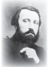
● بيير لاروس