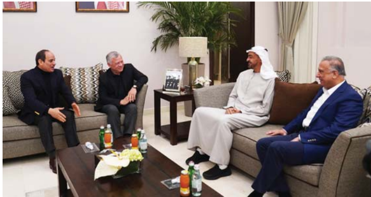
● رئيس الوزراء في قمة القمة الرباعية