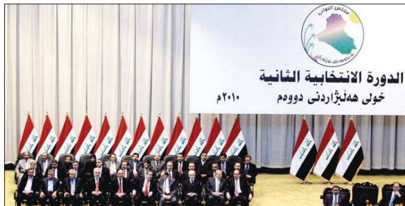
● بلغ عدد الحزب الوزارية ذروتها في حكومة المالكي الثانية 2010 وضمت حينها 42 وزيرا