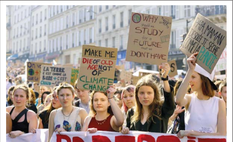
بعد مرور عامين على مسيرة المناخ التي جمعت آلاف الأشخاص في شوارع باريس، نظمت منظمة الشباب من أجل المناخ، أمس الجمعة، حركة تعبئة جديدة في ساحة البنتون في باريس لرفع الوعي بقضايا المناخ المتطاهرة دعت إليها منظمة "الشباب من أجل المناخ". المستوحاة من الناشطة البيئية الشابة غرنا توبيرغ.

أفاد تلفزيون الكيان الإسرائيلي بأن الأمم المتحدة اشترطت طلب الحكومة الإسرائيلية إقامة معرض في مقرها في نيويورك بإزالة الإشارات إلى القدس كعاصمة لإسرائيل، مما أثار غضب سفروها جلعاد أردان. ووفقاً لفتحة 12، طلب وفد الكيان الإسرائيلي لدى الأمم المتحدة إقامة المعرض في مقر الأمم المتحدة، وجاء الرد بأن ذلك مشروط بإزالة عدد من العناصر ومن بين المحتوى المرفوض بند بشأن قانون أساسي شبه مستحدث تم تصويبه في عام 1980 يعترف بالقدس عاصمة كاملة وموحد لإسرائيل. وقالت الأمم المتحدة: "يرجى محو الصودرة رقم 43. وفقاً لتقرارات الجمعية العامة ومجلس الأمن ذات الصلة، فإن القانون الأساسي الأساسي القدس عاصمة إسرائيل، غير صالح من وجهة نظرنا". مضيفة: "هذه قضية حساسة والمعلومات الواردة تتعارض مع القانون الدولي". وأضافت الفتحة بأن الأمم المتحدة طلبت من إسرائيل أيضاً إزالة النص المصاحب لصورة الكنيست الذي يصف القدس بأنها "العاصمة الأبدية للشعب اليهودي ومدنهم المقدسة". وقالت الأمم المتحدة: "هذا الاقتباس لا صلة له بالصورة وبمساعدة محو على منح التناقضات مع القانون الدولي والخصائص السياسية". ورداً على هذه الطلبات، قدم سفير إسرائيل لدى الأمم المتحدة جلعاد أردان، احتجاجاً إلى الأمين العام للأمم المتحدة أنطونيو غوتيريش، وطلب منه عرض أمام دول تعديلات.