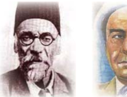
● جميل صدقي الزهاوي ● حسين مردان

وكان الشعراء الستينويون يستعشرون (ضيق الأشكال الشعرية الخمسينية وتكرار إيقاعاتها، وتنمطية أبينتها، فراح بقفدها الشاعر ويثمن لنفسه أشكالاً جديدة، ومفهرسات جديدة سنوية)، وهو يمكن الشعراء الستينويين في رصنا أو قناعة كاملة عما قدمه شعراء الخمسينيات، فهم في نظريهم كانوا تقديريين ومحافظين، وحاولوا تخطيهم من خلال تحطيم الصيغات المتعارف عليها، ثم الاشتياك مع العلاقات الغوية الجديدة، وهكذا دخلوا في التسريح الداخلي للحياة الثقافية العراقية، وأسهموا بمشروع شعري جديد، أطلق عليه سامي مهدي «الموجة الصاخبة»، ثم سماء فاضل «الغزوي» الروح الحية، ومن شعراء هذا الجيل (سامي مهدي وبسبين طه حافظ وحيد الخاقاني وفؤدي كرب وحيد سعيد وفاضل الغزوي وحبيب الشيخ جعفر وغيرهم). وفي المشهد الشعري السبعيني، لم تخرج القصيدة في البداية عن نمطها السبعيني في الأبيات من تسوية المبدأ مع 2003 والآن مع تسوية فقدان حلول منقلبة لهذه المشكلات والمضلات، مما أنتج أهم رد فعل في البلاد هو (تورة شعري) وما تلاها من أحداث ديموية، وما سبقتها من احتلال داعش لها وهي في تلك الفترة، مما أنتج انبهار في المجتمع وبعض الشعراء، هذا أدى إلى انبهار في المجتمع وأثر عميقاً على تلك الشعراء لهُولاً الشباب، فسلكوا نمط الثورة والرفض في أشعارهم، ظهرت مع ذلك تغييرات في النظم الشعري وأساليب الكتابة، وحالات جديدة في كتابة القصيدة، مما أنتج شعراء مغايرين للأجيال السابقة أدى إلى كسر النمط الشعري بوضوح مع محاولات التجريب في الكتابة الشعرية، التي وصل بعضها إلى خارج النقط الشعري ما فيه من مبالغة في طرائق التجريب.