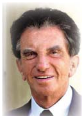
● جاك لانغ