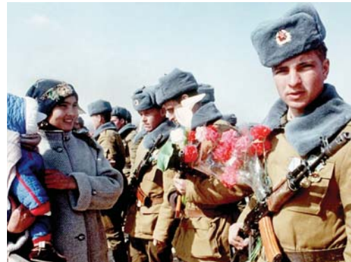
• جنود من مختلف الأعراق في الجيش أيام الاتحاد السوفيتي