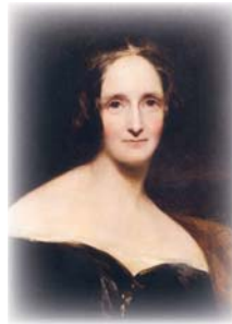
● ماري وولستونكرافت