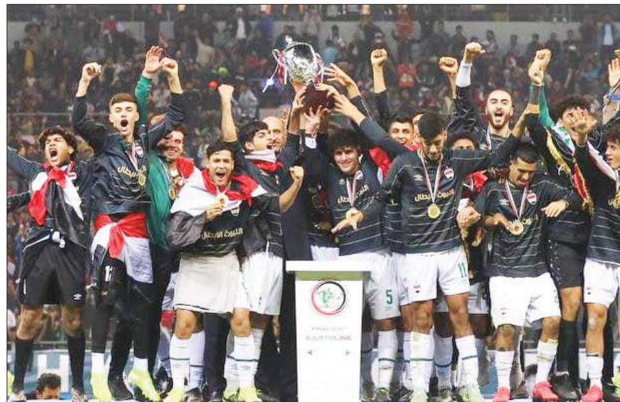
• منتخبنا الشبابي يتوج بلقب بطولة اتحاد غرب آسيا للمرة الثانية توالي

وأضاف بمرارة عن معاناة أهالي الحي من حرارة الصيف، عدم توفر الكهرباء، وتكرار المعاناة نفسها في فصل الشتاء، من البرد والمطر، بالأسوأ: «مل مجرور الحكومية عن بناء بيوت واطقة الكلفة للفقر، والتجاوزين».