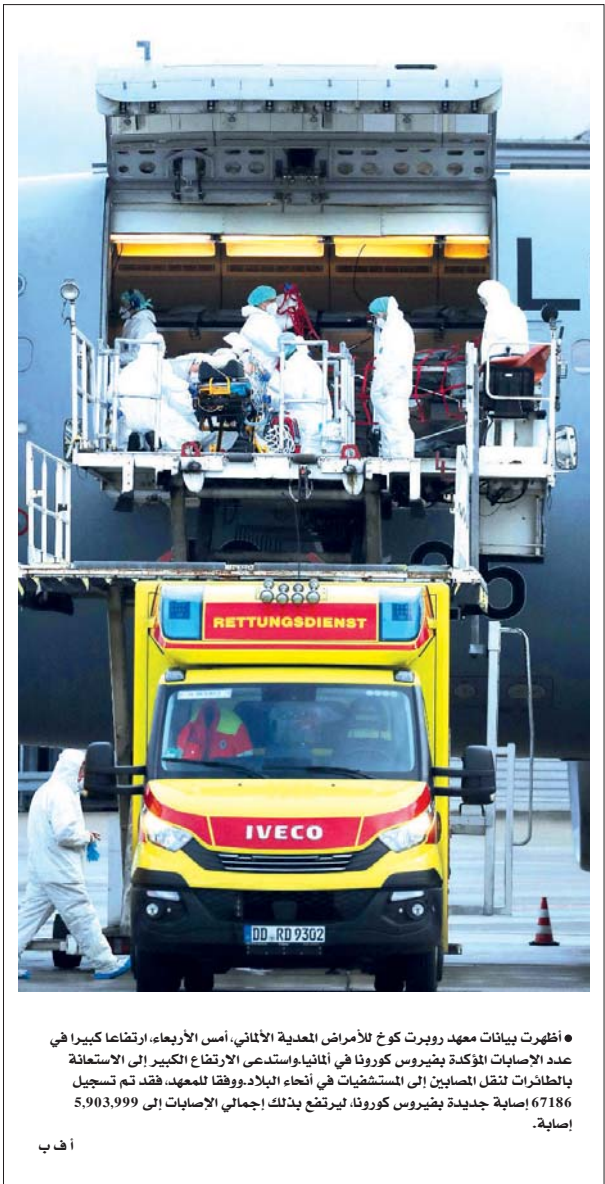
● أظهرت بيانات معهد رويرت كوخ للأزمات المعدية الألماني، أسس الأريعاء، ارتفاعاً كبيراً في عدد الإصابات المؤكدة بفيبروس كورونا في ألمانيا واستدعى الارتفاع الكبير إلى الاستعانة بالطائرات لنقل المصابين إلى المستشفيات في أنحاء البلاد. ووفقاً للمعهد، فقد تم تسجيل 67186 إصابة جديدة بفيبروس كورونا، يرتفع بذلك إجمالي الإصابات إلى 5,903,999 إصابة.

تنسج مع السعودية بشأن تحركاتها تجاه إيران فإقل، إن بلاده تضع حلقاتها الإقليميه في «السعودية» ويأتي تحسن العلاقات مع إجراء محادثات غير مباشرة بين إيران والولايات المتحدة وقوى عالمية أخرى في فيينا في محاولة لإحياء اتفاق 2015 النووي، الذي اتفقتة دول خليجية عربية لعربية تصدير إيرانيات إيران الصاروخي وما يعتبره خصوم إيران «كلامها الإقليميه» وفي موضوع آخر قال فرقاش ان بلاده وفرنسا ستوقعان عقوداً مهمة عندما يزور الرئيس إيمانويل ماكرون دبي، بينما يسعى البلدان إلى تعميق الروابط الاقتصادية والسياسية.