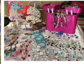
● مجموعة من الحلوى والأساور

أقيم أمس الأول في كلية العلوم السياسية/ الجامعة المستنصرية، معرض ابداعى للتنمية المستدامة بدورته الرابعة، وتضمن العديد من الأعمال اليدوية والتي أخذت تشكل تفردا في عوائلنا المصنعة. تشكلت هذه المجموعة كهواة ومحبين للأعمال اليدوية والفنية، بدءاً من التطريز وصناعة الحلوى والرسم والحياتكة والظفر على الخشب وانتهاء بصناعة الجلود والحقائب جعفرية ودقة عاليتين.