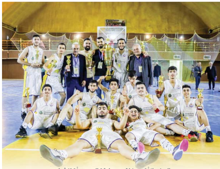
السليمانية يحزر لقب مسابقة الجمهورية للشباب

استثنائية لتقدم مستوى أفضل في مباراة الغد. مستوى يكون مفرورا بأهمية النتيجة الإيجابية ونحن على يقين بان تشكيلتنا قادرة على تحقيق الغاية المنشودة بعد التحرر من قيود الشخصية التي كانت احد أسباب قفواننا لظباط الفوز في المباراة الأولى. غلظتائنا كبيرة لان لاعبيننا كانوا ان صورة اديابي لن تنكرر وان ما زال لي جعبتنا الكثير ونحن نبورنا نقتد على دراية وايضا على يقين بان محطة البحرين تستعمل لنا الكثير من الإيجابية وان الأداء سينتفجر والتنتيجة سنتاتي ايجابية بفضل تفاني ثوجمانا الذين سيسرعون على ان تكون فاصلة تواجدهم في ثاني مبارياتهم مغايرة تماما وتنسج الصورة الأولى بكل إرضاعاتها.