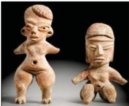
● قطع الأثرية

الأزتك للنساء اللاتي من أناتن الولادة، وهي موزعة بين 300 - 900 بعد الميلاد ويبلغ سعرها الأحيائي 5000 يورو بينما يبلغ تقدير قناع الأزتك 100000 يورو.