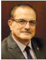
• خيام سروس