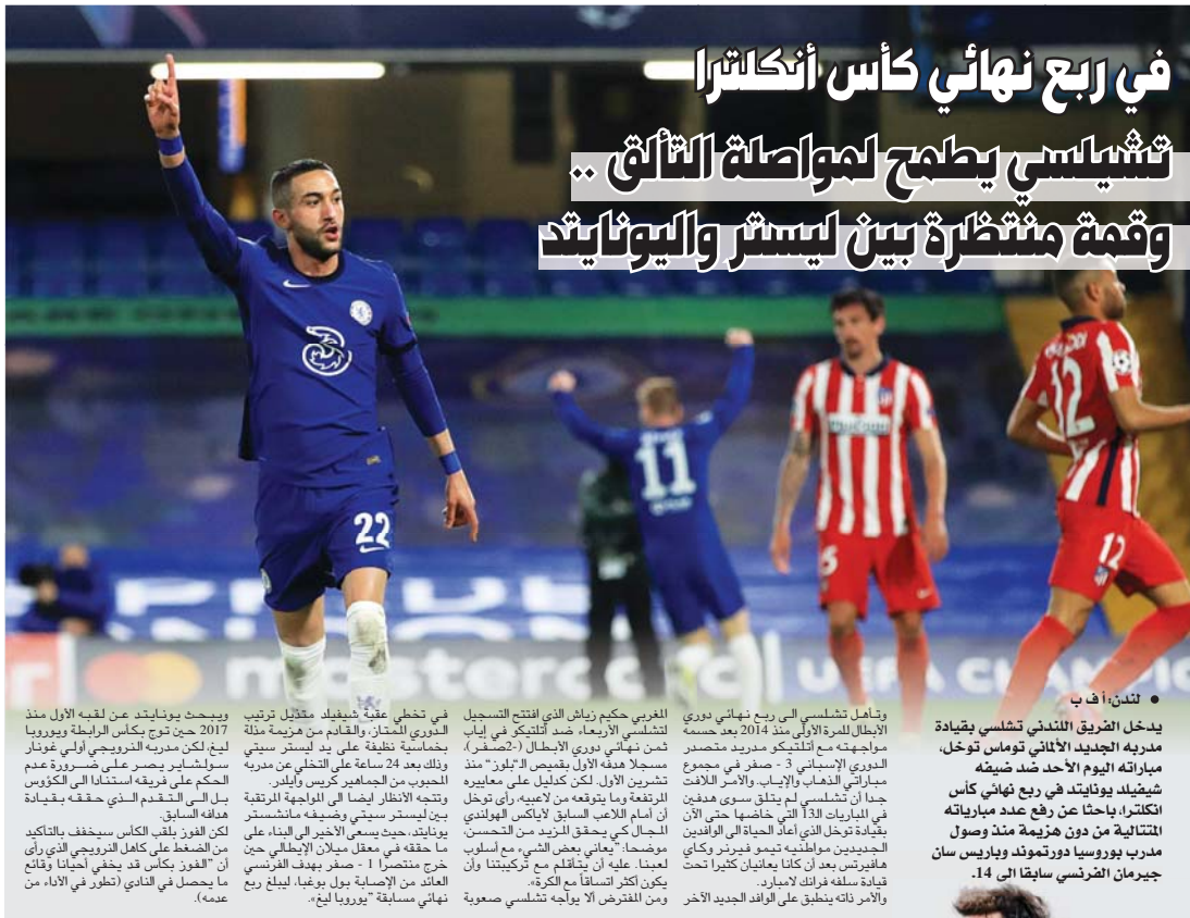
● لندن، أ ف ب

يدخل الشريك اللندني تشيلسي بقيادة مديره الجديد الألماني توماس توخل، مباراته اليوم الأحد ضد ضيفه شيفيلد يونايتد في ربع نهائي كأس أنكلترا، بإحدا عن رفع عدد مبارياته المتتالية من دون هزيمة منذ وصول مدرب بوروسيا دورتموند وباريس سان جيرمان الفرنسي سابقا إلى 14.