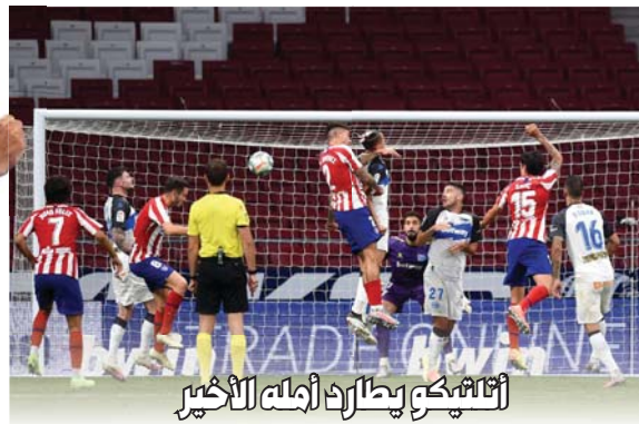
● مدريد، أ ف ب

تسبب تسبب و ز فريفك يبلغان نهائي أكابولكو للتنس تعد الثنائي الأعلى تصنيفا اليوناني ستيفانوس تسبب و ز فريفك في نهائي دورة أكابولكو المكسيكية في كرة للضرب، بمجموعين نظيفتين وتغلب تسبب و ز فريفك على الإيطالي الشاب لورنتسو موزونتي 3 - 0 و 3 - 1 و 3 - 0. وفريفك على مواظته موزونتي كفيفر 4 - 6 و 7 - 6 و 6 - 5. وهذا النهائي الأول منذ العام لتسبب و ز فريفك حاسما عالميا، بينما كان مشوار زفريفك أكثر صعوبة بعد حاجته إلى شوط فاصل "ثاني بريك" أمام كفيفر. وتزامنت مباراة زفريفك مع هزة أرضية بلغت 5.7 درجة ومركزها على بعد 60 كيلومترا في سان ماركس. وقال زفريفك: "بدأت الاضواء ترتجف وشعر بها الجمهور أكثر من أنا." وأضاف الألماني: "كنت نركض في الملعب لذا تعبت علينا خوض النقطة أثناء الهزة. لم نشعر بالخطر، لكن عرفنا لها هنا في أكابولكو." وسيجت زفريفك في لقبه الرابع عشر في بطولات المحترفين، عندما يواجه تسبب و ز فريفك في جعبته خمسة ألعاب، وكان تسبب و ز فريفك يخوض نصف النهائي الثالث له هذه السنة، بعد بطولة أستراليا المفتوحة ودورة ووتردام الهولندية. وقال اليوناني الذي فاز خمس مرات من أصل ست مباريات أمام زفريفك: "أتابعه منذ أكثر من 10 سنوات. لعبت ضد ساشا من قبل ولم يكن سهلا أبدا. كلانا متعظم وقادر على منافسة قوية."