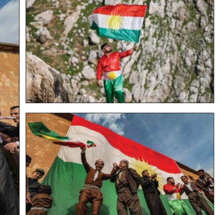
أشخاص يرفعون العلم الوطني في احتفالات عيد النوروز في قضاء عقرة شرقي دهوك.