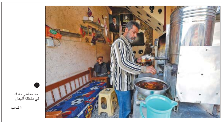
احد مقاهي بغداد في منطقة الميادين