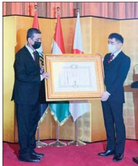
• السفير الياباني يسلم جائزة الامبراطور

سليم مسفير الياباني لدى العراق سوزوكي كورتارو الخسيس اللقب في مقر فضيلة اليابان في اربيل، وسام الشمس المشرقة والأشعة الذهبية مع زينت الى نائب رئيس السليمانية من أجل السلام ورئيس بلدية حلبجة السابق خضر كرم الذي منحه اياه امبراطور اليابان في العام 2020.