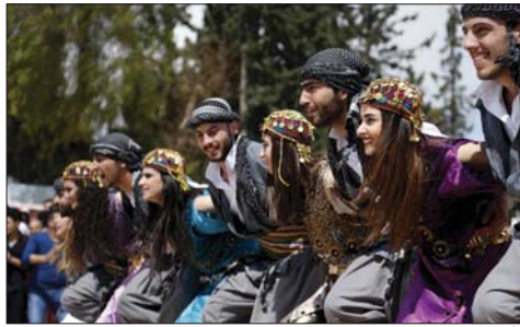
• ازياء بلون البهجة والضح

تري... اين نحن من مقترحات هذا العالم الذي يبني وجوده بكفالات ايتانه، من دون ان يستسلم لأية قوة اجنبية تريد اضمحلاله وابتلاعه وتحويله الى بلد هامشي؟