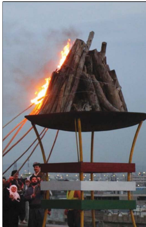
● بغداد شعلة نوروز امام قلعة اربيل