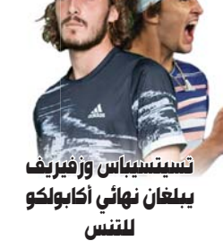
● أكابولكو، أ ف ب

أنه يتخلف عنه بنقطة فقط مع مباراة مؤجلة في جعبته ضد نابولي ويخوض رجال الحرب أندريا بيرلو اختيارا سهلا على الورق ضد النجم البرتغالي كريستيانو رونالدو الذي رد على جميع منتقديه بعد الخروج من ثمن نهائي دوري الأبطال على يد بوليفيا بوش بتسجيله ثلاثة في الجولة الماضية ككباري رافعا رصيده في صدارة الهاندي إلى 33 هدفاً.