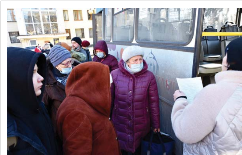
في مؤشر على قرب احتياج روسيا لوكراينا، أجلت وزارة الطوارئ في جمهورية دونيتسك الشعبية المعلنة من جانب واحد أكثر من 6.5 آلاف شخص من دونيتسك بينهم 2.9 ألف طفل، وتشهد منطقة روستوف الروسية توافد اللاجئين من لوغانسك ودونيتسك منذ صباح أمس السبت، معظمهم من النساء والأطفال وكبار السن.

الأزمة اللبنانية التي تلقى بتلاها القاذبة على البولنديين ومنها أزمة الكهرباء التي عززت الحكومة اللبنانية من اجراء الحلول الأتية لها، غير أن وزير الطاقة إيهاب البستاني يلمد فياض أكثر أن وزارته ماضية في خطة النهوض بقطاع الكهرباء، بقوله "نأمل أن نصل للخطوة وليس الهدف تحقيق مكاسب سياسية لأحد، فالخطة واقعية وتعرض زيادة التقنيّة لنصل إلى 24 ساعة تغذية في عام 2025 تدريجياً". وكشف عن أن الخطة تشمل الإتيان بالغاز وزيادة الأخذ من صناعات النفط الدولية، معلناً أن "التعرفة سوف تكون 70 بالمئة مما يدفع المواطن لأصحاب المواد الخاضعة لتعديلات وأصناف "ما نقتصره هو إصلاح" لتشارك القطاع الخاص، وهي ليست تعديلات تشترك بإستراتيجية الهيئة الناظفة، وهذه الهيئة يجب أن تأخذ من صلاحيات الوزير".