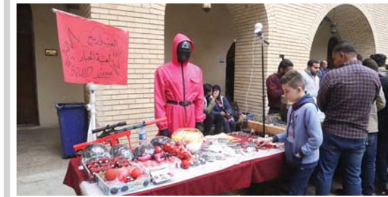
صورة وتعليق العب وارب بسطات للتشيط ذاكرة الطفل بعيدا عن التكنولوجيا.