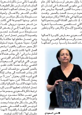
● منى السعودي

● ميرزا يوسف لا أصف نفسي كفنّانة أو رسامة وخطّامة، بل أرى نفسي فيها كلها. أمالي هي أنا، تصمت لحياتي وأفكاري، هكذا كانت تصف الفنانة والشاعرة منى السعودي أمالها. تعدت منى السعودي التي رحلت عن عالمنا بعد صراع مع المرض في 6 من شباط الحالي من أكبر أكتانتين في العالم العربي، ولدت الفنانة علاقة مع الحسرة والصخور والتحويلات حيث كانت تفضن حور سنبيل الحوريات ومجموعة من الآثار الرومانية، بعمان وكان لهذه العلاقة تأثير مهم في موتها في الحنت. تعدت منى رائدة في النحت التجريدي فُتُوع المادة وتُصَلِّطها لتسوع فلسفتها، وتتفق خلالها والنحت العربي محفزات تتكامل من خلالها منحوتها برسوماتها. بدأت بنحت أعمالها الأولى في العشرين من عمرها، وأول معرض لرسوماتها كان عام 1965 في مقهى الصحافة في لبنان، ثم النحت بمدرسة الفنون الجميلة في باريس عام 1964 حيث درست النحت بالحجر وقامت أول منحوتاتها في عام 1965 وكان موضوعها الأبرمة، إلى تشيخيز الفنانة ولي منحوتاتها الهائلة التي تستعقبها حساسية شعرية بالغة ومواضيع الإبداع، الأرض، والأم وتطور الكائنات. قامت السعودي بعروض كثيرة لامعاليها في الشرق والوسط والبرسيم بالعالم العربي وأوروبا والولايات المتحدة وآسيا، ومن أعمالها