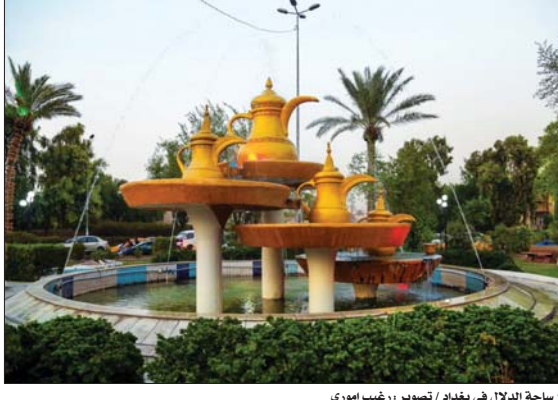
ساحة الدلال في بغداد