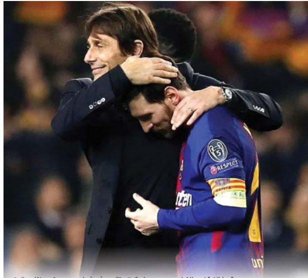
ميلانو / آ ف ب

اليه أوائل الشهر المقبل بحسب وسائل إعلام إيطالية. وقال كونتي "لا أعتقد أن هناك مجنوناً في العالم لا يريد ميسي، لكنه بعيد جداً عنا، وما نريد بناه". ويوليون ميسي من برشلونة إلى "بارتوسوري" - عدا أن أفضل لاعب في العالم "بعد جدا عما نريد بناه". وجاء حديث كونتي بعد فوز إنتر على جنوى 3 - صفر ما سمح له بأن يصعد إلى المركز الثاني في ترتيب الدوري المحلي على حساب لاتانزا، وراداً على التقارير التي تتحدث عن إمكانية قدوم ميسي إلى الفريق الأسود والأزرق بعد أن قام والده ووكيل أعماله، خورخي بشار، منزل في ميلانو سينتقل إسبانياً.