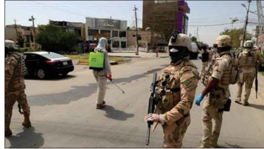
بغداد / الصباح حزام محمد حبيب

باشنا معامل إنتاج الأكسجين الطبي، على أن تقدم لهم جميع التسهيلات والتنسيق مع هيئة الاستثمار والجهات الوطنية في اجتماع ترأسه رئيس مجلس الوزراء، مصطفى الكاظمي، أمس الأحد، فرض حظر شامل للتجوال لعمرة أيام، بدءاً من يوم الخميس 27 تموز 2020، في محاولة شبكة الإعلام العراقي بتكثيف البرامج التثقيفية والتوعوية بشأن الوباء من جائحة كورونا، في حين حذرت منظمة الصحة العالمية من تعرض العراق إلى موجة جديدة من الاصابات بكوفيد 19 في حال عدم الالتزام بالاجراءات الوقائية.