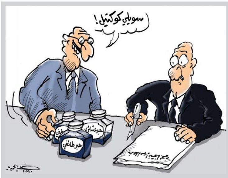
• كاريكاتير: خضير الجيمري

اخيرا وليس اخرا فإن قرار توزيع الأراضي، سيقضي عمقا ما لم تكن هناك خطط عملية وعلمية في مجال البنى التحتية والمخافة على هيئة وشكل المدن، غير ان هذه المخاوف لا تعني ان القرار لم يكن مفرجحا لعامة الشعب العراقي.