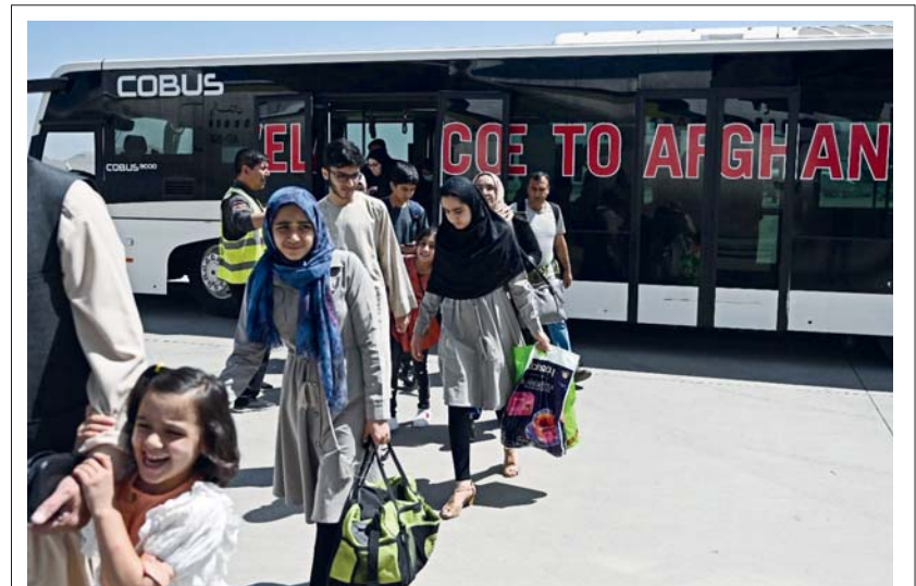
● وصلت أول رحلة تجارية دولية إلى العاصمة الأفغانية (كابل)، أمس الاثنين، منذ سيطرة حركة «طالبان» على السلطة، وكان على متن رحلة الخطوط الجوية الباكستانية (بي إي إيه) القادمة من إسلام آباد نحو 10 أشخاص فقط. ويعد استئناف الرحلات التجارية اختباراً رئيساً للحركة التي وعدت مراراً وتكراراً بإسماح للأفغان الذين يحملون وثائق صحفية بمغادرة البلاد بحرية.