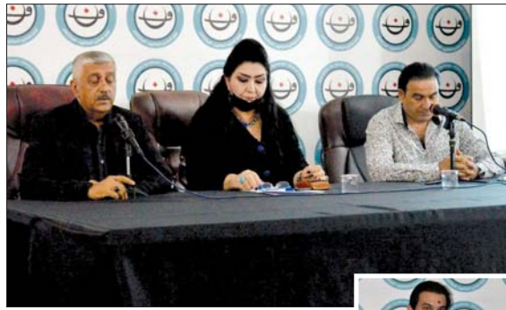
جانب من التابن

أقامت نقابة الفنانين العراقيين حفلاً تأييدياً بمناسبة مرور أربعين يوماً على رحيل الفنان علي سالم، ابتداءً من حفل التابن بقرعة ما تبصر من القرآن الكريم تلاوة للقرآن الكريم، قبل أن تعطي الفنانة التشكيلية بشرى مسميم المنصبة لتتحدث عن الأراحل بالفول الحديث عن علي سالم، يعني لي حشرات حارقة ودموعاً مفلقلة وحزناً عميقاً يعصف بي، منذ أن غادر لي هذا اليوم لا يزال هذا الولد الطيب جداً، الجحول جداً، النقي جداً مثلاً أمامي بكل ذكرياته وصوره وموسيقاه، علي سالم سيرة قصيرة موجعة لا يمكن أن تفصلها عن وجع والم هذا البلد..