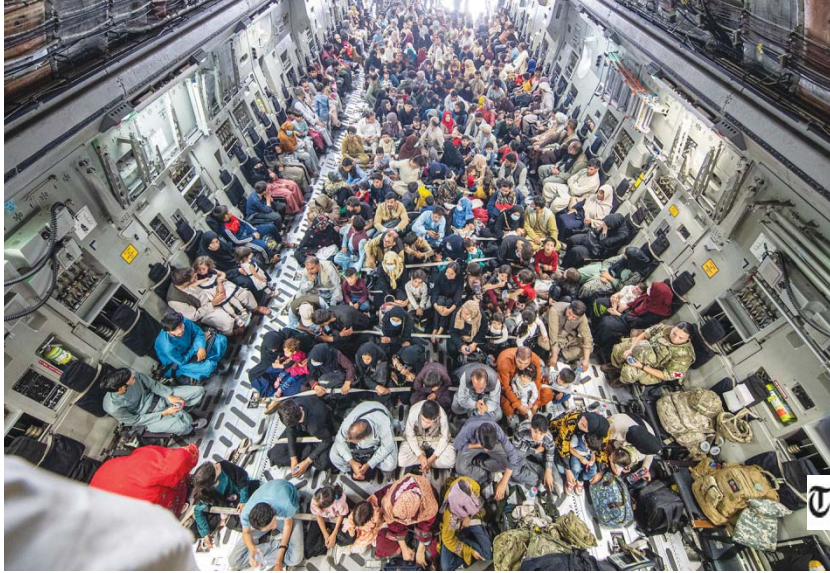
● طائرة شحن أميركية عسكرية تنقل لاجئين أفغانين فروا من البلاد

أحدهم صحفي لدى وكالة أنباء أجنبية، والأخر يعمل مع منظمة مساعدات غير حكومية تطور المجتمعات الريفية، والثالث فنان وجد الإلهام في موطنه كابول. سابقا، لم يرغب أي منهم بالمغادرة، لكن الجميع الآن يريدون الخروج، وقد غادر بعضهم البلاد بالفعل، متضمنين إلى أفواج الهجرة بنسب خطيرة درجة جعلت حتى حركة طالبان، التي عليها إدارة أحد أفقر بلدان العالم، تلاحظ هذا الحال المرعب، لأن معظم المهاجرين هم من الملاكات الفنية والعلمية الوسطية في أفغانستان، وتمحو هجرتهم المكاسب القليلة التي تحققت خلال تجربة العشرين سنة الماضية لبناء البلد، كان ثمنها دماء ومليارات من الدولارات، خاضت فيها البلاد أوقاتا عصيبة لبناء الدولة.