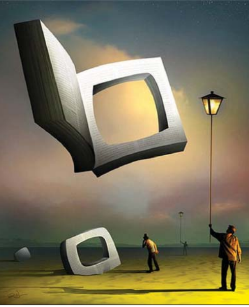
لوحة السرياني مارسيل كرام

الرمز التي يستعقبها الأديب إحداث الفارق بين اللغة الطبيعية واللغة الأدبية، بما يعني أن اللغة الأدبية هي في جوهرها لغة رمزية تتجاوز حيزها حدود اللغة الطبيعية كي تدخل في فضاء البيان والمجاز، وهو فضاء لا يتكون ولا يتأسس ولا يفعل فعله إلا في بدي الرمز. يتباين الرمز شكلاً وصورةً وفعلًا وتأثيرًا بحسب طبيعة الجنس الأدبي الذي يستخدمه الكاتب فالرمز الشعري غير الرمز القصصي أو الروائي أو المسرحي أو الغائي، فكل جنس أدبي أو نوع داخل كل جنس رمزاٌ خاصاً يتلامح مع طبيعته الأجنبية أو النوعية، فاللغة في الخطاب الشعري تنتهج بالكتابة