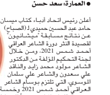
ميشانيون لقصيدة النثر الشعري