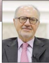
د.علي عبد الامير علاوي

أكد وزير المالية د.علي عبد الامير علاوي «توجه الوزارة للنهوض بواقع التأمين في العراق، وبعد من اولويات العمل المهمة وأحد مفاصل قطاع المال»، وأضاف في حديث لـ «الصباح» أن «قطاع التأمين الحكومي يمكن وصفه بالجيء، غير انه تم بتأهذ على نوع من الاحتكار، ويتطلب بعض الاجراءات لتطوير مفاصل عمله».