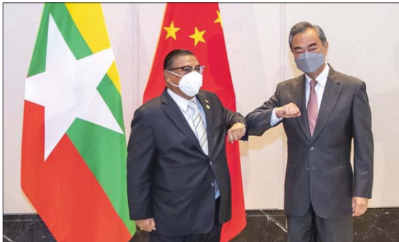
● وزير خارجية الصين وميانمار

في البدء كانت كوريا الشمالية ومن ثم ميانمار، وأن أفغانستان. ثلاث أزمات مستمرة تبرز لدى جيران الصين، ولا توجد مشتركات كثيرة بينها، لكن بالنسبة لبكين تفرض تلك الأزمات السؤال نفسه، كيف تتعامل مع دول مهمة ستراتيجيا وقاطنة أيضا على حدودها، وكيف ستجد استجابة الصين هويتها كقوة عالمية. استمر مراقبو الصين في الغرب منذ سنوات كثيرة بالبحث عن خطوط بشأن كيفية ممارسة قوة صاعدة نفوذها على المسرح العالمي، عبر إخراتها بالقضايا الأفريقية أو علاقاتها مع أميركا، لكن الطريقة التي تتبناها بكن مع الدول المجاورة الثلاث قد توفر صورة أوضح.