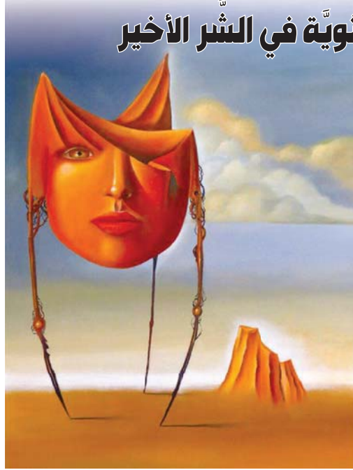
لوحة الفنان السرياني روبن كوكبير