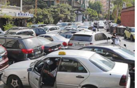
تتظاهر أزمة الحرفقات في لبنان.

المنسفة الخاصة للأمين العام للأمم المتحدة في لبنان جوانا روتيسكا أن «اختراق الطائرات الإسرائيلية للأجواء اللبنانية انتهاك جديد للسيادة اللبنانية» وللقرار 1701 ما يستوجب تحركاً سريعاً للأمم المتحدة لضمان عدم تكراره ووضع حد له. وقد أعلن مصدر عسكري سوري «العهد الإسرائيلي نفذ منتصف ليل الخميس، عدواناً جدياً برشقات من الصواريخ من اتجاه جنوب شرق بيروت، مستهدفاً بعض النقاط في محيط مدينة دمشق، ومحيط مدينة حمص». وعلى سعيد تشكيل الحكومة، عقد مجلس النواب اللبناني جلسة له أمس الجمعة خصصت ثلاثة رسائل رئيس الجمهورية في ما يتعلق بقرار حاكم مصرف لبنان رفع الدعم عن الحرفقات وبعد سلسلة كلمات لرؤساء الكتل السياسية تخللتها نقاشات حامية لإسراع بتشكيل حكومة جديدة ورفع دعم المصرف المركزي عن النواذ قرار حاكم مصرف لبنان رياض وسورية الإسراع بتوزيع البطاقة التموينية للأسر الفقيرة.