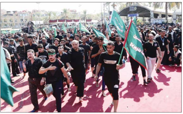
مؤتمر صحفي حضرته الصباح نجاح الخطه

الحالية، وامت مظاهر الحزن القضية ونواحي المحافظة، واستحقت الشوارع والاماكن الرئيسية الطعام والشراب للجميع المشاركة بأجواء هذه المناسبة المنظمة بحضور أمن لانت.