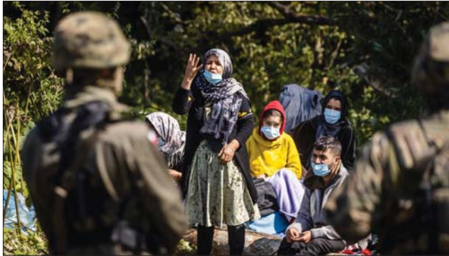
عدد من المهاجرين الأفغان العائدين في الحدود البونديية مع بيلاروسيا. على الرغم من تعهد الحكومة البونديية بحماية أراضيها من المهاجرين الذين يصلون عبر حدودها من خلال مد حاجز من الأسلاك الشائكة على طول الحدود وتحسينها بمزيد من القوات.

نحو 3000 شخص من مطار حامد كرزاي الدولي في 16 رحلة بطائرات من طراز سي 171، متفنياً أن قرابة 350 منهم مواطنون أمريكيون، وأشار أن من يحمل عدد من الاجلحام الجيش منذ 14 آب بلغ نحو تسعة آلاف.