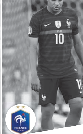
قبل مواجهات ربع نهائي كأس أوروبا