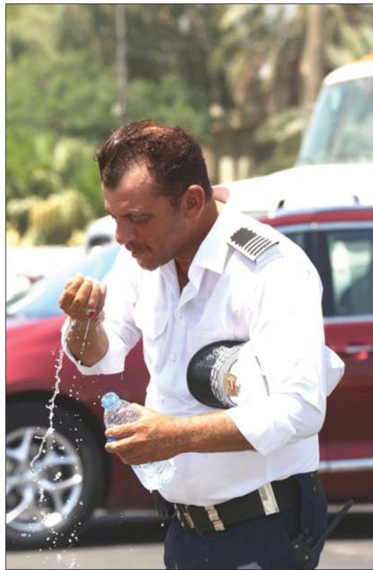
● تعطيل الدوام الرسمي اليوم بسبب ارتفاع درجات الحرارة..