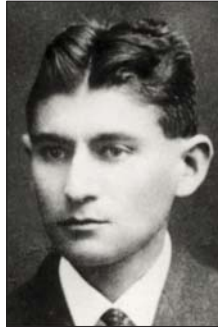
• فرانز كافكا

هو نفسه القاضي وهو المنفذ للحكم ما المختلف إذن في رواية كافكا... فمنذ بدء التاريخ البشري كانت الجريمة وكان ثمة قائل وهابيل؟