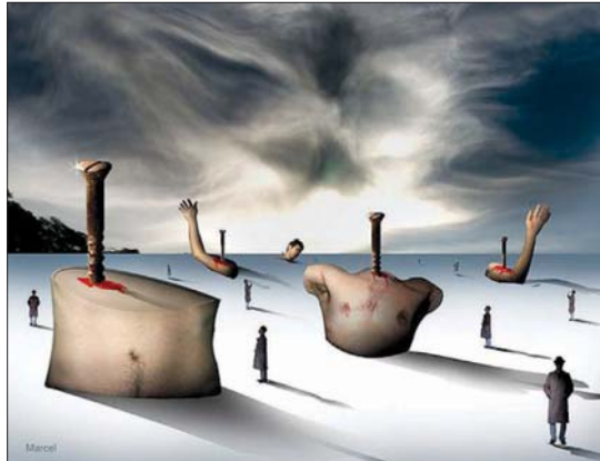
• لوحة الفنان مارسيل كارام

ينفتح نص حوار بلغة السكين على حوارية بين شخصين وينفتح بارتباط بالحياة ومفرداتها، وتتخذ مفردات الأفعال بلغة تعميمها للملافة على السطح الجماعي للإرتباط بهذه المفردات لترتبط مع الأشخاص عارفاً مسبوهاً (مسيوفاً) وتتصاهم وتيرة الحوارية الاتهامية في سياقات التعميم ضمن مفردات تخوض الطيور على التور والانهار على الثورة والعرى على سر يمت إلى هذه المفردات الاتهامية تنتقل من كونها الفردي إلى الكون الجماعي بوصفها مفردات للإرتباط بالجماع البشري ومع تصاهمة هذه الحوارية تتأكد مقصدات الشاعر في التوير/ إن دمك أخضر/ يوم حاضرتومي الكف/ في العشب/ فاحضوض دمي/ فلماذا تخوض الطيور على التوردة/ والانهار على الثورة/ بعينيك قد عثرنا على سر يمت إلى الأهور بموجة/ وتحت الجهر/ هذا دمك في/ الرض ألف قطر/ ما تشتم السلطان في الإحلال/ يره ولد/ أبكم لكاسي الصمت/ وداني فقر الكلام/ ليدنا آلة قاطعة مثل سكين/ صرخة الوردة مثلا/ ليست احتجاجا ضد الدولة/ سيرك في الليل/ نائما إلا يثير غبار الأسلطة/ هذا الشيب المتمد/ كحقل القطر/ على وجهه الأ بعني مؤامرة/ بالأس. قرب النهار/ لحك الخبز السري/ وانت ستبضخ ضد التيار/ واليوم في المقهى/ ذرفت الكثير من الصمت/ مخزنا السري/ والذي ينافقه بقفني لترك/ لم يجدد ضاحكا قط/ فمن جيبيك تنبئت/ وأتحة عصافير ميتة/ ورفي راسك تنو/ أزهار غريبة/ وقد حان موعد/ قطفها مع