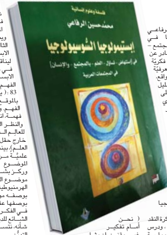
نسخة أمام تفكير غير مفتح، إن مثل

كتاب الدكتور محمد حسين الرفاعي (ابستمولوجيا السوسولوجيا في استنفاض - تسائل - العلم بالمجتمع - والانسان في المجتمعات العربية الصارن عن تاريخ التنوير - 237 صفحة مسيحة فكرية عميقة بقصولة الحجة بالأسئلة المعرفية المعرفية مع اجابات تتماشى مع الواقع من خلال فهمه العميق لآليات التحليل الفلسفي للظواهر ليضع النقاط على الحروف يشمرعه الثقافي الفكري الفلسفي الذي خلقه الفكر عبد الجبار الرفاعي، ومدرسه الفكرية في تناول الوجود الانساني والمعرفة الحقيقية للاسئلة الفلسفية، التي يواجهها العقل العربي، جاء، بالمقدمة من 9 (التأسيسية العلمية تاتي بمعرفة علمية من شأنها تغيير نمى في كل مرة، هنا من شأن العلم، في علاقته بالظاهرة بالواقع)، فقد تناول، محمد حسين الرفاعي بالفصل الأول، يقدم الفهم السوسولوجيا علوم المجتمع والانسان، لأن لولا فهم الابدولوجيا لما كانت وتكون مأسستها.