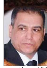
القاضي رديم العكيلي