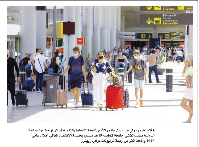
● أكد تقرير دولي صدر عن مؤتمر الأمم المتحدة للتجارة والتنمية أن انهيار قطاع السياحة الدولية يسبب تشي جناحة كوفيد-19 قد يسبب بخسارة الاقتصاد العالمي خلال عامي 2020 و 2021 أكثر من أربعة تريليونات دولار.