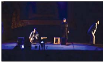
جانب من المسرحية