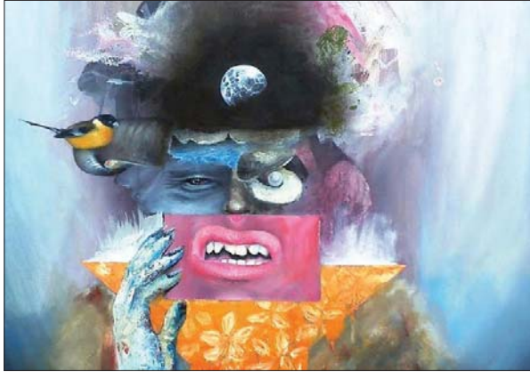
• لوحة الفنان سعد زويه

قبل التعليق الفلسفي لتساؤل عما يثير المشاعر القومية ويوجهها؟ ظاهرة اعتزاز ومحبة للانتماء، الانتماء إلى الأرض- الوطن والتراث- ثقافة والتاريخ أحياناً، هنا يضاف لها صنع مستقلة غير متصلة عما كان، ما سبب هذه الإضافة؟ السبب مشترك مع مراكز الانتماء التي سلفت.