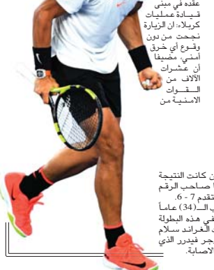
● نادل يقرب من لقب بطولة فرنسا للتنس

مختلف المستوف شاركوا في تنفيذ لحظة الأمانة. وتعدت إلى أن التبرعات كانت مهددة من بعض الجهات الإرهابية وعصابات الجريمة المنظمة لكن العمليات الاستباقية وبقطة الأجهزة الأمنية الخفلة أسهمت بنجاح هذه المناسبة. وفي تصريح لـ «المصباح» أوضح عثمان الغانمي، أن جميع المحافظات ما أسهم بدخول ملايين الزوار في مدينة كربلاء على الرغم من وفق المستوف من وقت متأخر من الزيارة. وقال الغانمي في مؤتمر الصحافي عقد في مبنى قيادة عمليات كربلاء، أن الزيارة نجحت من دون وقوع أي خرق أمني، مضيفاً أن عشرات القوات الأمنية من مختلف المحافظات شاركوا في تنفيذ لحظة الأمانة.