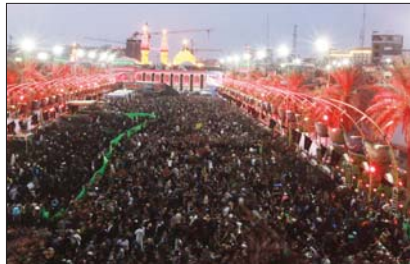
جانب من الزيارة الأربعينية

من قوات الشرطة والجيش والحشد الشعبي، التي وفرت الحماية الكاملة للزائرين، كما واتسمت بخاصة الشكر والثناء للوزارات والجهات الصحية، ومراكز الإعلام التي كانت بالجهود المتميزة وسرعة الاستجابة، التي كانت خير سند في حشد الزائرين على الأقدام بالتحديات الأمنية والتقيّد بشروط الرقابة الصحية.