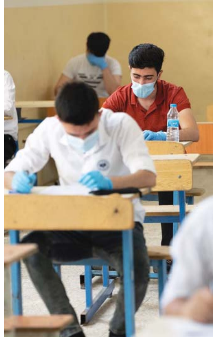
● امتحانات السادس الإعدادي

وأضاف، لقد تم تأمين هذا الإجراء المشترك بالرغم من الظروف الصعبة التي يفرضها تفشي فيروس كورونا على مختلف دول العالم ومنها العراق، معبراً عن أنه «في ان تكون هذه الخطوة مقدمة لعمل الخاص في العراق يكون قادراً على المنافسة والسماحة في دعم التنمية المستدامة في البلاد». وشدت وزارة الخارجية «جهود» البنك الأوروبي لإعادة الإعمار والتنمية لا سيما أعضاء مجلس المحافظين والأمين العام أنزو كارتوربيوشين وموظفي مكتب الأمين العام.