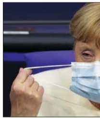
أما اسكتلندا، ففرضت حظراً لاسبوعين على ارتداء الحائات في مدنيتها الرئيسية غلاسكو وأدنبره، الزباد بذلك الضغط على رئيس الوزراء

البريطاني بريس جونسون لفرض تدابير مماثلة في انكلترا. لكن استخبارات المصاورة عن خبيرة الصحة حول ارتفاع عدد الإصابات تصطم بمعارضة متزايدة لتأجيل التدابير في العيد من الوباء لا سيما من قبل أصحاب الأعمال التجاري الاكثر تأثرا بالإجراءات ومظاهرين متشككين بفعاليتها.