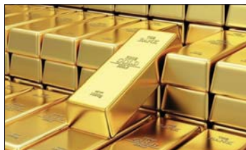
● سياتك ذهبية

ارتفعت أسعار الذهب عالمياً بأكثر من 22 دولاراً خلال تعاملات الجمعة، مع هبوط العملة الأميركية وتغالل المستثمرين بإمكانية تقديم مساعدات مالية للاقتصاد الأميركي لمواجهة تداعيات وباء كورونا. وارتفع الذهب، الذي ينظر إليه على نطاق واسع على أنه وسيلة تحوط ضد التضخم وانخفاض العملة، بنحو 26 بالمئة هذا العام، مدفوعاً بتغير غير متسوق من الحكومات والبنوك المركزية الكبرى للتحفيز من الأثر الاقتصادي للوباء. وارتفع سعر العقود الآجلة للذهب تسليم كانون الأول بنسبة 1.2 بالمئة إلى ما يعادل 2240 دولاراً ليصل إلى مستوى 1917.50 دولاراً للأونصة.