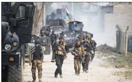
عملية أمنية لجهاز مكافحة الإرهاب

على صعيد تمكثت مفارز جهاز الأمن الوطني في محافظة الانبار، من القا، القبض على