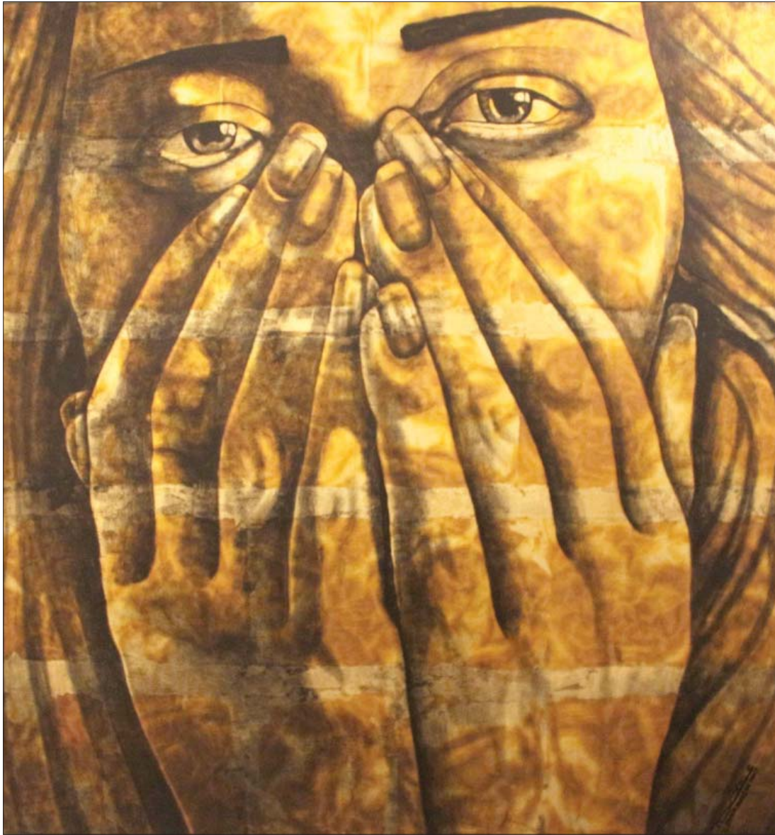
لوحة لفتان فتاح المرسل