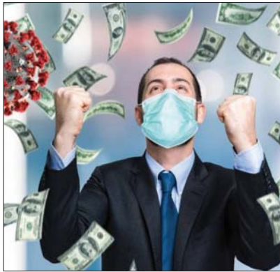
● ثروات اغنياء العالم ترتفع بقيمة الربع

ويجد هذا التقرير أيضاً أن عدد المليارييرات في مختلف مناطق العالم زاد بشكل طفيف ليقترب الفين ومئتي ثري، ويقيف أعلى رقم في العالم جيف بيروس - مالك موقع الامازون - الذي تشير التقديرات إلى أنه يملك نحو مئتي مليار دولار. ويقول محللون إن ثروته مرتبطة بأداء أسواق البورصات التي تعافت منذ بداية الوباء، بعدما أطلقت مختلف الحكومات حزمًا لتخفيف الاقتصاد بهدف التصدي لتأثيرات كوفيد-19. وذكر بنك UBS وشبكة PwC المتخصصة في تقديم خدمات مهنية متعددة الجنسيات وتتخذ من لندن مقرها، أن ثراء المليارييرات وصل إلى مستويات قياسية في ظل تفشي كوفيد-19. ولتعاش أسعار الأسهم وماكاسب البورصات في التكنولوجيا والعناية الصحية. ووجد التقرير، الذي غطى أكثر من 2000 ثري يملكون نحو 98 بالمئة من ثروة العالم، أن ثروات المليارييرات تمت أكثر من الربع خلال الشهور الأولى لتفشي الوباء، بحيث وصلت إلى 10.2 تريليون