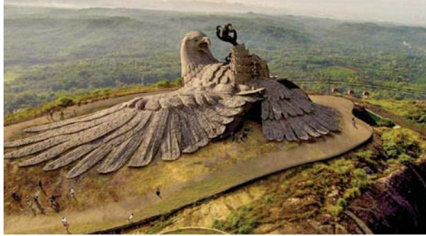
تمثال الطائر الأسطوري نحتت ريجيف أمثال

من أهم الاكتشافات التي يكتشفها الإنسان في حياته هو عجزه عن فهم نفسه فهنا يقفنا ثامنا كاملاً ساهلاً وعجزه عن اكتشاف الطبيعة الإنسانية وفهمها فهنا علمياً تفصيلاً. وإن كان بعض الناس لحظة تتحدث معه يخبرك أنه يعرف بدقة والتفصيل، ويعرف كل شيء في داخله، وهو لا يدري أنك أنت لا تعرف نفسك إلى هذه الدرجة التي يزعمها.