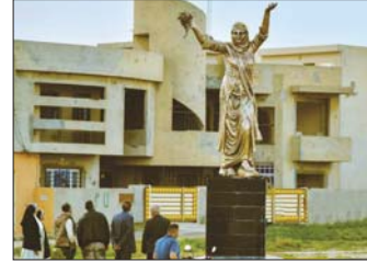
● نصب يحمل المكان

واضناً أن "الفننان لآبد أن يسهم في توثيق الذكريات والمآسي التي مر بها أبناء محافظته، لاسيما بعد ترك منازلهم الجميلة والعودة إليها وهي مهتمة ومدمرة، ليحمل هذا النصب رسالة أمل وتفانٍ، مواصلاً متمني أن يبقى مفتاح العودة بأيد أصيلة تعمل ليلاً ونهاراً على استرجاع حقوق أبناء، الموصول.