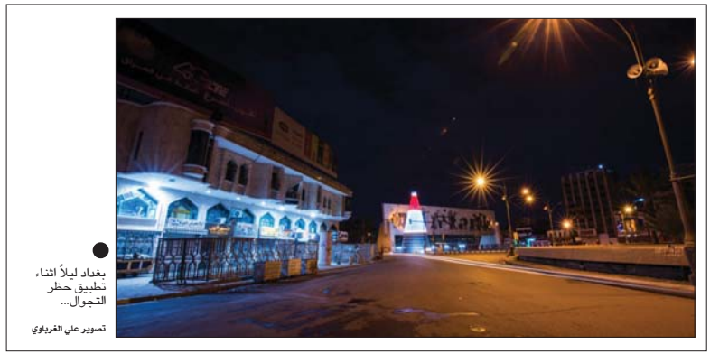
بغداد ليلاً أثناء تطبيق حظر التجوال...

استأنف مصرف الرشيد، منح السلف لمنتهسي وزارتي الدفاع والداخلية، وذكر المكتب الاعلامى للمصرف، فى بيان أنه "باشتر لتسح من خلال تفعيل النظام الالى الجديد وكمرحلة أولى لمنتهسي الوزارتين اعلاه، وأضاف ان "هذا النظام سيستجيب للمستلف الحصول على السلفة خلال (72) ساعة"، لافتاً إلى ان "المصرف وفى وقت سابق أعلن إيقاف السلف لأغراض التطبيق والانتقال بالنظام الالى الجديد"، من جانب آخر، وأصلت ملاكات مصرف الرشيد الزيارات الميدانية لتوزيع البطاقات الالى لمنتهسي وزارتي الدفاع ومنهم القروض والسلف حيث تم توزيع بطاقات الفرق العسكرية (20-16-15) وملاكات غرب نينوى وسيتم إنجاز جميع الطلبات خلال الأيام المقبلة للمرحلة الأولى لمشروع التوظيف.