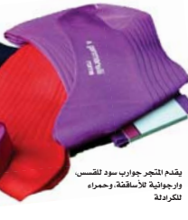
يقدم متجر جوارب سورا للنسب، ووجباته للأساقفة، وممراء تكريفة

خطاطو الجيل السادس "لورنزو غاماريلي" وأبناء عومته "ماسيميليانو" و"ستيفانو بارولو" هم الجيل السادس من الأسرة التي تدير المتجر، الذي اتخذ موقعه الحالي منذ افتتح أبوابه عام 1874. قبل انتخاب البابا الجديد يعرض المتجر في نافذته أزياء بابوية بمقياس صغير ومتوسط وكبير، ويرافق نتائج الانتخاب، يصبح غاماريلي مستعدا لتجهيز ملابس البابا حتى قبل اجتماع مجلس الكرادلة لانتخابه، وقبل ظهوره العلني الأول. يقول لورنزو: "نحن نذهب إلى الخبر الأعظم، ويأتي البابا الآخرون جميعا...". ما زالت الملابس البابوية دون تغيير يذكر منذ نحو ألفي سنة، ما عدا بعض التغيرات البسيطة. البابا "يوحنا بولس الثاني" يرتدي خذ، من دون كعب، والبابا "بولس السادس" يورع لتاج البابوي في متحف، والبابا "بنديكت" يعيد استخدام اللوزيتا "mozzetta"، وهو رداء كثف مخملي أحمر مزين بالقرمز. لكن يبدو مؤخرا أن الملابس البابوية نالت تصميها من الأعياب الثقافي العام، فقد أنتجت مجلة "أسكو" لبر الأبرص سنة 2013 البابا "فرانسيس" أفضل الرجال ملبسا على قيد الحياة وأقام متحف متروبوليتان نيويورك سنة 2018 معرضا لتنتجات فنون الخيطة الكاثوليكية. جامعا بين العروضات الرقبة وقطع من مجموعة المتحف المسيحية التي تعود للقرون الوسطى، ومنها أزياء بابوية وإكسسوارات من خزنة كنيسة سيستين، لم تعرض للكثير منها خارج القاعات كان سابقا.