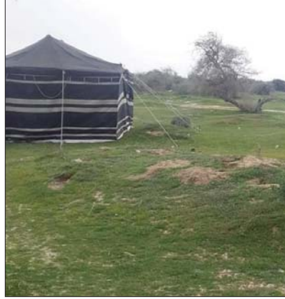
● طويّفة المثقفة بالخضرة والسحر