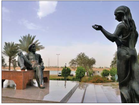
نصب شهريار في شارع ابي نواس...