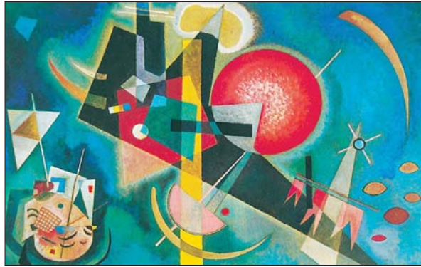
● من أعمال الفنان كاندنسكي

يذهب متذوقو وفقدان الفن التجريدي، إلى أن هذا الفن يمثل بناء شكليا مركبا، على قماشة اللوحة. بينما المعنى والموضوع، فهما عصيان على الفهم، وغالبا ما يتم التأكيد من قبل منظري التجريد إلى أنه مثل استقلا بالفتاحه عن مسات الفن الأخرى وبقي مكتفيا بطقافة عناصر اللوحة، وعلى هذا السياق كما أكد قيمة التجريد الهندسي وطريقة نظامه الشكلي ومحتواه.