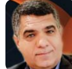
• مهنك السوداني