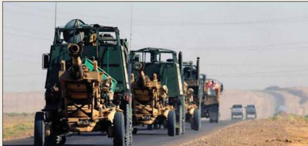
عملية إرادة النصر.

من القبض على خطيب ومسؤول اعلام داعش الارهابي في قضا، مخيم محافظة نينوى، وأوضح البيان، أن «مفاز شعبة الاستخبارات العسكرية في الفرقة 14 وبالتعاون مع استخبارات أو أ 59، تمكنت من إلقاء القبض على مؤذن وخطيب ومسؤول اعلام داعش في منطقة الصلحية إحدى صوامع قضا، مخيم بعد نصب كمين حاكم له وهو أحد المساندين والداعمين والمروجين لعصابات داعش الارهابية في مخيم».