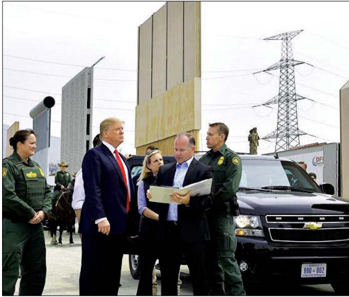
ترامب يتفقد العمل بإجراءات الجدار مع المكسيك

منع قاص فيدرالي في ولاية تكساس إدارة الرئيس الأميركي دونالد ترامب من استخدام 3.6 مليارات دولار مخصصة للجيش لتمويل بناء الجدار الحدودي الجنوبي مع الجارة المكسيك، وأصفاً سلوك هذه الإدارة "غير القانوني".