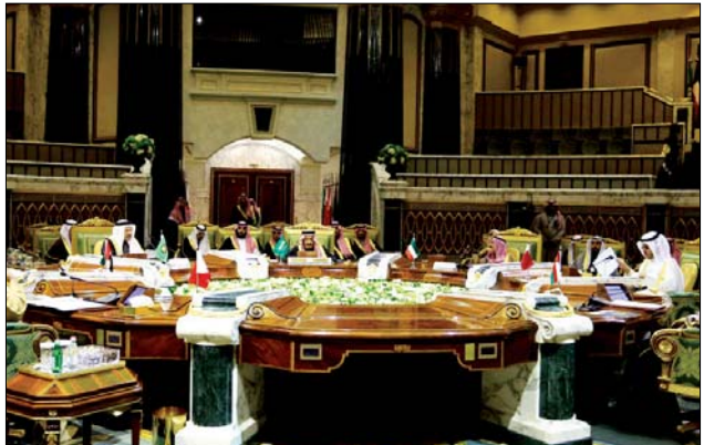
قمة مجلس التعاون الخليجي بالرياض

من جهته قال وزير الخارجية السعودي الأمير فيصل بن فرحان بن عبد الله آل سعود في مؤتمر صحفي أن "استقرار لبنان مهم جدا للمملكة والأهم أن يحمي الشعب