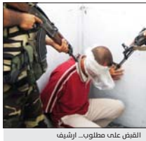
القبض على مطلوب... ارفيد