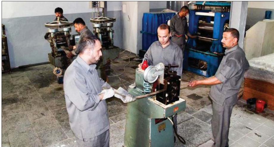
بغداد/ فرح الخفاف

لا يفتخ على اصحاب الانحصان ان الصبر حقت نضجها الصناعية وتنامى اقتصادها في بادئ الامر، يقبل المشاريع الصغيرة والمتوسطة التي اسهمت ايما يقض نسب البطالة، وينصح خبراء بتطبيق هذه التجربة الناجحة التي اصبحت نموذجا عالميا، في العراق.