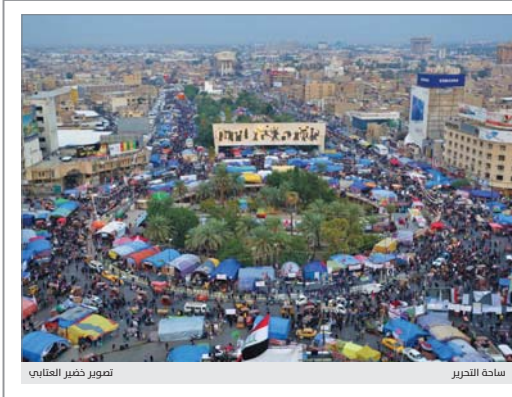
ساحة التحرير