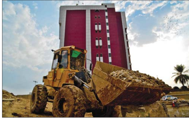
تأخر اقرار الموازنة يمكن ان يعطل تنفيذ العديد من المشاريع الاستثمارية / اريفيو

أقرت اللجنة المالية في مجلس النواب بأن العراق سيدخل عام 2020 بـ «موازنة مؤقتة» بسبب تأخر إرسالها من قبل حكومة تصريف الأعمال الحالية على خلفية إشكال قانوني إجرائي، مبيّنةً إن هذا الحال ينشأ ما حصل في العام الماضي فيقبل تشكيل حكومة رئيس الوزراء عادل عبد المهدي