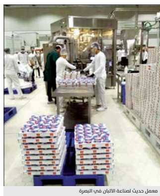
معمل حديث لمعالجة الالبان في البصرة