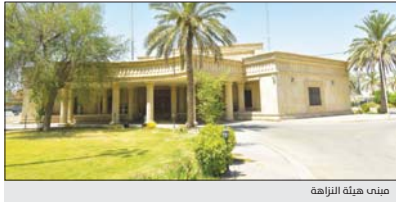
مبنى هيئة النزاهة

الديوانية اصدرت أمر استقدام بحق محافظ الديوانية الحالي، المتهم استقداماً لخصيات لثاء الحكية، على خلفية وجود معالة في اسرار عقود شراء اليات الدوائر المحافظ. واضاف ان مجموع مبالغ العقود التي وُجِدَت معالة في اسرارها بلغ 23 مليار دينار، ممَّا تسبب بهيثر في المال العام. كما اعلنت دائرة التحقيقات في مينة النزاهة، اسر الاربعة، تفاصيل قرار الحكم الصادر بحق ايين سر ذاتي الصحة الاربعة السابق، مشيرة الى قيام المتهم «بالاستيلاء» على المال العام بحسب البيان.