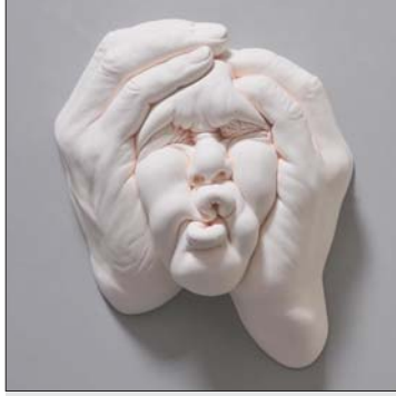
من الفنان جوسون تشانغ

البعد الثاني لرفض عبادة الإلهاء، أن الشباب قد وعى دور في ظل غياب التوجيه، بمعنى أنه افتقد الأوبة، أعلن الدولة لإسوة والتعليم، وأبوة المشاركة الوطنية، فاعتقد شباب الركب دون فاعلية أن ما جرى من صعود لغات مبهمة وتسويقها لشؤون البلاد، وإيماركة المؤسسة الدينية، لهدف كبيرة لا يستفيد منها إلا المومنين، بل من يهونها، ونحن انتبه إلى أنه أصبح لأعباءنا من الخنوع، انتهى إلى أنه قد دخل في لعبة إلهاء، سياسية كبرى، هي