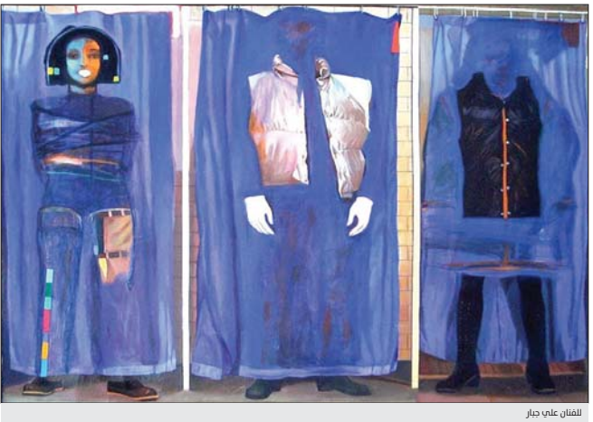
للثقف علي جبار

ليس عسيراً التعرف على هذا المثقف في يومياتنا العربية، فاعلم نمانحه هم من الانتهازيين، ومن الذين تركوا الخصال القديم، واليسار القديم، وصاروا يجدون في لعبة الاسترخاء، ثمكتا لاسوة وظيفية الكاتب الجاهل، فهو