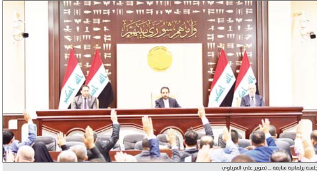
جلسة برلمانية سابقة...

قرر مجلس النواب تأجيل جلسته المقررة أسبوعاً، إلى وقت غير محدد بسبب خلافات الكتل السياسية بشأن فوات مشروع قانون الانتخابات، بينما أعطي مهلة للجنة القانونية لاعداد اجتماعها لحين حسم الجدل على المادة 15 من مشروع القانون. وقال النائب الأول لرئيس البرلمان حسن كريم الكعبي، في بيان صحفي إن «مجلس النواب مطالب اليوم بالاسراع بالقرار قانون انتخابات وصين ومصنف وعادل ويولي طموح الجميع وان يتضمن ضمانات كافية بتكافؤ فرص الجميع، ويحقق التمثيل الافضل لجميع الشرائح المكونة للبرلمان العراقي لاسيما الكثرة والكفاءة على رسم سياسات حديثة قادرة على تحقيق التقدم لبلدنا العراق». وترأس الكعبي اجتماع اللجنة القانونية لمناقشة مشروع قانون انتخابات مجلس النواب بحضور رؤساء الكتل السياسية، ووضح مصدر نيابي مطلع على تصريح صحفي ان «اجتماع رؤساء الكتل السياسية بحضور هيئة رئاسة البرلمان اخفق في حسم قانون الانتخابات والدخول الى الجلسة من اجل التصويت عليه». واضاف ان «السياسيين المختلفين عليهما هما تحديد نسبة 100 بالمئة للقوائم المقترحة في حين اقترحت بعض الكتل السياسية 75 بالمئة للقوائم