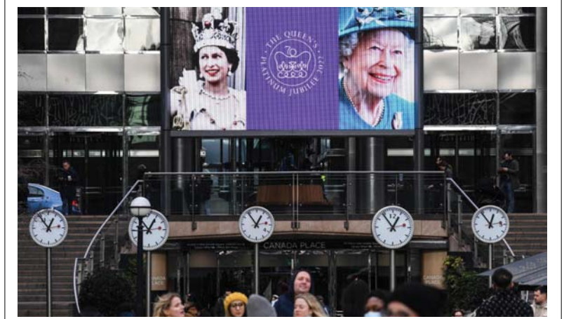
احتفلت الملكة إليزابيث الثانية، أس الأحد، بالذكرى السبعين لاعتلائها عرش بريطانيا إعادة إعلانها أنها تامل في أن تحمل كاميليا زوجة ولي العهد الأمير تشارلز لقب ملكة بصفتها زوجته عند اعتلائه العرش في خبطة انتهت جديلاً حساساً طويلاً بين البريطانيين، وبهذه المناسبة تم سك عملة تذكارية وإصدار أمانة طابع تملك الملكة في مراحل مختلفة من فترة حكمها، وعرض صورها لفترة قصيرة على شاشات عملاقة في عدة مدن بريطانية.

في مقابلة مع مجموعة فونك الإعلامية، قالت لامبريخت: إن ألمانيا "تقدم بالفعل مساهمة مهمة في ليتوانيا"، خلال قيادة مجموعة قتالية تابعة لحلف شمال الأطلسي، بحسب وكالة رويترز. وقالت "من حيث الأمد، تتوفر قوات إضافية كتمزيزات، معروفة ما سيكون له معنى في هذا الصدد". واستبعدت لامبريخت سرعة أخذ قرار بشأن نشر قوات إضافية في ألمانيا قائمة بطلبات محددة إلى وزارتي الخارجية والدفاع في برلين.