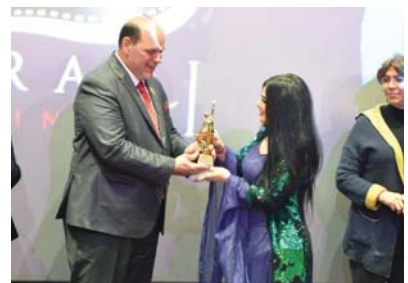
من ارضيف مهرجان السينما النسوية الاول

وتنحصر المشاركات في المهرجان السينمائي النسوي الثاني بالخرجات وكذلك تكريم مجموعة من المخرجات كافة، شمالاً وجنوباً.