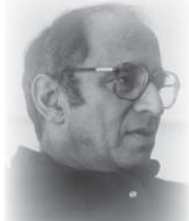
● توماس كون

فكيف يتعامل مع عدم التفرغ على هذه الأسس والعناصر الأساسية لفهم الأحلام، وتفسيرها؟ يقوم ببناء فرضيات من خارج الموضوع، ومن خارج ما أسميته في موضع