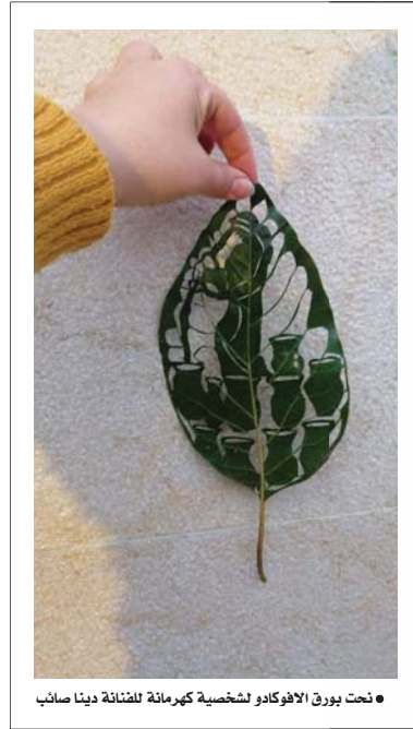
• نحت بورق الافوكادو لشخصية كهرمانة للضائفة دينا صائب

كانت الأناقة الملمحة والألوان الكلاسيكية عنوان مجموعة دار