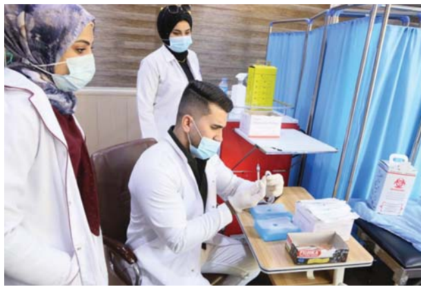
● وزارة الصحة تستلم أكثر من مليون جرعة من لقاح فايزر