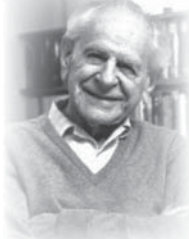
● كارل بوبر

(1) كيف تكون أمام إستمولوجيا مقولوبة على رأسها؟ بعد ذلك كله، أي بعد التعرف إلى ماهية النص - الوحي، نذهب إلى الدعوة الإستمولوجية لسروش في فهم النص، انطلاقاً من الإستمولوجيا العدينية، مدرسة كارل بوبر - إستمولوجيا الرياضيات، فإنه عبر فهم جامد ساكن متخشب يأتي جهاز مفهومي من كارل بوبر - وتوماس كون من أجل أن يوظفه في فهم ماهية النص. ما هي ماهية النص، وفقاً لإستمولوجيا رياضية (من الرياضيات)؟ إنهما ما يمكن أن يوضع داخل العقل، وفقاً لقوانين العقل الضيقية.