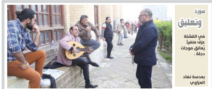
صورة وتعليق في الفشلة عرق منفرد يعانق موجات دجلة . بعدهة نهاد العزاوي