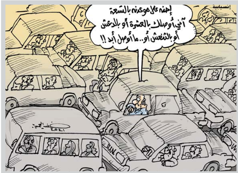
• كاريكاتير: خضير الحميري

هل نجحت آليات الديمقراطية وأدواتها كالانتخابات وكتابة الدستور في تكريس المفاهيم الديمقراطية في العراق؛ ومن هي الجهات المسؤولة عن تكريس هذه المفاهيم وترسيخها في التجربة العراقية؟ عندما تكون هناك حاجة لترسيخ مفاهيم الديمقراطية وبناء دولة مدنية وتحقيق تحول من نظام شمولي متصلط إلى حالة ديمقراطية فمستكون بحاجة إلى أن يخلص المجتمع المدني ومنظماته دورا كبيرا ومؤثرا في ترسيخ مفاهيم الديمقراطية بوصفه آلية حضارية ولبال وفي تقدم أي تجربة ديمقراطية. وبالرغم من أن المواطن العراقي يمارس مقوس الديمقراطية والمتعلقة بوجود انتخابات وصناديق اقتراع وتداول سلمي للسلطة، جاءت بعد كتابة دستور جديد للبلاد، إلا أن الجميع بات يدرك بان الانتخابات بوصفها أحد أهم أدوات الديمقراطية لم تتمكن لوحدتها من تكريس مفاهيم الديمقراطية، وأصبحت أمام مصطلحات بعيدة عن الديمقراطية كالمحاصصة والتوافقية وحكومة الشراكة وغيرها بعيدا عن إرادة الناخب العراقي، ومن هنا لا بد من عمل كبير للمجتمع المدني بوصفه المنهج الأول للثقافة والقيم الديمقراطية الأصلية. ومن الجدير بالذكر أن مفاهيم المجتمع المدني قد غابت طويلا عن المجتمعات العربية والكثير من الدول، في ظل وجود أنظمة شمولية لعقود طويلة من الزمن قام الحكام والأنظمة خلالها بمحاولات لتغيير الدور المهم للمجتمع المدني ومنظماته ومؤسساته، وكل هذا يجعل منظمات المجتمع المدني والتي ظهرت في المشهد العراقي بعد 2003 أمام مسؤولية المشاركة في إعادة البناء الثقافي والسياسي والاجتماعي للإنسان العراقي، وامتيازها الهبة غير الرسمية القادرة على التدخل من دون التطلع إلى مكان لها في السلطة أو الحكومة، لأنها تنطلق باتجاه تربية المواطن وترسيخ المفاهيم الديمقراطية لديه ولدى السياسي على حد سواء.