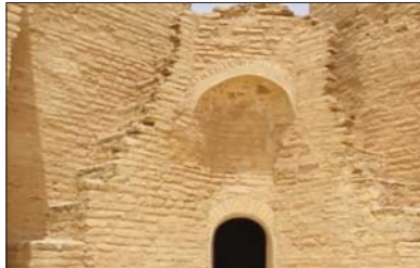
• قلعة ذرب

«استخدمت قلعة ذرب من قبل قادة ثورة الشمرين كخزّن للأسلحة التي يترفع بحملها اصحاب المال او التي يطمونها من الجيش البريطاني».