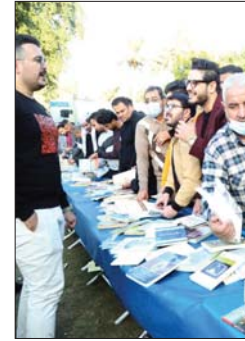
• جانب من المهرجان

يخطوات غير مكرثة ووجه غير مبالية اقتراب الشبان المروجون للحياة، انها الاحلام مرة اخرى تبديد مرارة الواقع، وتلقي سداحة المنطق، هنا حيث اعتادوا على مواجهة ما خلفته الازمات وبعاد وتشتت بذلك الجزء القليل من الأمل.