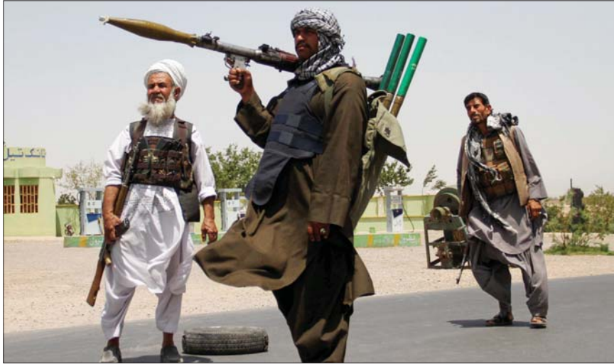
● مقاتلي طالبان في كابل

يبدو أن ظروف التغيير السريع في أفغانستان دهفتها للتمزق الداخلي تحت ضغوط الانقسامات الداخلية التي يمكنها تهديد بقاء حركة طالبان، ما لم يتمكن المختطفون من علاج خلافاتهم مع الوعايات إدارة بلد مضطرب، على خلفية كارثة اقتصادية وإسبانية تلوح في الأفق. تحفزت الكلمات (والسيوف) بين اثنين من أطراف طالبان الكبار، القائد السياسي، «عبد الغني برادار» الذي كان من مؤسسي الحركة مع «ملا محمد عمر» وقاعدة سلطته في قندهار، وبين (الإرهابي) المدرج في قائمة العقوبات «سراج الدين حقاني» المقرب من القاعدة ویراس شبكة حقاني.