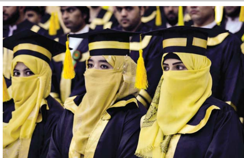
● خريجات جامعة أفغانيا بمدينة قندهار في صف وحدهن بعيدا عن زملائهن الطلبة الذكور، مع تغطية وجوههم، في أول حفل تخرج منذ سيطرة حركة طالبان على البلاد.

وأعرب عن أسفه لضياع الوقت في ست جولات سابقة لمجموعة الاتفاق النووي لم تستمر عن سبب سوء الاحوال لبعض الأطراف ترسخ العقوبات التي فرضها الرئيس ترامب؛ ما دعا المجموعة الغربية إلى العمل على إزالة العقوبات التي فرضت بعد العام 2015 ضد الشعب الإيراني واستغلال الأزمات اللزورية التي ربما لن تكون متاحة في المستقبل.