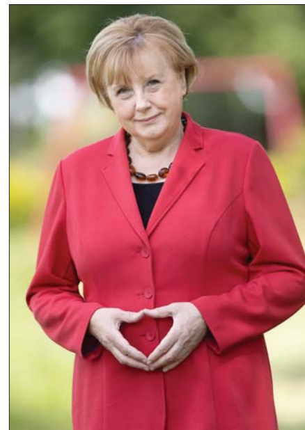
● مع تعلم فانتيكي فن التقليد، بل هذا ما عليه حقا

بعد ستة عشر عاما قضتها وهي تعيش حياة ثانية بدأتها بالصدفة، جسدت خلالها شخصية المستشارة الألمانية أنجيلا ميركل، تنوي أوزولا فانتيكي، التقاعد في الأخرى وإعادة ستراتها الى الخزانة.