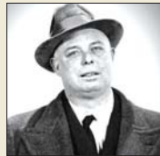
● جان رينوار

مضاعف فيها. تواتت أفلام رينوار الناطقة، والتي لم تبعد كثيراً عن كثيرنا من أيام البهجة المرطبة. إذ أعاد إنتاج تلك البهجة بطريقة جديدة، وقد جعله ذلك أفلام لا تعتمد على الخط المستقيم للسرد السينمائي، بل على المشاهدة، وأن يدرك عنصر التأقيل لأداء ماضٍ مضاعف مشرق. واخرج رينوار الفيلم من سلطة الفعل المسرحي، ووفق ما التقط كان لا بد له أيضاً من تأميل للممثل، وعليه أن يكون بارعا في مغادرة الخط المستقيم السينمائي، لكن على أن يبتدئ ولا يسقط أثناء التحول إلى منحنى حاد، وفلسفة رينوار السينمائية إعادة إنتاج جان كايان رغم أهميته الكبيرة في السينما، فقد أدرج رينوار القيمة التعبيرية والصوتية لجان كايان في الخط المستقيم للسرد السينمائي، والتي نجح فيها بنسب من التجريد الجمالي الذي يتوارى فيها مع غوار.