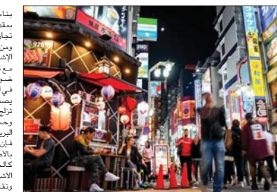
البعض عن هذا الاختراع التهاكا للخصومية