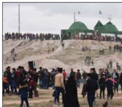
مقام خضر الياس

يذكر ان التلعفوين يمارسون طقوساً عديدة في أيام خضر الياس الثلاثة المحييين والآخر تمارس حتى ربيع العام 2014 وهي حلوة خضر الياس التي لا يكاد التلعفوي يستغني عنها فهو إما ان يشتريها من الأسواق أو يقوم بصنعها محلياً في البيت أو جوارسي، والحلوى الطحينية، وكانت غامضة الأسر تقوم بإعداد، قسم من هذه الحلوى في بنتها التزيينات في صبيحة خضر الياس، وحسب الروايات فإن اللقاع كان يعرف في زمن ليس بعيد ب «مقام الخضر» ثم أضفت اليه كلمة «الياس» في عصور متأخرة، وطلعن كلمة الياس بمعنى القطب، لذلك ان فصل الشتاء، قد يتيسر من الرجوع، فاسحا المجال للواند الذي فصل الربيع.