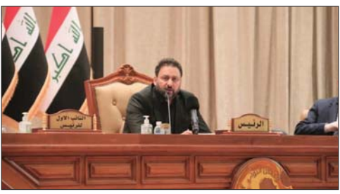
● بغداد، الصباح

هيئة الاحتجاج، ودائرة شؤون الأحزاب والتنظيمات سياسية بمفوضية الانتخابات، وذلك في يوم الاثنين الفيلق 22 شباط 2021 بحضور الحائز التبائيّ «المستأجر» المسألة والمصالحة واللجنة القانونية ولجنة حقوق الانسان. وأكد الكعبي أن الاجتماع يأتي ضرورة بحث المراسم ذات الصلة وأهمها تفعيل هيئة احتجاج البعث القصور والأجراءات القانونية والدستورية الخاصة بذلك فضلاً عن تنشيط فترات قانون حظر حزب البعث والكيانات والأحزاب والأنشطة المنصرفة والإرهابية والكفورية، وبضمنها منع شخصوس البعث للتحلل من ممارسة أي نشاط سياسي وقطاعي وفكري واجتماعي وتحت أي مسمى وبأي وسيلة ومن وسائل الاعلام. ودعا النائب الأول لرئيس المجلس جميع وسائل الاعلام الوطنية والوفية للثناء الطاهرة التي ازدهت على أيدي النظام الجرم، الى تكثيف جهودها وبرامجها لإبراز الصور والفيديوهات القيحية لتلك الحقبة السوداء، المليئة بالتوحش التي فاقت كل جرائم النازية والفاشية، والتذكير بتاريخ الاعمال الوحشية لحزب البعث ليثامها كل العراق والعربي والدولي، لا سيما فئة الشباب الذين لم يعاصروا تلك الفترة المظلمة التي اتسمت بالتوحش ومصادرة الحريات، مؤكداً ان هناك فقرة صريحة ضمن بنود قانون حظر البعث تمنع استخدام الإعلام في نشر أفكار وأراء، وأنشطة الحزب الجرم.