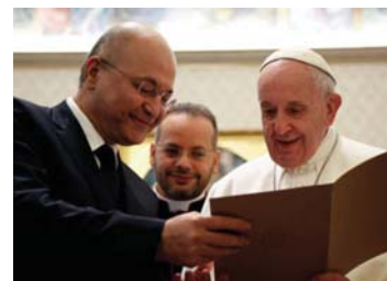
● بابا الفاتيكان مع رئيس الجمهورية برهم صالح.. (أ. شيف)

وصلت تحضيرات مفصلة أشار ذي قار استعداداً لزيارة بابا الفاتيكان إلى الحافظة إلى نحو 70 بالمئة. وقال مدير المفوضية طاهر كوين بالمشورته هيئة المكان الخاص لتزويد بابا الفاتيكان وقاعة القاس بجوار بيت ابراهيم "، خلال زيارته المدينة الشهور لتقبل مشوراً إلى أن هيئة المكان كانت بإبصال التيار الكهربائي ونصب السرادق والنمص. وأضاف أن الأعمال شملت ترحيب الأجرح الاتصالات والإنترنت وتبليط الشارع الذي يربط مدينة الناصرية بالمدينة الأثرية، وإبصال جميع الاحتجاجات إليها وبضمنها (أنا).