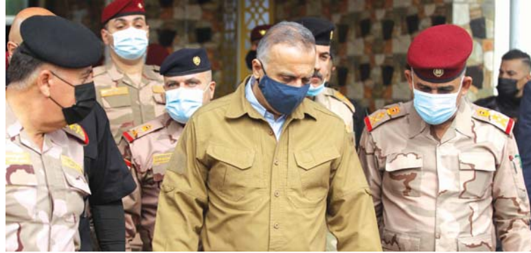
● بغداد، محمد الأنصاري

ضمن حملة الحكومة وتوجيهات القائد العام للقوات المسلحة بالقتضاء على عصابات «داعش» الإرهابية والتي أدت إلى مقتل قيادات الإرهاب، أجرى رئيس الوزراء مصطفى الكاظمي، أمس السبت، زيارة إلى قضاء الطارمية للاطلاع والإشراف على العمليات الاستباقية التي انطلقت للقتضاء على ما تبقى من تلك العصابات. وأفاد بيان مكتبه الإعلامي بأن الكاظمي زار مقر اللواء 59 عمليات المشاهدة، الفرقة السادسة، في قضاء الطارمية، يرافقه معاون رئيس أركان الجيش وقائد عمليات بغداد.