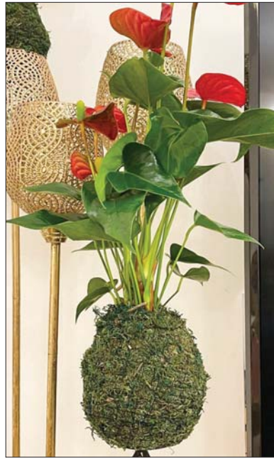
زهرة الكودمو النادرة

هذا التفاؤل الحقيقي بين المواطنين وحكومته التنفيذية على وجه التحديد هو الذي يرقى بالبلاد والعباد على حد سواء، فلماذا يجعل هذه التطورات تنويع تاماً أمام تنفيذ مطالب اصحابها، بوصفها حقاً من حقوقهم التي كفلتها الاعراف والقوانين كافة، إن التفاؤل عن حقوق الناس وتقديم الوعود لهم، لم يعدا مجددين، ولا يدعوا مراعاة الأتساق بوصفه الأمانة الحقة للبلد، والأرزهار والاسان، فهل من مستجيب؟