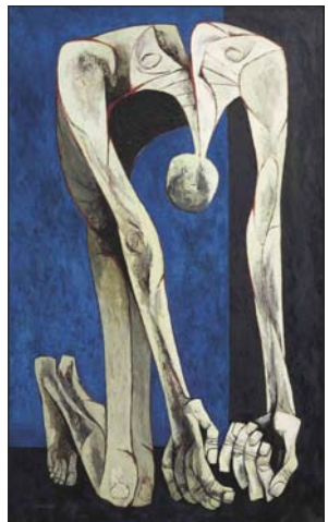
لوحة من أعمال الرسام أوستالو غوبالديان

يبدو لنا اليوم أن الكثير من الكائنات لم تعد برية في خطاباتها بل هي كُتَل مُنظمة تتشكّل من قيمها ومبادئها، كائنات لم تكن لولا ما نتجني من قيم ومبادئ، سواء ان تكسب هذه القيم عبر مراحل تطورها، أو ان تلقاها من خلال الثقافة الملائقة مع أفكار أخرى والعيب هنا ليس ان يكون لكل واحد منا كتلة قيمة معينة كون هذه القيم وهذه المبادئ هي التي تشكلت وتقدمنا وهي مصدر اختلافنا عن الآخرين، لكن المشكلة فيها تجزئتها واللعب على حبال المبادئ، كوسيلة اتقاء أو اكتساب شرعية أو هيمنة على كائنات أخرى، ويظهر أن الخطاب يُحكّم بجهاز قيمي، بمنظومة من القيم والمبادئ التي تراعى في الخطاب من حقول معرفية أو عقائدية أو سلوكية، معقدنا الأساس ذات، الذات التي تنطلق من اعماقها تلك الترسبات والجزور التي تراكمت فيها طوال مسيرتها، يقول المتخصص في اللسانيات نورمان كيرفالك: "تنظر إلى الذات على أنها تاريخ متغير من العلاقات وسائل باستمرار وقد اجاد عالم النفس (جورج برونر) هدف الفكرة عندما اعتبر الذات على أنها موزعة وليست متمركزة على فكرة المستور". إن الذات صيغة متحركة والاشخاخ تتأرجح بين تاريخها القيمي عبر مراحلها، والمهم هنا كيف تتخلص هذه الذات من ميولاتها