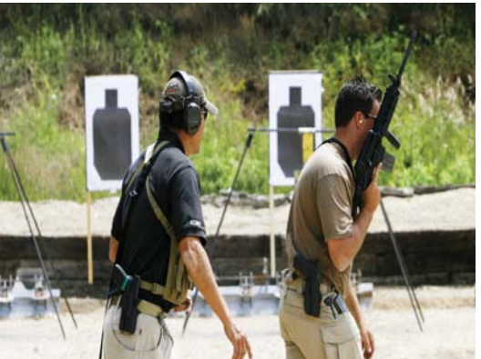
● الامير حمزة بن الحسين

● إعداد: الصباح الدراسة مكونة من 143 صفحة، وجرى تنفيذها بناءً على طلب من مجلس الأمن القومي الأميركي، والسؤال المركزي فيها هو: ما هو تأثير المتقادين الأمنيين الذين يتعاقد معهم الجيش الأميركي في مناطق الانتشار، وهو ما عرف بعد الجرح الأميركي للعراق بـ "خصخصة الحروب والعمليات العسكرية"، من أجل نقادي الانتقادات التي تواجهها الحكومة الأميركية في ما يتعلق بالخصائر البشرية المتوقعة. تشكر الدراسة في أول فصولها، أن الفوارق في المرتبات والمكافآت التي تتلقاها العناصر العاملة في القطاع الأمني الخاص الملحق بالعمليات العسكرية الأميركية، وارتفاعها نسبياً عما يتلقاه الفرد داخل الوحدات العسكرية الأميركية، هذا الأمر يشكل مركز تأثير وإشارة وعقدة