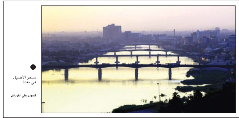
● سحر الاصيل في بغداد