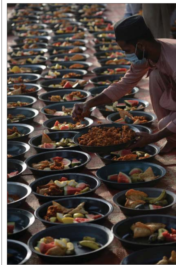
● متوعد بعد الإفطار للصائمين خلال شهر رمضان المبارك على طول أحد شوارع كراتشي في باكستان... (أ ب)

حد الأمين العام للأمم المتحدة أنطونيو غوتيريش في تقريره سلمه إلى مجلس الأمن الدولي الرضا، اللبنانيين على تشكيل حكومة "من دون مزيد من التأخير" مشدداً في الوثيقة التي حصلت "الصباح" على نسخة منها على أنه "حان الوقت لتجمل الزعماء اللبنانيين مسؤولياتهم ويشكلوا حكومة قادرة على القيام بالإصلاحات اللازمة لتلبية احتياجات الشعب اللبناني وتطلعاته على وجه السرعة". وأضاف أن "الإحباط من الشلل السياسي والأزمة الاقتصادية يتجلى بالفعل في التظاهرات ويمكن أن يؤدي إلى مزيد من العنف ويهدد استقرار البلاد". وعرج غوتيريش على ملف التفجير الكارثي لمرقا بيروت، مؤكداً أنه "من الأهمية بمكان إجراء تحقيق محايد وشامل وشفاف في انفجار مرقا بيروت، وفقاً لطلب الشعب اللبناني بالحاسبة". كما طالب المسؤول الأممي من جانب آخر إسرائيل بسحب قواتها المنتشرة شمال الخط الأزرق الفاصل مع لبنان، و"الوقف الفوري لعمليات التحليل في الأجزاء اللبنانية". في غضون ذلك، تلقت البلاد صغعة من العيار القليل لعقبتها المزيد من ترازها أو ما تبقى منه تمثلت بالقرار السعودي الذي أعلنه الرضا يمنع دخول الفواكه والخضراوات اللبنانية أو نقلها عبر أراضيها اعتباراً من اليوم الأحد، جراء تهريب المخدرات عبر شحنات المنتجات الزراعية، وهذا