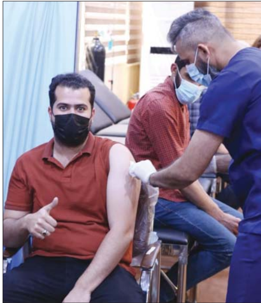
• تصوير ... خضير العتايبي

وشدد السليطلي على أهمية الربط الكهربائي مع الخليج وتركيا ليكون العراق محورا للاتصال بين دول الخليج المشروعين وسيمران بخطوات بطيئة. وكان من المفترض على الحكومة الأسراع بربط هاتين المنظمتين لما لذلك من فائدة للعراق. وأضاف أن الاتفاق في أوقات الذروة بين العراق والمناطق الشمالية المتخمة بتركيا وأوروبا، يمكننا من أن نصبح ممرا لتصدير الطاقة من المناطق الحارة صيفا باتجاه تركيا ذات الجو المعتدل وتحويلها إلى بلدان أخرى، مبينا أن العراق يستهلك من المحطات