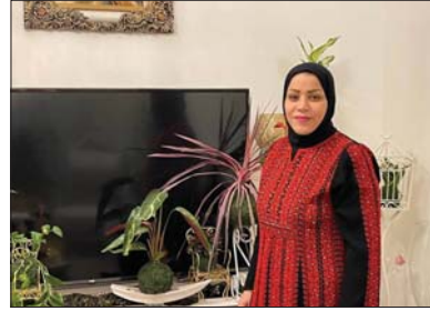
العبادي مع مزرعتها