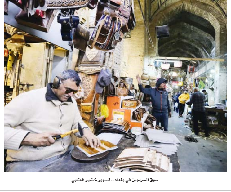
سوق السراجين في بغداد...