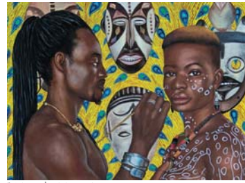
● الفن الحديث في الأعمال الفنية

شرق أمين معرض (افريقيا القديمة) في فرنسا فيليب داجن مؤرخا الجزء الثاني من دراسته الواسعة عن البدايات والذي يسلط الضوء على الروابط بين الفن القديم والمعاصر في افريقيا. ظهرت فكرة البدايات في القرن التاسع عشر لكن مؤرخ الفن داجن يشير في الجزء الثاني من كتابه الى ان البدايات هي حرب حديثة من خلال تحليله لتأثير الفنون القديمة على الحركات الفنية في النصف الاول من القرن العشرين إذ يعتقد العلاقات بين الفنون الافريقية القديمة والمشهد الفني المعاصر.