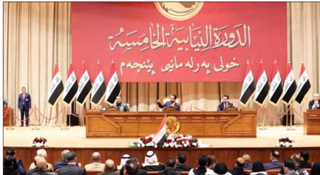
جلسة انتخاب رئيس البرلمان واثنين.