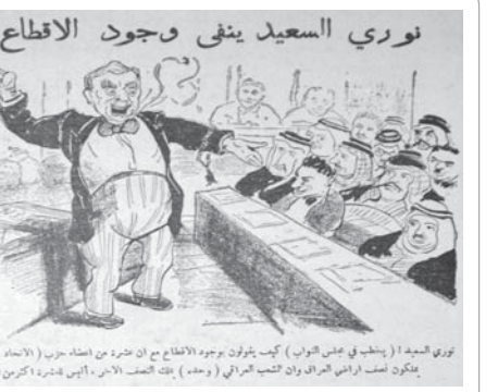
نوري السعيد (يسلم في مجلس النواب) كيف يتفون بوجود الاقطاع مع ان حذر من اصنام جور (الاتحاد المستوري) يتكون أصف ارضي العراق والحب العراقي ( وهدم) بكث التصف الأبن، الذي فندرة أكثرين الواحد 11

بعض الفئتين عن كرامتي المحكم والبيدين عن المقاعد الياية ويؤمل أن يفتح هذا الحس اشتاداً يخرجهم عن حدود التعقل والأفراط بإيقية الباقية من كرامة النفس - إن وجدت - ولا يستمع إن تورم ثامرهم فيظفرون في الشوارع شاقين الثياب غارين الشعور مصخبين الوجوه عن شكل مظاهرة منظمة يتدون فيها فخر الوطن المحروم في الوقت الحاضر من «نار» جنابهم التي كانوا يبتفونها وهم في مقاعد المحكم وكراسي الياية