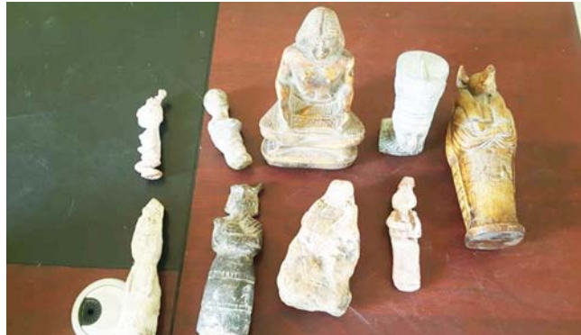
● لبنان ينوي تسليم العراق 336 قطعة أثرية مهربة