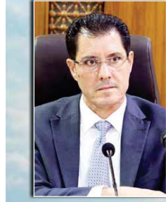
نوري الدليمي، وزير التخطيط