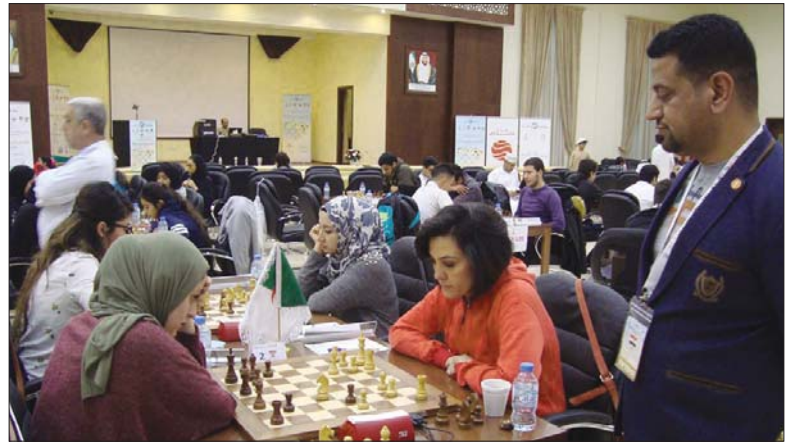
لقاء سابق بالشطرنج - ارشيف