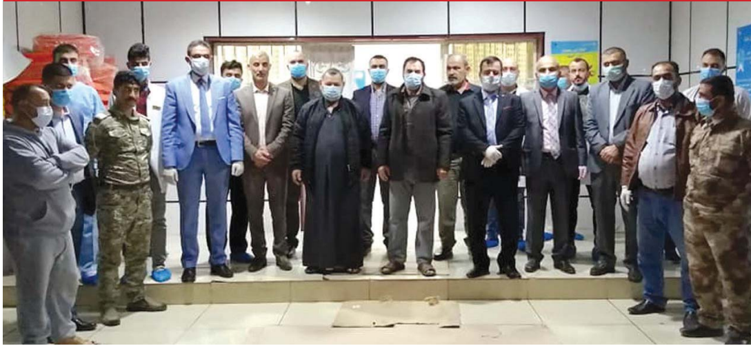
● عدد من الذين اكتسبوا الشفاء ... أرشيف