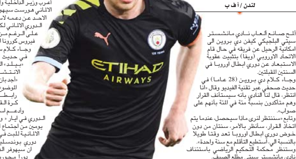
دي برون / اتن / اف ب

أصبح صانع ألعاب نادي مانشستر سيتي كيلين دي برون إلى إمكانية الرحيل عن فريقه في حال قام الاتحاد الأوروبي (ويفا) بتثبيت عقوبة الاستبعاد عن دوري أبطال أوروبا في السنتين المقبلتين.