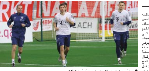
جانب من تدريبات بايرن ميونيخ

وكان ناديا ساسوللو وبولونيا أول من يعلن عن فتح أبواب مراكز التدريب للاعبين قبل أن يلحق بهما بايرنا. وأوضح ساسوللو أن اللعاب الففحة فقط ستكون متاحة للاعبين الراغبين. ويمكن أن يخوض ستة لاعبين فقط مع احترام مسافة التباعد الاجتماعي ومن دون تواجد للجان الفني.