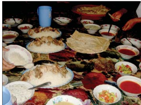
• مأدعة رمضان

تتعدد المأكولات الشعبية العراقية من منطقة إلى أخرى نتيجة العادات والموروث الشعبي الخاص الذي يميزها عن غيرها، الأمر الذي أبرز ساحة المطبخ العراقي وساعده في تعدد الأطباق الشهية.