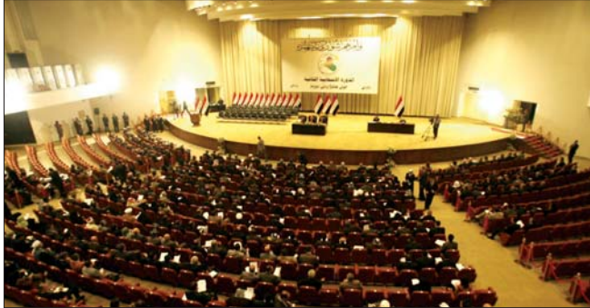
● جلسة برلمانية سابقة لجلسة الفتح