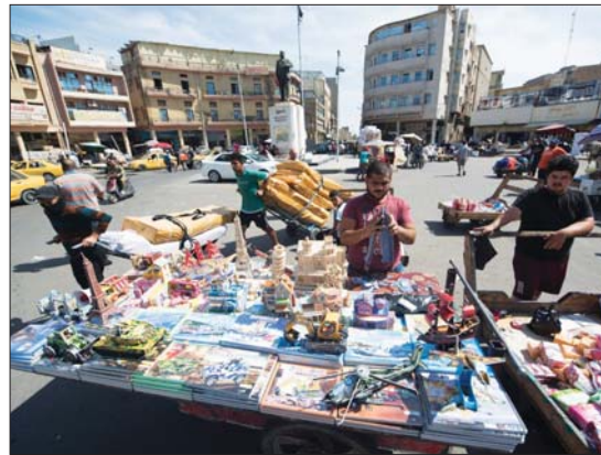
• باعة جوازون في ساحة الرصافي

أكد وزيرُ التخطيط نوري الليمي، استملاك وزارته رؤية وخطة شاملة ومتكاملة للخروج من الازمة الاقتصادية الراهنة عن تعظيم الموارد غيرالنفطية والاعتماد على الشراكة الحقيقية مع