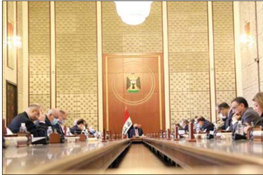
● بغداد: الصباح