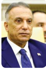
● بغداد: الصباح