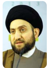
● بغداد: الصباح