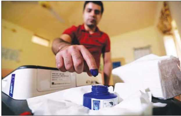
• انتخابات سابقة