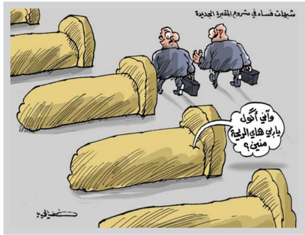
كاريكاتير: خضير الحميري

بعد العنف ضد المرأة أزد مخزجات العادات والتقاليد والقيم المجتمعية، وهو امانة كرامة الانسان وهدر لحقة ان يكون مولدنا حرا بعيدا عن العنف المادي والعموي، وعقبة كبرى في طريق تحقيق المساواة والعدالة، وعلى الرغم من كثرة الشعارات والنشاطات، التي تدعو لإيقاف تلك الممارسة، يبقى العنف مألوساً للمرأة، ولكنها ولدت معه، بل رافقها منذ ولادتها، ولا يخفى ان الكثيرين من مجتمع وآخر، سواء التقدم أو المتخلف، إذ تعاني من قسوة وتعنيف الجسد احرها، سواء علف جسدي أو لفظي أو جنسي أو تقييد لحريةها وحرمانها، لاسيما في المجتمعات ذات الاعراف والعادات الخاطئة التي تميز بين الجنسين. ويحتفي العالم في كل عام باليوم العالمي لمناهضة العنف ضد المرأة في الخامس والعشرين من تشرين الثاني، وهو التاريخ الذي تم اختياره، تزامنا مع اغتيال الناشطات السياسيات الاخوات الثلاث ميرال في جمهورية الدومينيكان، واختيار اللون البرتقالي كشعار، املا في مجتمع خال من انواع العنف، كما انه يعبر عن لون الحركات الاجتماعية والسياسية في معظم الدول ونال قبولاً واسعاً. ويطالغ أغلب المنصفين من العقاب بدواعي غسل العار وقضايا الشرف، ليعودوا لممارسة