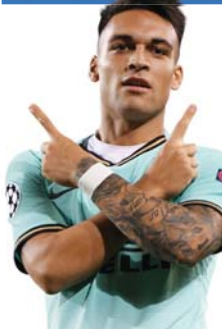
لاوتارو مارتينيز: نحن نلعب بشكل جيد لكننا نرتكب الأخطاء على الدوام..

يسجل بايرن أربعة أهداف في الدقائق العشر الأولى تلك أن المباراة رائحة بالتأكد بالنسبة للبايرن لكننا لم تكن كذلك بالنسبة للمدرب الذي عاش ليلة صعبة حتى جاء الفرج في الدقائق الأخيرة مساهمة من هاندلر والسبيكة الموس للناصري الروماني روبرت ليفاندوفسكي الذي أنتج رصيده التهديفي في تسعة هذا الموسم بثلاثية.