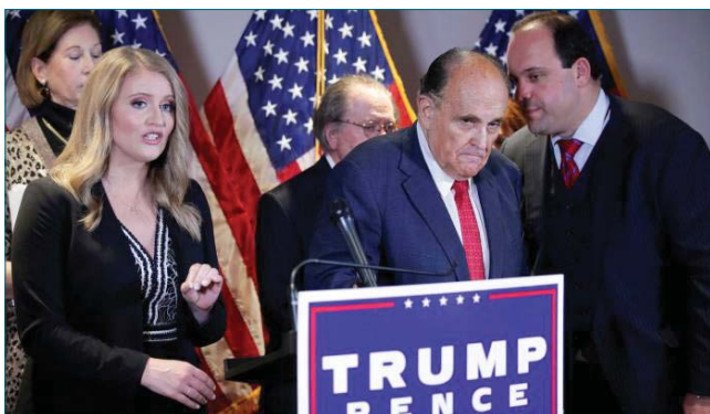
• رودي جوليانين محامي ترامب