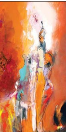
• لوحة لفنانين بلاسم محمد

مكتاً من دون منغصات. إن للمسرح بل يشهد للترف أو تزجية الوقت، بل لتلقيق الناس وإمتاعهم وتبصيرهم بقضاياهم الصورية بفعل رجالات المسرح الساهرين على سعادة الناس وبهاء الوطن عبر الثقافة والفن.