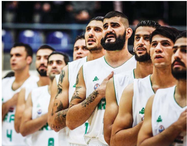
فلق من بروتوكول البحرين الكائن بشهر صايف كوفيد-19

تذكر هذه الرياضة وإمالتها مع اقتراح موعده كل مولد انتخابي مع التذكير مرة أخرى أن يكون دعم أهل السياسة للرياضة مع الأهداف النبيلة والنوايا السخنة من خلال القنوات الرسمية للرياضة. مع تجريد التأكيد على مبدأ عدم تسييس الرياضة أن تغرد رياضتنا خارج السرب الحكومي بل يجب أن تنسجم اتجاهاتها ومنطلقاتها في كل الفصول والمواسم مع الخط الوطني للدولة ومع النهج الحكومي الذي يبتغي صالح الوطن ومصلحة الرياضة. كما نحن مع مبدأ اقتحام أهل الرياضة للميدان السياسي طالما إن الهدف أو الغاية الأسمى هو تزيين السياسة وليس العكس لأننا بحاجة ماسة لأن يكون رياضتنا صورت قوي وعضو مؤثر في الساحة السياسية وبين أهل القرار السياسي والسلطة الحكومية لأجل تعويض ما فات من عمر رياضتنا وتجسد بأصابع صريح من أهل السياسة أنفسهم للذين لم نحن من معظمهم سوى العوعد والتمنيات فقط !!