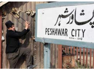
مرتدياً مثل تشايرلي تشابلن، يقفز خان إلى عزمات ريكتشا

يقول خان إن فكرة تقليد شخصية تشابلان الأيقونية من فيلم ذي ترانس خطرت على باله فيما كان يتشاهد مقطع فيديو لهذا الممثل الأسطوري أثناء تعافيه من مرض. ويوضح خان رأيت أن علي البيد، بتقليد تصرفات تشايرلي لكي أنشر السعادة بين الناس وأبعد تسكيرهم عن جائحة (كوفيد 19).