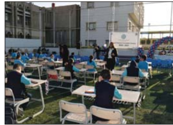
● جانب من المسابقة