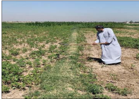
● مشروع في ميسان

مواثي، وكذلك انشاء احواض اسماك على طريق الكحلا، ومشاريع خاصة بالخضراوات الزراعية.