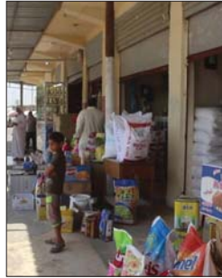
● إحدى الاسواق التجارية

واكد بيان للغرفة اطلعت عليه "الصباح" ان تحقيق التكامل في الاء بين فريق الغرفة والاجهزة الأمنية امر في غاية الأهمية لاسيما ان الفترة المقبلة ستشهد خطرا للتحوّل في فقرات معينة، تتطلب الحفاظ على توازن عرض الاسواق المحلية. واجمع الحضور بحسب البيان على أهمية التعامل بين الطرفين من اجل مهمة وطنية غاية في التبل بهذا الوقت العصيب.