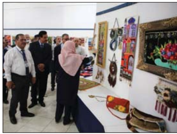
جانب من المعرض الفني