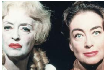
● هل كانت الخصومة بين بيتي ديفز وجوان كروفورد (يمين) أمرا مديراً

لكنها عادت للبيت بخير بحلول عيد الشكر في تشرين الثاني، عادت ديفز للتمثيل بالفعل، وقامت بتدوير البطولة في فيلم «جيتان أغسطس» سنة 1987. لكنها لم تتصلح أبداً مع ابنتها الوحيدة وتركت ميراثها لبيتها ميشيل، أما كاثرين فقد عملت معها مساعداً بعدد من الأفلام الشهيرة، لكنها ما زالت تتوهم النجمة بغير بكل ما تعلمه، قائلة: لقد درّست في الجامعة أربع سنوات، لكنني تعلمت أكثر بكثير من بيتي ديفز.