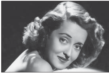
● طالبت ديفز مساعديها بالكثير لكنها كانت ايضا كريمة مهم