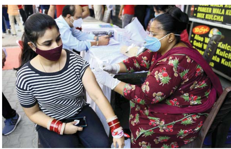
• تستعد العاصمة الهندية، نيودلهي، للتعامل مع ذروة في إصابات كورونا قد تصل إلى 37 ألف حالة يوميا، بالتوازي مع تخفيف جزئي لإجراءات العزل العام.

الضفة الغربية في منطقتي بيتا وبيت دجن بالقرب من مدينة نابلس، وبلغت إلى أن 16 شخصا أصيبوا برصاصات الحي بينما أصيب 20 بالرصاص المعدني المغلف بالمطاط، وسجلت هذه الإصابات خلال تفريق فعالية «سارثون القدس» بالقوة وفعاليات أخرى مناهضة للاستيطان جنوب نابلس وشرق قلقيلية وغرب رام الله أقيمت تزامنا مع ذكرى تكسة حزيران. في غضون ذلك، أقلق محتجون مؤيدون للفلسطينيين جزا من ميناء، أوكلاند في ولاية كاليفورنيا الأميركية، مما منع سفينة شحن إسرائيلية تديرها شركة ZIM من تفريق حمولتها. وتكرت منظمة العفو الدولية لارا كسواتي، المدير التنفيذي للمركز العربي للتنظيم والوارد، أنه «يُحتمد علينا جميعا كضعف ضراب أن نطالب بالزيد وأن نوقف المسامحات الأميركية لإسرائيل طالما استمر العنف».