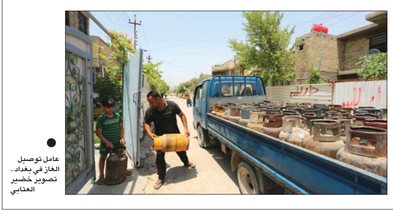
عامل توصيل الغاز في بغداد.. تصوير خضير العتايبي