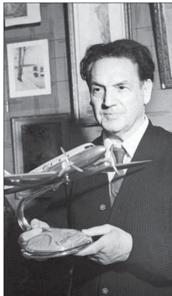
● وروبرت بارتيني يتلقى جائزة عن أحد أعماله

بدرهم، حلول السوفييت، الذي كانوا مفتنحين أيضا باعتناقه لضقيتهم، لاصلاحهم لغاية سنة 1922. وبعد استيلاء الفاشيين على السلطة في إيطاليا، انتقل روبرت إلى شبه جزيرة القرم، وبدأ بتصميم الطائرات الروسية، وأجرى تجارب على السوائل والمواد بوسائل تناسخ كونه عالما أكثر منه مهندسا، وكان دوره الأساس هو متابعة الأفكار الجريئة والمبتكرة، وفقا لسيرجي تيراك، استاذ علوم النقل لدى جامعة ماريبور في سلوفينيا.