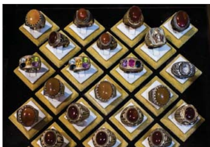
● الممر يتحول إلى قطع فنية

موضحاً أن «هذه الهدايا لا تقدر بثمن، لأنها تعود إلى أكثر من 70 عاماً، فضلاً عن مكانتها وموقعها وهديتها والتبرك بها، منها بأن بعض الأحجار تتحول أيضاً إلى دروع وخواتم وميداليات منقوشة بآيات قرآنية وأحاديث نبوية شريفة».