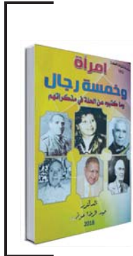
امرأة وخمسة رجال

كتاب يقع في ستة فصول تضم (218) صفحة من القطع الكبير للكاتب الدكتور عبد الرضا عوض، صاحب مؤسسة دار التراث والإعلام في الحلة وقد تم طبع الكتاب عبرها. تحدث الكاتب عن مدينة الحلة التي تقع بين بغداد والكوفة امتدادا وتوسيعا (لجامعين) والتي زارها عدد كبير من الرحالة العرب والواجب وقد اطمويا في وصفها، وقد أطلق عليها اسم الفيحاء، فسُميت الحلة الفيحاء لطيب هوائها وصفاء سمانها وحلو مائها، وتأسست في هذه التسمية من البصرة والوصل وغير ذلك من تاريخها وتراثها. وقد ارتأت المؤلف ضمن سلسلة تراث الحلة أن يخرج بخلاصة ما دونته أقلام أناس شابت الأبور أن يعملوا في هذه المدينة في مواقع مهمة