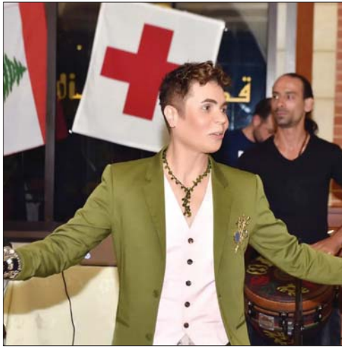
جورعد في إحدى حفلاته

ورفضت، وفي ما يتعلق بالتجميل والموضة تحبها، التجميل عالمي الخاص، إذ لا يمكنني أن أتخلى عن هذا العالم الذي شهد بداياتي مع الشهرة إطلاقاً، وأرغب بطرح عملي وأن يصل للجمهور بشكل طبيعي من دون تزيف، وصدقا أقول لقد عرض علي شرا، مشاهدات كلها حقيقية، فهناك نسب استماع مزيفة تتشعب عن طريق الإعلان، وإنما لا أفضل ذلك إطلاقاً، وأرغب بطرح عملي وأن يصل للجمهور بشكل طبيعي من دون تزيف، وصدقا أقول لقد عرض علي شرا، مشاهدات مضيفاً "صححني الغناء أخذ الكثير من وقتي لكنني أحاول التنسيق بين الاثنين، ولأن نرى أن أغلب المطربين يقفون لهم تجارة أخرى، سواء في المطور أو الجواهرات أو حتى إعلانات السوشيال ميديا".