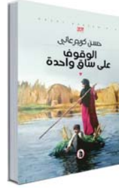
يا ندعتي طيحي عبيرة سوي على الخدين تكرة كبابي اكسمر محد يجيره

وغرنوكة هنا - بالكاف العجمية - هي أساس الصراع الدرامي الذي سيتم في ثانيا الأحداث بين شيخ السلف المطلق اليد في البذل والجدل وبين اصغر إنسان في السلف (العشيرة أو الجماعة) كما سترى. غرنوكة سيوة سواد، اللون جميلة القسمات وهي زهجة خشبي (أحد أفراد حوشية) الشيخ ومن الذين يقسمون بالمساواة والأدب على أتباع الشيخ (أقل خطاً) لكن الشيخ يتعامل معه أيضاً بسدات الأسلوب عند الخطأ أو لسبب آخر لا يعلمه خشبي وتعلمه الغرنوكة التي كانت تتمتع أحياناً عن مجازاة أطباع السيد المطلق بها، فيشدد الكبير على زوجها ويطرده من خدمته بعد معاقبته بالمساواة لترضى غرنوكة بإسباع نزوات الشيخ المرعبة، وهي تنشده: