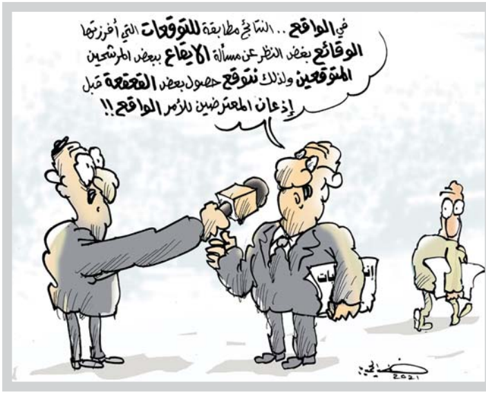
كاريكاتير: خضير الحيمري

يوجد المواطن نفسه أمام مواجهة مع الموت بعد القرار الذي اتخذ من قبل المصرف المركزي برفع الدعم عن القوفا، وذلك بعد رفع الدعم عن المحروقات، اختلاف حلقه جديدة إلى هائلها على بئر الجملة. كما وزارة تتنصل على من مسؤولياتها، وتحاول تزيير ما حصل بإلقاء التهمة على من سبقها في الموت إلى ماجس يقض مضجعه. وبدلاً من أن يكون الأطفال والشباب مشاريع تغيير المستقبل، تراهم يتحولون رهائن خاسرة بسبب تفشي الفساد، والشرة، وقطان الثقة بالمؤسسات واتسداد الأقف. يحلّ الأمن الصحي سلم الأولويات في الأنظمة التي تستقطب الأسمعة، وتدعم البحوث لتطوير الأدوية، وتوفير العلاج النوعي والفعال، وتعمل بشكل دائم لتأمين مستلزمات القطاع الطبي كافة خلال جائحة كورونا أو غيرها. في المقابل، سلامة الفرد مهتمة في مجتمعنا، ويحلّ مكانها، عند الرعيمة التناقص على القاعد والحصص، ويقي الاموالون فتران تجارب أمام صنابير الانتقائيات التيبانية.