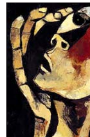
● لوحة الفنان وزولد غوياسامين

● حميد حسن جعفر أولاً عندما تتوقعن ميوطي فكم أذا النهار على مزارعك، (لولا) عندما تنكح عند النقا، الطراقة، عند آخر خبطة لتلقيني بشيء، وضعي ساقاً على ساق، ممتلئة بشيء من الكروياء، لا أحد تخطي وهاك، ولم يحذف بارئك تطلع من أبطيك، ويطيور تلتقط حياً عند اسفل بطانك، حين أمر ببارة ما وبمواصفك، فكأنك أن أعلن خناسري