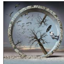
من أعمال الفنان ايجور مورسكي

مهما وضوحة واسعة من خارطة الشعر بدأ بالرواى إلى الجيل الخمسيني والجيل الستيني الذي ترك بصمة ماثرة، وكانت استغلاته الباهرة تدل على رسوخ وعمق الرؤية والتجربة لدى هذا الجيل، وهكذا تعاقبت الأجيال الشعرية التي كتبت قصيدة التفعيلة، وراحت القصيدة تأخذ سميات اوسع - من شعراء ومثقفين، وكان أبرز في كل حقبة أو جيل أسماء، مهمة تكون بمثابة الأعلام الذي يعطي الجمهور التصور والرغبة وقد ساهمت الميزة العاملة، والانفصافات الجماهيرية التي دعت إلى التغيير وتبديل أنظمة الحكم، وإزاحة عهده الطلبة وبرزوز دور الصحافة في العراق حيث لعبت دوراً مهماً في نشيط وتوعية الحس الجماهيري وكثيرة هي الأسباب فكل رزاق ومقهي في ذلك العصر كان ينادي بالتغيير والثورة على السائد.