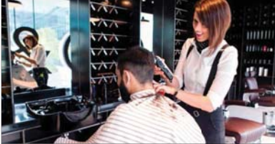
فكرة تشترك الرجل في حله وترحاله

والع إلى أن "بعض النساء اشتكرن بدورتنا، رغبةً منهن في حلالة إبتاهن وقاربهم، وليس شرطاً اشتغالهن في صالوناتهن. مختصتا بالقول: "أصبري على إدخال عمل النساء، في صالونات الحلاقة الرجالية التي المجتمع العراقي، تحد لكل الظروف والانتقادات التي قوبلت بها في بادئ الأمر، لكن في النهاية نجحت الفكرة ولأنت اهتماماً واسعاً من قبل بعض الناس وأمل أن تعمم هذه التجربة في مدن العراق كافة.