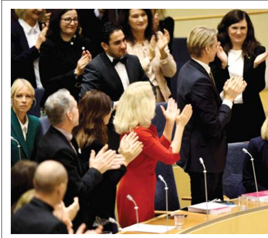
• قدمت رئيسة وزراء السويد المنتخبة ماغدا ليندا اندرسون استقالتها، أمس الأربعاء، بعد ساعات على تعيينها من قبل البرلمان بعد فشلها في تمرير مشروع اليئزانية وانسحاب حزب الخضمر من الائتلاف الحكومي.

عقد الحزب الشيوعي الصيني الدورة الكاملة السادسة للجنة المركزية التاسعة عشرة له في الـ 8 و 11 تشرين الثاني بصورة ناجحة، وهو اجتماع في غاية الأهمية وعند النقطة التاريخية للذكورى المؤبىة لتأسيس الحزب ونقطة التقاطع التاريخي لأهداف الكفاح بحلول الذكرى المئويتين، وتمت خلال الدورة الكاملة اجازة قرار اللجنة المركزية للحزب الشيوعي الصيني بشأن المنجزات المهمة والتجارب التاريخية في كفاح الحزب الممتد لثة عام، وقرار عن عقد المؤتمر الوطني العشرين للحزب الشيوعي الصيني.