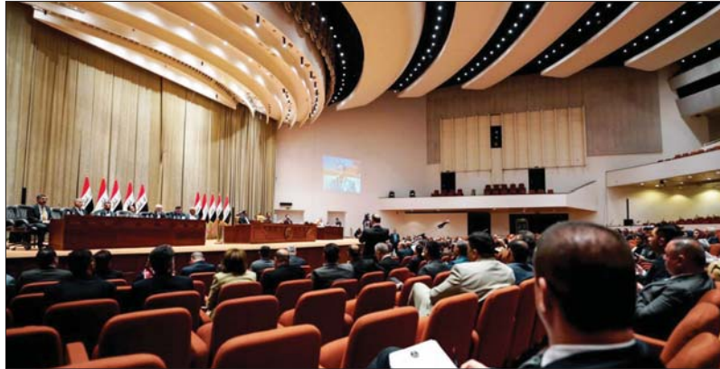
اكتمال التصاد وتمريض مرشح رئاسة الجمهورية مروانان بالتوافق الساعات الأخيرة

المحايد والمؤخ والباحث ليست الثورة سوى حدث، واقعة تقطع لتسلسل الوقائع بهيجان جماهيري غاضب، لكنها عند أصحابها والمؤسسين بها فكرة طهرانية صافية نظيفة يمكن لأدنى هبة من غيران تخدش ضيقها. والطهرانية عمل لا ينتهي، ليس لها أمد تقف عنده، إنها دائماً تبحث عن الأطير فالأطير وتزدري الأفل، وكل تطبيق للفكرة هو أقل بكثير من التكررة ذاتها، هي الأليمان عند المؤمن يرى كل الموحدين أخوته لكتمهم أدنى رتبة من المسلمين الذين هم أخوتهم لكتمهم أدنى رتبة من أبناء طائفته الذين هم أخوته أيضاً لكتمهم أدنى طهرانية من مقلي مرجه الذين هم أخوته