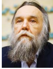
المفكر الروسي الكسندر دوغين

الأوراسية هي فلسفة مفتوحة وغير عقائدية، يمكن إثرائها بمحتوى جديد؛ من الدين والاكتشافات الاجتماعية والجغرافيا والاكتشافات الاجتماعية والانتولوجية والجغرافيا السياسية والاقتصاد والثقافة والبحث الاستراتيجي والسياسي