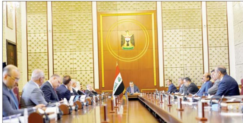
• رئيس الوزراء يبحث على تقديم أفضل الخدمات للمواطنين