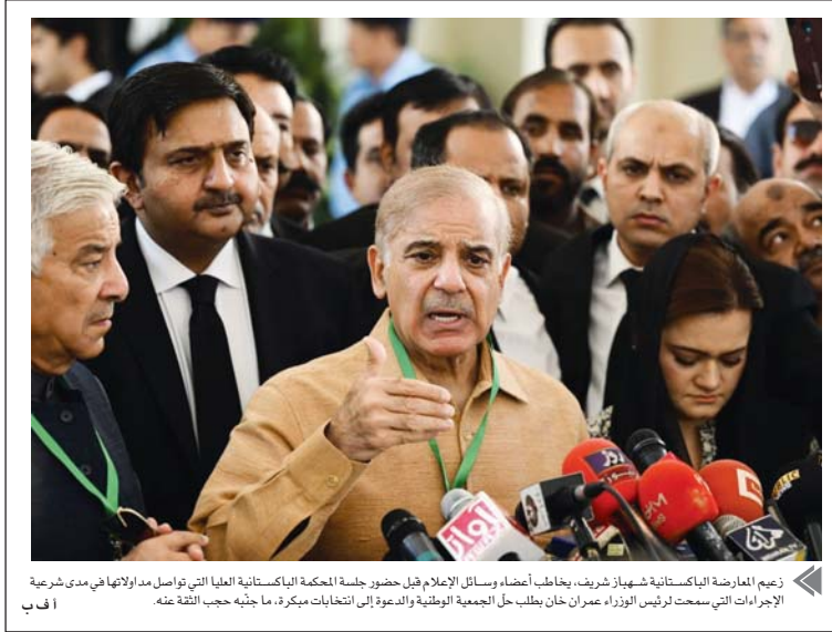
زعيم المعارضة الباكستانية شهباز شريف، يخاطب أعضاء وسائل الإعلام قبل حضور جلسة المحكمة الباكستانية العليا التي اواصل مدالائها في مدى شرعية الإجراءات التي سمحت لرئيس الوزراء عمران خان بطلب حل الجمعية الوطنية والدعوة إلى انتخابات مبكرة، ما جذبته حجب الثقة عنه.

رهب مجلس الأمن الدولي بإعلان المبعوث الخاص للأمم لعام للأمن المتحدة إلى اليمن لمدة شهرين، فيما طلب الرئيس اليمني بتدخل خليجي لاتخاذ البلاد من جماعة مقبلة. وقال أعضاء مجلس الأمن في بيان لهم إن الهدنة فرصة لتخفيف المعاناة الإنسانية لليمنيين وتحسين الاستقرار الإقليمي. ودعوا إلى إقحام الفقرة التي توغرها الهدنة والعمل على الميوت الخاص للأمم المتحدة لإجراء تقدم معروف شامل لإطلاق النار وضوية سياسية شاملة. وحث الأعضاء على بناء الثقة من خلال إجراءات مثل إعادة فتح طريق تعز، على سبيل المثال لا الحصر، والتوقف المنتظم لشحنات الوقود والبضائع والحلات الجوية، وفقاً للهدنة المتفق عليها. وأكدوا دعمهم الكامل للجهود المتعددة بالمشاورات السياسية التي يبذلها المبعوث الخاص للأمم المتحدة. وجدد أعضاء المجلس التأكيد على ضرورة الملحة لعملية شاملة بقيادة