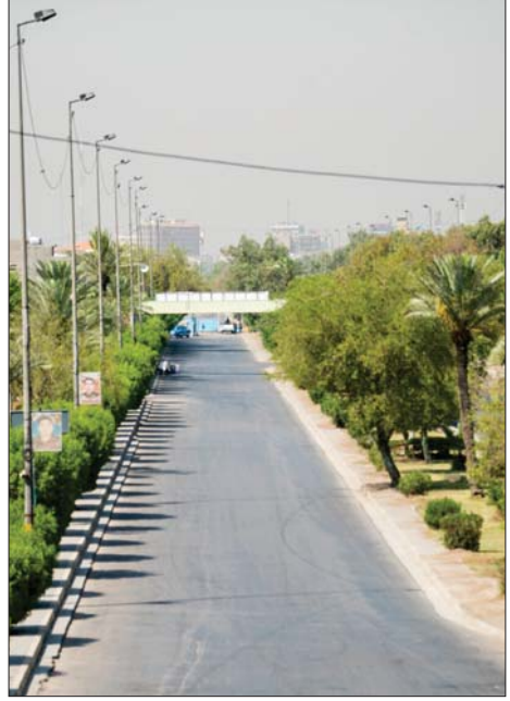
الحظر الشامل