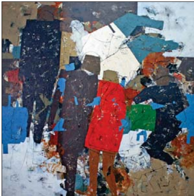
لوحة لفنان زيمن حنوش

الفن عامة المتعة و المعرفة وفي مقال مهم للشاعر الناقد تاس البوت عام (1945) تحت عنوان مهمة الشعر الاجتماعية يقول: "واظن ان اول مهمة الاجتماعية للشعر هي على وجه اليقين اثارة المتعة. وانا سألني سائلا اي نوع من انواع المتعة يثيرها الشعر؟ لا املك سوى ان اقول ذلك النوع من المتعة التي يثيرها الشعر".