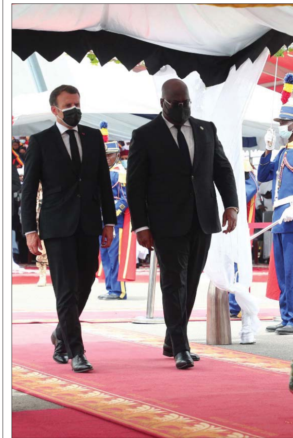
الرئيس الفرنسي إيمانويل ماكرون، ورئيس جمهورية الكونغو الديمقراطية فيليكس تشيسكيدي يقدمان احترامهما لتعش الرئيس التشادي إدريس ديبي خلال الجنازة الرسمية في نجامينا. وكان الرئيس التشادي إدريس ديبي قد قُتل في 20 نيسان الحالي، متأثراً بجروح أصيب بها في معركة مع المتمردين في شمال البلاد.

وقادته العمليات المركزية. وشنت هيئة البعث الإسرائيلية كوخافي، عماد الأحد، وزيرة في الأعداء، إلى الولايات المتحدة في محاولة لإقناع الإدارة الأميركية الحالية ببرنامجها زئببا. وأضادت القناة على موقعها الإلكتروني بأن إسرائيل تخوف من احتمال رفع الولايات المتحدة عقوبات كبيرة عن إيران، والتي لا تتعلق بالانفاس النووي فحسب بل تتوقع اتباعها لخط وسط نسيبي بسبب رغبتها في الضمي قدام بالاتفاق قبل الانتخابات الإيرانية، المقررة في شهر حزيران المقبل. من جانب آخر، أكدت وزارة الدفاع الأميركية البناتاغون أن إيران حققت تقدماً كبيراً في تصميم الصواريخ الباليستية والطائرات المسييرة خلال السنوات الأخيرة.