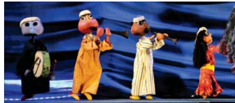
• من اوبريت الليلة الكبيرة

القاهرة، اسراء خليفة ضمن منهاجها الرمضاني السنوي، شرعت دار الأوبرا المصرية ببرنامج الأنشطة الفنية الرمضاني، اهل ماله، للعام الخامس على التوالي، وتقام الفعاليات على خشبة مسرح الهناجر للفنون بدار الأوبرا المصرية وتستمر لغاية الحادي والعشرين من الشهر المبارك. واحيث الفنانة فاطمة محمد علي ورفقتها الموسيقية أولي فعاليات برنامج «هل هلاك»، وشهدت بياقة مؤلة من أشهر ما تغنى به كبار نجوم الطرب في مصر، الاستعراضات الفنية للفرقة الاستعراضات الفنية للفرقة القومية للفنون الشعبية برئاسة الخرج هاني النابلسي إلى جانب مجموعة متنوعة ومتميزة من فقرات السيرك القومي برئاسة الفنان وليد طه.