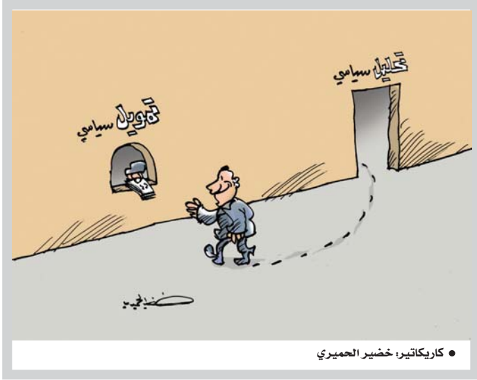
كاريكاتير: خضير الجميري

بعد مرور اكثر من عام على جائحة كورونا تضررت أغلب مفاصل الحياة بشكل بالغ وربما يمكن تهادي بعض تلك الاضرار. لكن مشكلة تعليم الأطفال في الصفوف الابتدائية الاولى واجه مشكلة كبيرة توسع شهورها لتيسع في التأثير على مستوى الاطفال الدراسي والفكري بشكل منفرص وخطاوي ولاسباب كثيرة امها هو عدم قدرة توكيز الطفل لآخر من 15 دقيقة بشكل كامل على منصات التعليم، وهذا ما اثبتته الاسماء والاباء، ممن تحولت منازلهم الى صفوف تعليم عبر الانترنت، إذ لا يحظون الى المعلومات التي يستقبلها الطلاب صيغت بطابع التلقين الالكتروني. وغاب تأثير الفهم للمعلمة والعلم وتأثير الاختلاط والمناسبة بين الاطفال داخل الصف وما يمكن ان يتعلمه الطفل من مفاهيم حية مباشرة يمكن ان تؤثر بشكل كبير في تكوين شخصيته مستقبلا معطل الدول التي تصف في مصف الدول المتقدمة او الصناعية لم تجد لهذا النوع من التعليم الجديد فاعلية ورغم جودته في الناحية التقنية، واعتبرت طريقة التعليم الالكتروني غير فعالة بشكل كبير، إذ تحول الصف الدراسي الى صف افتراضي من دون ضوابط تنظم العملية التعليمية وتحقق فاعليتها، وتأمين من مشاكل التربية المتعلقة بجودة الإنترنت ومشاكل الوراثة البشرية والثقافة الإلكترونية.