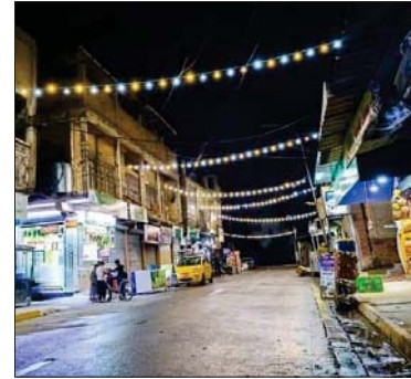
• أحياء الموصل تعانق الضوء

من جديد، استعادت مدينة الموصل القديمة رونقها في الشهر الفضيل، إذ استطاعت أحيائها القديمة أن تنتصر على الدمار الذي لحق بها جراء سيطرة الإرهاب عليها، وشهدت إعادة الطقوس الرمضانية العريقة التي عرفتها بها المدينة من إنارة شوارعها بالأضواء الملونة.