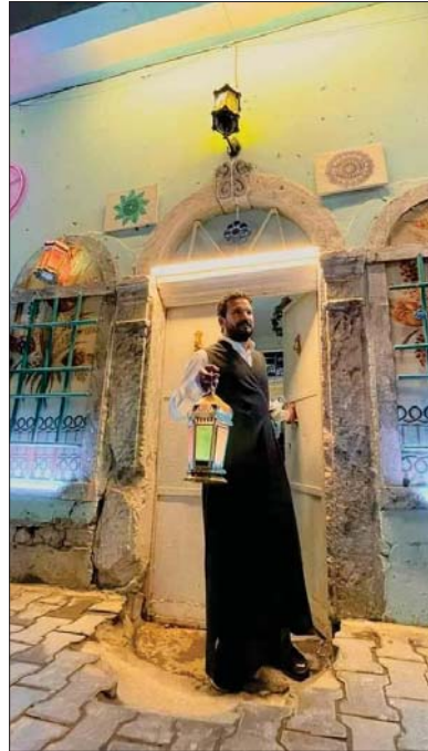
• فتشليل رمضان تشرح من جديد

يكشف هذا المسار الفكري كما أشرنا قبل لحظة، عن معاناة تحاول أن تصل المثقف بمسؤوليته الاجتماعية، والعمل الثقافي بالواقع العيش.