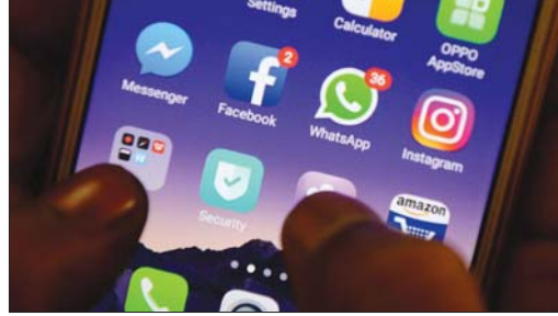
• توقف اربع العالم