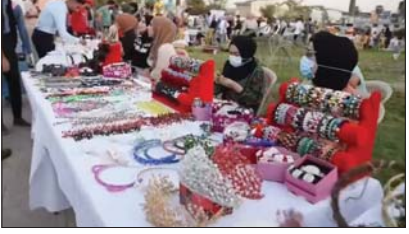
• من فعاليات مهرجان السلام

مكونات الشعب الواحد ولغلبهم من المحافظات العراقية، بغرض تنشيط وتفعيل الحركة الثقافية في مدينة الموصل.