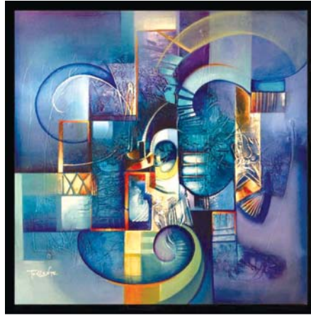
لوحة أن بولان