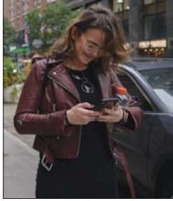
• ساعات زرعت الجيرة والشك لدى الناس

تصفح منصات التواصل الاجتماعي مرض أصاب الجميع، وما أن توقفت مساء امس الأول الاثنين، حتى أصيب الناس بالذعر والتوجس من كشف معلوماتهم في الصفحات الخاصة بهم، هذا الخلل غير المقصود والمجهم، آثار الكثير من التسلّات والشكوك التي لم تستثن أحداً.