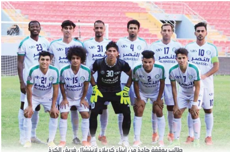
طالب بوفقة جادة من أبناء كيرلا لانتشال فريق الكرة