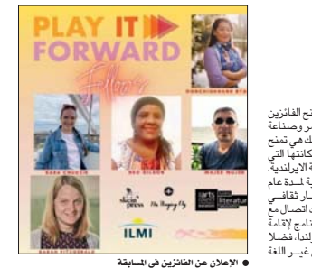
الإعلان عن الفائزين في المسابقة

التأليف اللغوية)، ونجد في تراث التفكير النقدي العربي ما يقابل أفكار بوقون لا سيما ما اصطلاح عليه (البلاغة الحقيقية)، (فسياسة البلاغة أشدّ من البلاغة)، كما يذهب الجاحظ في كتابه (البيان التبيين). وعن الأسلوب الكتابي يؤكد وإيم فوكنر أنه وليد ما يتشغل به الكاتب، فما كتبه يوجه أساليماً ويحدّد طريقته في التعامل مع التعبير والأفكار، وقد أجاب رجا عن سؤال أحد طلاب جامعة فرجينيا بشأن أسلوب كتابته: (لم أطور أسلوب، اعتقد أن الأسلوب هو إحدى أدوات المهنة، واعتقد إن أي شخص يقضي وقتاً كثيراً في تطوير أسلوبه أو تتبع أسلوب شخص آخر ليس له الكثير ليقوله، هو يعرف ويشخص ذلك، وأنا قد يكتب بطريقة جميلة ورائعة ولكنها فارغة ليقوله بها شيء، الأمر ليس بهذه الصعوبة، فالقصة التي تحكيها هي التي تغرض أسلوبها، كما أن الأسلوب يتغيّر باستمرار، فما هو جيد، ربما إن يكون جيداً غداً).