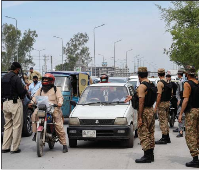
سيطرة قوات باكستانية عند بلدة حدودية مع أفغانستان

أوضح في هذا من فشل المناشدة التي وجهها الرئيس الأميركي السابق باراك أوباما في 2009 إلى من أسامهم «الطالبان الممتلئين» الأمر ببساطة هو أن المجتمع الأفغاني يفتقر للقدرة الكافية لمقاومة انتشار حركة طالبان، كما أن المواطنين الأفغان لم يتروك لديهم بعد القدرة التنظيمية لإنشاء كتلة جديدة تعقد الجبهة الحكومات المتعاقبة التي دعمتها الولايات المتحدة وطالبان في آن واحد، لكن إذا ما أوقف جيران أفغانستان دعمهم لطالبان، وإذا ما كان بقومهم دعمهم للشروع الاقتصادي (مثل مبادرة الحزام والطريق) مستنفرة لهذه الكتلة الجديدة إنكبابها الفوضي لهذا السبب بحت الحركات بين أفغانستان والصين وباكستان أهمية مركزية، بل إنه قد يكتنز أهمية على المدى البعيد من الحوار مع طالبان»