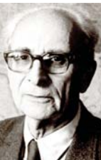
• كلود ليفي شتراوس

رغم هذا الانحسار، لم يستطع الاجتماع السياسي الشيعي، أن ينتج زعماء بدلاً، واكتفى بإعلان المعارضة للزعامة القائمة سواء بالمعروف عن المشاركة في الانتخابات، أو بالتعبير الانفعالي، خاصة في مواقع التواصل الاجتماعي وهذا الاستناد بذاته يمثل إشارة أخرى على نية الزعامة السياسية عند هذا الاجتماع كشف عن معتقد العميق ما أن أجريت أولى انتخابات برلمانية حرة، بعد شائبة عقود على تأسيس الدولة العراقية الحديثة.