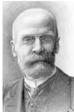
• ميبيل دوراكيه

إلا أنه وبالرغم من اعتماد بعض علماء الإنثروبولوجيا على مفولات النماذج البديئية، وأبرزهم جيلبرت دوران، فإن الإنثروبولوجية وتحديداً البديئية لم تنتج بشكل مثالي على هذا الاتجاه والمنهج، وهو ما حدا بالأساتذة أنثروبولوجيا بجامعة كارولينا تكندا، تشارلز دي لايفين Charles D. Laughlin الموسوم "النماذج البديئية نحو إنثروبولوجيا للوعي 2014" لتوجيه نقد تاريخ الإنثروبولوجيا أنها بقيت لأكثر من نصف قرن من غير أن تثار أي نقاشات أو مناقشات، خاصة في ما يتعلق بإنثروبولوجية الوعي كما يستبصر هذا السياق هو ما دفع البحث إلى إيجاد اشتغال بمنهج النماذج البديئية على أن يحقق موازنة مع المنهجية الإنثروبولوجية، انطلاقاً من أن التحلل البحثي لـ كارل يونغ وأتباعه - فضلاً عن تبني هذا الاتجاه من المثقفين في الفلسفة، لا يمكن الاعتماد عليه، وفقاً للاشترطات المنهجية وهو ما حدا باختيار الأديان التي تقدم علم تاريخ الأديان والفلسفوي لبرونو ميرسيا إيلاد Mircea Eliade و"صحة أعماله التي أعتمد فيها على دراسات ميدانية أجراها بنفسه في الهند وفي أماكن أخرى حل فيها، فضلاً عما قام به إيلاد على الدراسات الإنثروبولوجية والإنثروبولوجيا منها خاصة في تبني الاتجاه النماذج البديئية.