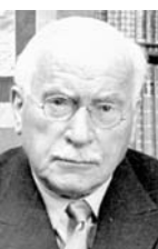
• يونغ، النماذج البديئية الموانة مع المنهجية الإنثروبولوجية

حددت الإثنوغرافيا، مساراتها النظرية المتعلقة بالبحث عن الزعامة السياسية في الأديان الإنثروبولوجية، وهو ما أتاح الافتتاح على مراحل واتجاهات هذه الدراسات التخصصية