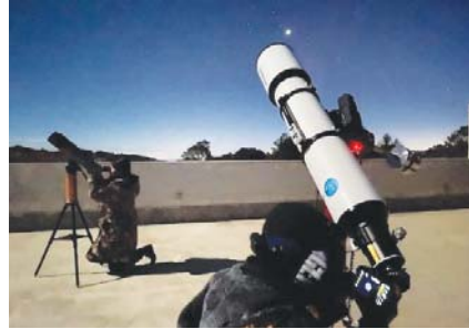
يستخدم علماء الفلك الهواة مسقط دار ضيافة Gaomeigu لاكتشاف النجوم.

وإغلاق الستائر ليلاً، للحفاظ على ظلمة الليل بنحو سليم ومفيد، ومن غير الواضح مدى فائدة هذه الإجراءات.