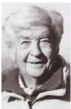
• دوران، الأنثروبولوجية لم تنتج على "النماذج البديئية"