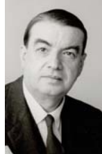
• روجيه كابوا

منهج النماذج البديئية قدم بالشكل الحديث له على يد عالم التحليل النفسي البارز "كارل يونغ"، ومنذ ذلك الحين احتذى علماء عديدين من طلبة "يونغ" خطاه في تبنيته، كاتجاه ومنهج وجهاز في التحليل النفسي الاجتماعي والثقافي