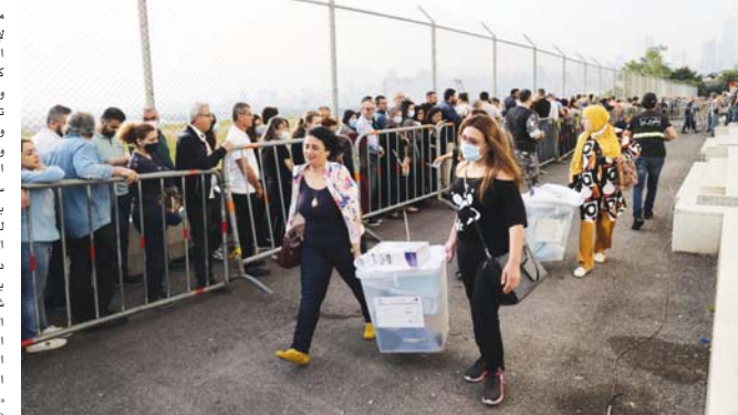
● موظفو الخدمة المدنية اللبنانيون المكثفون بإدارة مراكز الاقتراع يحملون الصناديق الخاصة بالاقتراع عشية الانتخابات النيابية التي ستجرى، اليوم الأحد.

في وقت وصف فيه ديفد شينكر، مساعد وزير الخارجية لشؤون الشرق الأدنى السابق ساسة لبنان بالترجسجين والشخصانيين الذين سيكون بعضهم بعضاً في الانتخابات. ويتقاسم المسلمون والسبع مناصفة خريطة البرهان اللبناني السياسية المولفة من 128 نائباً، وواقع 64 نائباً لكل فريق، وتقع ضمن حصة المسلمين كوتا الدروز بنوابها الشامية وكوتا العلويين بنائبين اثنين، فيما يتمتع المارونية بحصة الأسد في النواب المسيحيين بواقع 34 نائباً وتوزع المقاعد الثلاثون الباقية على الطوائف المسيحية الأخرى، هذا وكان لبنان قد دخل يوم أمس السبت، مرحلة الانتخاب الأخير، إلى حين إقبال صناديق الاقتراع مساء اليوم الأحد حيث ذكرت هيئة الإشراف على الانتخابات وسائل الإعلام المرئية والسموعة والقرؤية كافة، وجميع المرشحين واللوائح والجهات السياسية، انه اعتباراً من الساعة صفر لليوم السابق يوم الانتخابات ولفظة إقبال صناديق الاقتراع في مختلف مراحلها التقيّد بالصمت الانتخابي، وجاء يوم الصمت في أعقاب حملات سياسية قاسية بين الفرقاء استهدت بكل ألوان التخوين والتهامات المتبادلة ليحمل كل طرف الترميم الآخر مسؤولية الانهيار الذي بات يعصف بالبلاد إثر تراكم الأزمات الخائفة التي طالت كل القطاعات الحياتية، ولعل الأمر الأبرز لهذه الانتخابات هي غياب سعد الحريري رعيم تيار المستقبل الذي أعلن في وقت سابق اعتزاله الحياة السياسية ومقاطعة الانتخابات مما ألقى بظلال كثيفة من التردد والإحجام عن المشاركة في شرائع واسعة