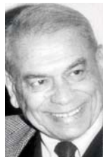
• شرابي النظام الأبي

وجد البحث في هذا السياق مراده بدراسة لعالم الإنثروبولوجيا الفرنسي "كلود ليفي ستروس"، لمنهج فريد من الزعامة السياسية الجنوية تعرف بالناميبيكوارا، ودراسة عالم الإنثروبولوجيا النرويجي فيرديريك بارث، وكان الإطار الجامع لكل هؤلاء هو التحول الذي أنتجته الفلسفة الطاهرية الفينومينولوجيا على يد إدموند هوسرل، مطلع القرن العشرين والمنح التجريبي للبحث.