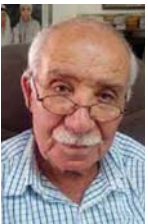
• محمود الشيخ والريد

إبان التظاهرات العارمة في وسط وجنوب العراق في تشرين الأول 2019، كانت هناك رغبة عنيفة لدى الآلاف من الشباب الشيعي للإطاحة بمجموعة من الزعماء السياسيين، اعتقاداً منهم أنهم المسؤولون عن الحياة البائسة التي يعيشونها، وبهما تعدت المطالب والشعارات التي رفضت في تلك الاحتجاجات، إلا أن مطلب الخلاص من هؤلاء الزعماء كان هو الكامن خلف كل تلك المطالب والشعارات، وشعوراً منهم أن هذا الهدف هو فاتحة الأمل، لعراق أفضل من عراق ما بين 2003 - 2019، وعزز هذه الفعالية بشكل أكبر، الغف الذي تعرض له المحتجون والذي سقط فيه المئات من القتلى والآلاف من الجرحى.