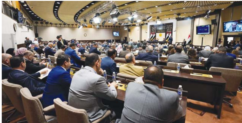
الغرفة ساحة النواب المستقلين لطرح مبادراتهم