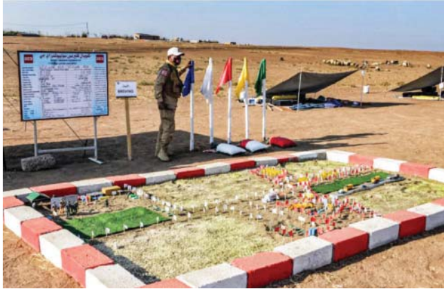
● تطوير المناطق من الألغام بعيد الحياة إليها

على أراضيها حتى عام 2028 بحسب اتفاقية (أوتاوا) من دون تمويل حكومي دولي، الذي يشمل الميوات المضادة للألغام إضافة إلى الميوات المتكررة المصنوعة تجاه هذا العمل يجب أن تأخذ خطوط كبيرة تجاه هذا العمل بإياديه والمساهمة في تمويل الجهات المختصة بذلك ، مستدركا بأنه لا يمكن تطهير جزء من تلك الأراضي وترك أجزاء أخرى ملوثة بالألغام التزاماً بالاتفاقية. إذ يجب تطهيرها بأكملها. وتنه إلى أن برامج التطهير والإزالة ما هي إلا جزء بسيط من إعادة الحياة للمناطق الملوثة بالألغام، كما حصل في شط العرب حيث شملت الأعمال تطهير المياه والقنازل والمساحات الخضراء، وأشاد به التعاون المنقطع النظير مع دائرة شؤون الألغام في وزارة البيئة التي تحتاج إلى تمويل مستمر لتفريد برامجها في هذا الجانب الذي يمكن أن يحول سنوات عديدة.