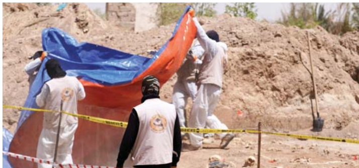
● مقبرة جماعية فتحت أمس بالقرب من مدينة النجف