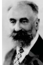
• مازيل مائوس