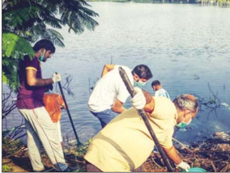
أدوات بسيطة هي كل ما يملكه المتطوعون لتنظيف الحيز المائي لتأهيل نادو

تأهيل نادو، وهي الولاية الأكبر في جنوب الهند، عاصمتها تشيناي يسكنها نحو عشرة ملايين نسمة. كانت قد تصدّرت عناوين الأخبار العالمية خلال السنوات الأخيرة، من خلال فيضانات دمدمة سنة 2015، وجفاف شديد سنة 2018. فقد شردت الفيضانات آلاف السكان في عشية وضحاها، وكان الجفاف هو الأسوأ الذي شهدته الولاية خلال سبعين سنة. علماً أنها تضم 39 ألف موقع مائي. لكن حتى مع بذل الحكومة جهوداً ضخمة لمواجهة هذا المناخ في المناطق أخذ سكان القرى وصولاً إلى أبناء تشيناي، على عاتقهم إحياء البحيرات والآبار الميته، أو الموشكة على الاضمحلال ضمن البحيرة وصيانة القنوات والممرات ليصل الماء إلى جيوب في المنطقة بقيت جافة طيلة عقود مضت.