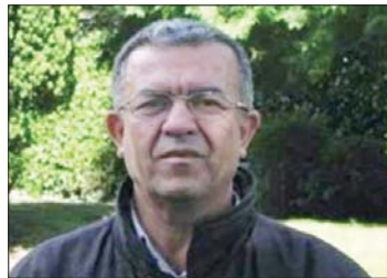
• ألوان الدويهي