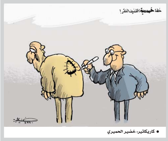
خطة خميسية تخفيف الفقر!

«بعد بيات بلا عشاء» مثل شعبي عراقي قديم يختصر الكثير من التفاصيل المتعلقة بالأمن الغذائي للعراقيين، ومن تلك التفاصيل، أن العراقي ما جاع وإن يجوع كما انه ليس جائعا الآن، ذلك فقد قول تقرير برنامج الأغذية العالمي الذي وضع العراق الى جانب أكثر سبعة بلدان جوعا في العالم بالاستغراب وربما الاستهجان، إذ لم يُعقل منذ لُقمة تقيهم غائلة الجوع، الذي يعتقد بهم الصوماليون أو النغشيريون؟ فهدد البلدان تعاني جوعا متجزرا، ولطالما نقلت لنا الكابريات شاعده مؤلة لتلك الشعوب، وهم كخص البطون ويتقاتلون من اجل الحصول على لقمة تقيهم غائلة الجوع، الذي يعتقد بهم منذ عقود طويلة من الزمن كما لا يمكن باي حال من الأحوال مقارنة بلد متوسط دخل الفرد فيه 6 الاف دولار وموارنته أكثر من 100 مليار دولار سنويا، مع بلد آخر متوسط دخل الفرد اقل من 300 دولار، مثلا، ومن المؤكد ان المقارنة ستكون غير منصفة، انا ما اخذنا بنظر الاعتبار ما يتوافر عليه العراق من ثروات، لعل في مقدمتها الثور، فانا لم يكن لدينا غير الثور، فانا والحال هذه لن نجوع ابداً، ومن دون الخوص في تفاصيل الواقع المعيشي للعراقيين، والذي لا أريد وأنا اتحدث في حياتيات هذا الملأ المهم والحساس، ان ارسم صورة وريدة للمعاشرة، بقر ما كانت اريد ان اقول، ان هناك فرقا بين ما رسمته خريطة برنامج الغذاء العالمي، ان صورة عمراء قائمة للوضع الكروك، لم يكن منظيا ابدا.