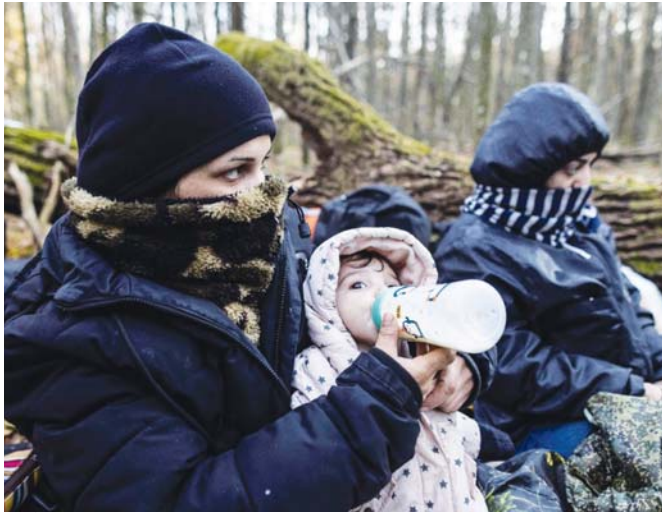
أ ف ب

كشفت وزارة الخارجية، أمس الجمعة، عن توجيه حكومي بشأن إعادة الطوعية للعراقيين العالقين في الحدود البيلاروسية، بينما طالب خبير في حقوق الإنسان الحكومة إلى اتخاذ قرارات آتية عاجلة لترتيب أوضاعهم واقتادهم من رحلة تحولت من أمل بالعيش في أوروبا إلى كابوس مبيت.