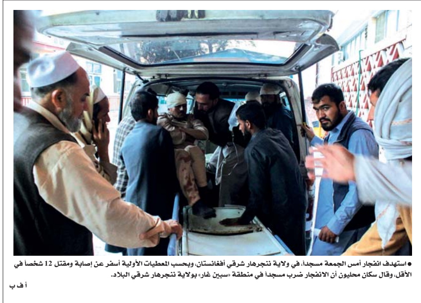
استهداف انتحار أمس الجمعة مسجدًا، في ولاية تنجرهار شرقي أفغانستان، وبحسب المصليات الأولية أسفر عن إصابة ومقتل 12 شخصًا في الأقل، وقال سكان محليون أن الانتحار ضرب مسجدًا في منطقة «سبين غار» بولاية تنجرهار شرقي البلاد.

في ذلك، نقلت مصادر أمنية وأثرية الفاطمية، أوقفت إصدار جميع أنواع التأشيرات لبنان، الجالية اللبنانية، حتى إشعار آخر، وذلك على خلفية الأزمة الدبلوماسية الأخيرة بين دول مجلس التعاون الخليجي وأمناء، كما أفادت معلومات أخرى بأنّ ثمة خطوات تصعيدية ستعدها اليها الملكة العربية السعودية سيراً على الأثر لتتصاعد مع لبنان، إذ يستند في الأيام المقبلة تلك الإجراءات ليقترص ملأ من التأشيرات الصادرة عن السفارة السعودية في بيروت على الحالات الإنسانية الضيقة جداً، بينما القطر الشديداً من زال بسور الجانب اللبناني من الخطوة الأكثر تأثيراً والمنظمة بطر اللبنانيين القيمين في السعودية وفي لبنان خليجية أخرى. رئيس الحرس القديم الاستراتيجي وليد جنبلاط، على قلق من موقفه الأخير من «حزب الله» يقول إنه لا يريد «الانضمام إلى جبهة سياسية ضد حزب الله» موضحاً أنّ «موقفنا كان عفويًا وتعبيريًا عن واقع قاس، نحن نتخفق وكان علينا أن نعتبر» - وأضاف - «الانضمام إلى جبهة سياسية ضد «حزب الله» - بقوله - «لنني الكفيل من الجبهات» واعتبر أنه «لا داعي للتعاون بل لبنان أو منطقة» معتبراً أنّ «بلاد الأرز تنفذ هويتها ومهذبة بالاختفاء».