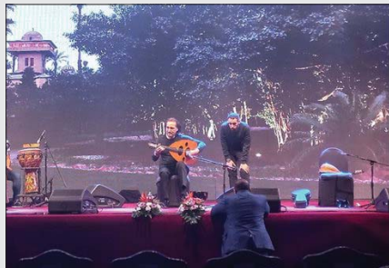
• نائب من حفل قصر النيل

معها، لذلك لبث الدعوة وكنت سعيداً، أولاً لأنني أقدم حفلة لشخصية وطنية مهمة، وثانياً لأزور بلدي الحبيب العراق، فلا بد من زيارة وطني بين فترة وأخرى لكي تنفخ هواء بغداد الحبيبة». وعن إقامته للحفل الناجح في قصر النيل الأسبوع الفات، أوضح أن «الحفل أقيم برعاية الأمير عباس حلمي رئيس جمعية اصداقاً، قصور النيل وهو قصر جده محمد علي، وهناك اصداقاً كثر ممنون للجمعية وهم من نوات المجتمع وقد جنت من برلين اسهاماً مني لدعم هذه الجمعية والقصر والأسرة العزيزة