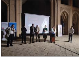
• لجنة التحكيم تعلن فوز الفيلم