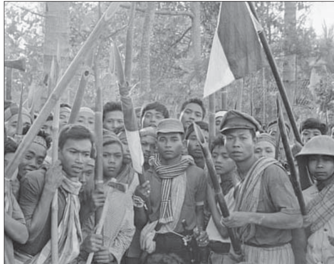
• مجموعة من الوطنيين والجنود بعملية بحث عن الشيوعيين

شهدت بداية العام 1965 وصول إد واين، وهو مسؤول من وزارة الخارجية البريطانية، الي باب فيلا ضمن مجمع سكني أثيق في مستعمرة سنغافورة. لكن واين لم يكن مسؤولا عاديا، وإنما متخصصا من قسم حرب الدعاية في الوزارة ويديعي «قسم أبحاث المعلومات» وجرى تعيينه لقيادة فريق صغير مكون من مسؤول أدنى مرتبة وأربعة سكان محليين وموظفين منتدبين للوحدة من لندن. سجل وصول واين وزملائه بداية ما وصفت قادة العملية لاحقا بأحدى أكثر عمليات الدعاية نجاحا في تاريخ بريطانيا بعد الحرب، وساعدت العملية السرية بإسقاط زعيم رابع دولة عالميا من حيث الكثافة السكانية وساهمت بقتل جماعي لأكثر من نصف مليون مواطن فيها.