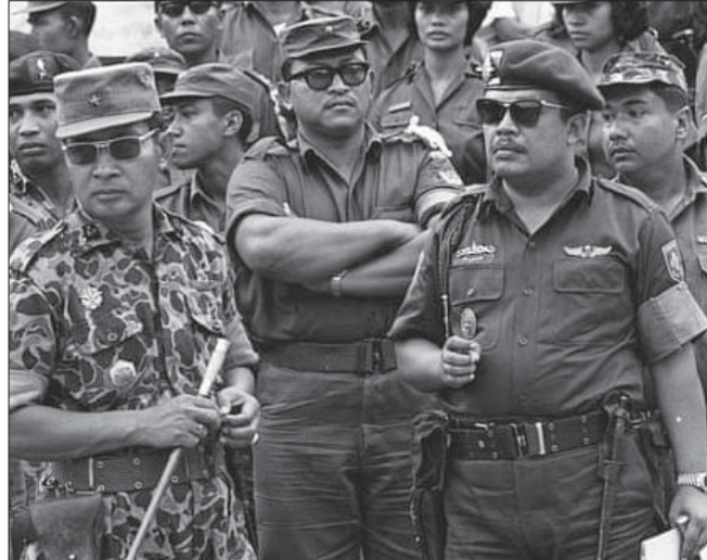
• سوهارتو في تشييع ستة ضباط قتلوا في محاولة الانقلاب

اتهامات ملققة أعيد تدوير قصة دعاية الجيش إلى إندونيسيا في كانون الثاني 1966 بالرسالة الخفية 23 مع تقرير عن أبحاث لعشورين شيوعيين استجوبهما الجيش، وربط أحدهما وزير خارجية سوكراتزو «سويانديرو» ببناء غرفة تعذيب يستخدمها الحزب ضد مسجنائه، ثم ألقوا في عضو بالتنظيم النسوي من تلقا التكميم لتنفيذ مهمة تشويه الضباط. الترم قسم الأبحاث الصمت عندما هاجم النابح، وتقول وثيقة من كانون الأول 1965 أن عليهم «عدم فعل أي شيء، يحزن الجنرالات، وتذكر الرسالة الخفية بالتفصيل قصصا عن حوادث متعلقة لأعمال الشيوعيين لكنها لم تذكر صراحة أعمال القتل التي ارتكبتها الجيش. تجاوزت السياسة تلك الحد، وفي تقرير سايامو 1965 كتب واين أنهم استخدموا تلك الرسائل «الهجمات مستمرة على الشيوعيين» -والدعم غير المباشر- لعملات التطهير والسيطرة من قبل الضباط. انتهت الحملة العمومية ضد الحزب الشيوعي الإندونيسي والتي تضمنت بمقتل أكثر من نصف مليون لسان بحلول أيار 1966، وأجبر الشيوعيين سوكراتزو يوم 11 آذار على تسليم السلطة إلى الجنرال سوهارتو. اعتبر واين العملية ناجحة، وتضمن تقريره السنوي لعام 1966 تفاخره بتدوير النابح عمليته لأن جميع أعمانه (المجاهدين) وسوكراتزو والحزب بهم، ويقول بريغهام أن هذه سكرت لواس من جامعة برينستون، لاخرام الوثائق بين «استعداد بريطانيا لاخرام بافعال متناقض فيها المزعومة، والأهمية الكبيرة لدعاية الترويج، في إعطاء وهم امتلاك سوهارتو لثأرنا أعلى هدف اللجيش يوم 14 تشرين الأول استغل التمرد لتقويض سوكراتزو ومن