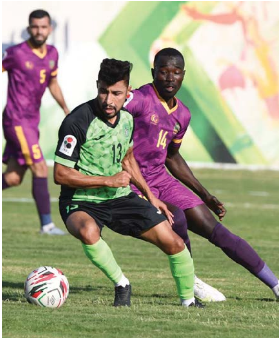
• بغداد: حيدر كاظم

وتشهد هذه الجولة مواجهة مثيرة ستقام بعد غد بين الشجعان المنتشي الجوري على نغمة الوسط وضيفه القوة الجوية الذي يتطلع لحصالة جماهيره، وسيكون ملعب كربلاء الدولي مسرحا لهذا اللقاء.