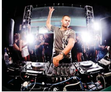
«الدي جي» يهدم الموسيقى الشعبية بالانذار.

منذ القدم والموسيقى الشعبية ترافق أفراح العراقيين. هذه الموسيقى التي عرفت في بلاد النهرين تتغير من جيل إلى آخر بدءاً من الآلات الوترية والايقاعات مروراً بالجابالي والمقام والديكات والوجوي، وتشمل على العديد من الآلات الموسيقية الشرقية مثل القانون والسنتور والمزمار والعود والبزغ والطبلية والجوزة وغيرها من الآلات. حتى وصلت إلى استخدام آلات راقصة مثل الطبل والبوق، لكنها وبعد العام 2003 ودخول التكنولوجيا الحديثة تغيرت واتجه محبوبها إلى «الدي جي» الذي صار يلازم الأفراح.