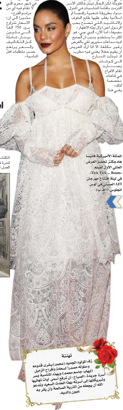
الممثلة الأميركية فانيسا هادجكز تحضر العرض العالي الأول لتيلم «Tick Tick... Boom» في ليلة افتتاح مهرجان AFI الصيني في لوس أنجلوس.

يذكر أن العمل ريع ارقام بناهنده، خلف الكاميرا، وأول تجربة انتاجية يشارك فيها عدد من النجوم البارزين، على رأسهم الممثلة الناز شاكور دوست، بارسا بيروز، فر هوتن شكيبا، سوادبة جعفرزادة وآخرون.