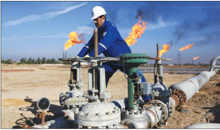
جهود واسعة لزيادة الإنتاج وتطوير السياسة النفطية.

أكد وزير النفط إحسان عبد الجبار التزام العراق باتفاق منظمة «أوبك +» المتعلق بخفض الإنتاج لأن المصلحة تقتضي ذلك، كاشفاً عن العمل في الوقت الحالي لتنفيذ مشروعين كبيرين للتصدير البحري بلغت نسبة الإنتاج في أحدهما قرابة 85 بالمئة، وبينما أكد أن جولات التفاوض تجري في مراحلها الأخيرة، مشيراً إلى أن الوزارة لديها رؤية لتفتح باب التفاوض مع الشركات وشرعت بدراسة بعض العقود النفطية.