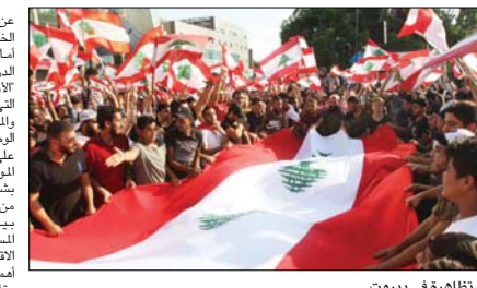
تظاهرة في بيروت

عن دفع سننات (اليوروبوند) وهذا يعتبر من الخطايا التاريخية، أما كتلة ضمانة الجبل التي يتزعمها الوزير البرزي السابق طلال أرسلان فأشارت إلى أن الألفية في السلم الأهلي ولعيشة المواطن التي باتت تتراجع يوماً بعد يوم على الصعيد والاحتياجات كافة، نتيجة لتراجع قيمة العملة الوطنية مقابل الدولار الأميركي وانعكاسات على القطاعات الإنتاجية وعلى عملة استيراد المواد الغذائية والأدوية والمروقات التي تؤثر بشكل مباشر في معيشة المواطن".