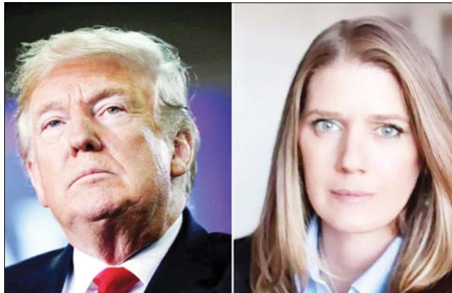
تدخل قضائي بشأن كتاب لابنة شقيق ترامب - وكالات

رغم أن العاصفة غير المسبوقة التي أحدثها مستشار الأمن القومي الأمريكي السابق جون بولتون عبر كتابه عن "البيت الأبيض" تحت إدارة الرئيس دونالد ترامب، لم تهدأ بعد، يواجه الأخير عاصفة جديدة وهذه المرة من داخل الأسرة، حيث رفع روبرت ترامب، الشقيق الأصغر للرئيس الأمريكي، دعوى قضائية جديدة إلى محكمة نيويورك أمس الأول الجمعة، لمنع نشر كتاب لابنة أخيه الآخر المتوفى، تفصح فيه أسرار أسرة ترامب الخفية.