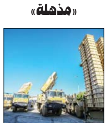
طهران / وكالات

قال القائد العام للحرس الثوري حسين سلامي إن حطر التسليح وفر فرصة للعلماء، لتلبية حاجات البلاد الدفاعية اعتمادا على القدرات الوطنية، معلنا بأن البلاد ستكشف قريبا عن منظومات مذهلة وقال المرار، سلامي في تصريح للصحفيين أمس السبت، عن ماضي زيارته التقفنية لعرض منارات وقدرات منظمة الأبحاث وجهات الاكتفاء الذاتي للقوة البرية للثورة الإسلامية، هناك من جانب حطر تسليحي عالي ضدا، ومن جانب آخر تعد أميركا وحلفاؤها من التهديدات لنا، ولقد وفر الحظر التسليحي الفرصة لعلمائنا لتلبية حاجاتنا الدفاعية اعتمادا على القدرات الوطنية".