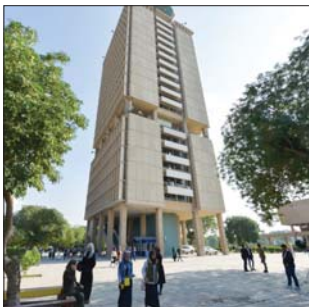
جامعة بغداد، رشيف