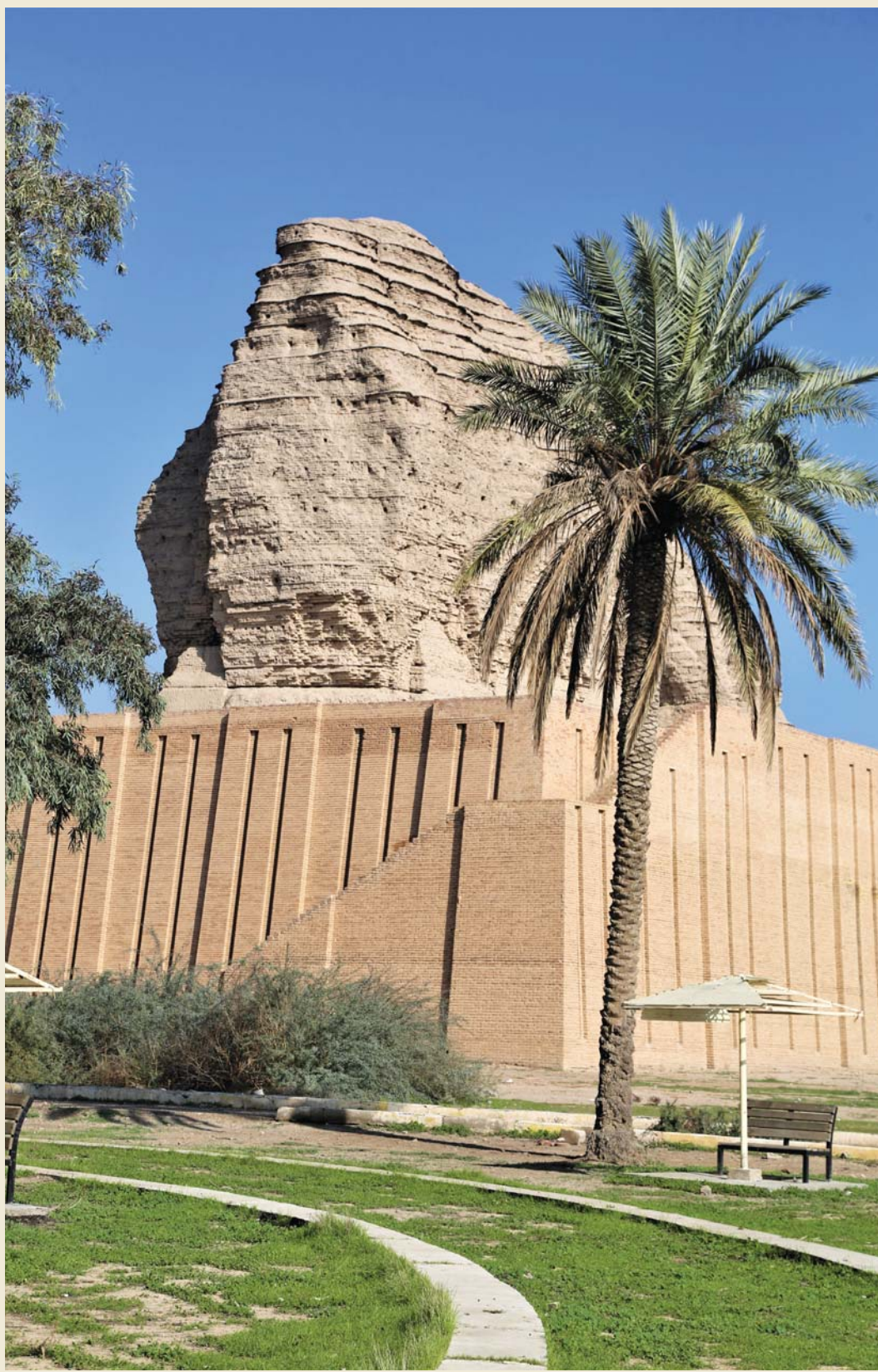
زقورة عفرقوف .. تصوير: خضير العتايبي