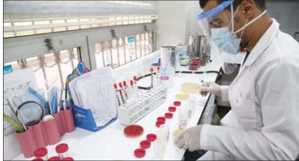
مختبر فحص - اربيش

أوعزت دائرة صحة الرصافة بنصب أسرة إضافية في مستشفيات الكندي وابن الخليل وابن زهر لعلاج مصابي كورونا مع إنشاء ثلاثة مختبرات جديدة لزيادة عدد السعات المنجزة. وبينما عززت وزارة الصحة مستشفيات ذي قار بالأدوية والأجهزة الطبية ووسائل الوقاية، تواصل وزارة الصناعة من خلال معاملها وقد المؤسسات الصحية احتياجاتها من الإكسجين الطبي.