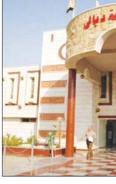
بناية صحة ديالى - اربيش

ورفقت ان المشاريع التي يجري العمل بها من قبل وزارتها تتضمن إنشاء مركز ذي قار بقيمة 40 بليوناً وسيقدم خدمات لـ 66 ألف نسمة وشيرون الذي شارك في الانشاء، وسيخدم 12