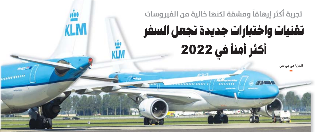
تشن / بي بي سي