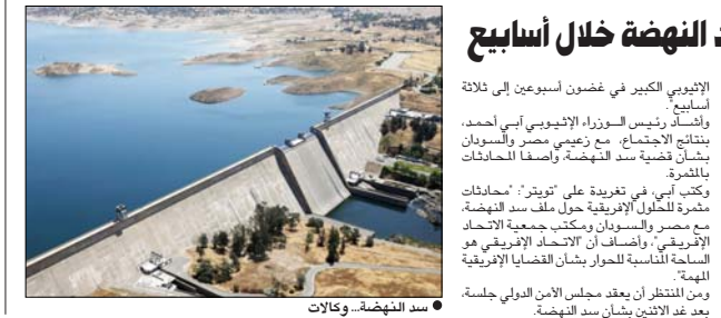
سد النهضة

الرسمي الذي لم يعد له وجود على أرض الواقع وهو 1500 ليرة، وهناك أيضا الدولار الذي عدته نقابة المصرفيين بالتنسيق مع مصرف لبنان وقد تراوح بين 3850 كحد أدنى و 3900 كحد أعلى.