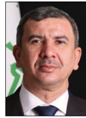
وزير النفط إحسان عبد الجبار