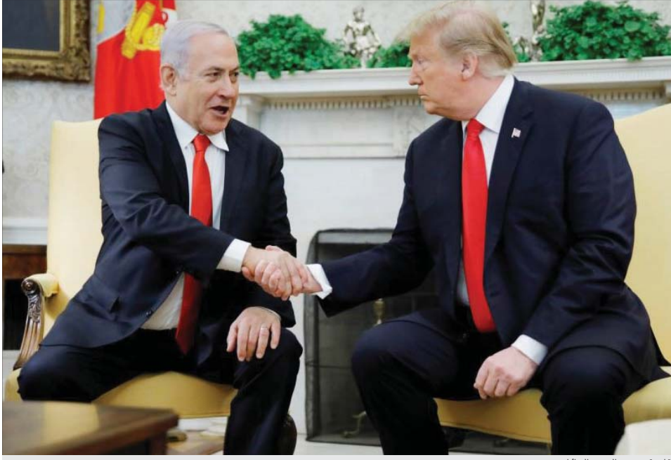
ترامب تعهد بدعم لا محدود لإسرائيل

كارثة إنسانية شهدها العالم تركب هناك. ذلك تشن إسرائيل بانتظام ضربات عسكرية تستهدف سفنات السلاح والبشرية التحتية الإيرانية في سوريا. وسط هذه الأجراء الملتصبة ما أكثر السيناريوهات التي تصور احتمالات اندلاع حرب بقصد أو غير قصد، بين الولايات المتحدة وإيران حتى يصعب حصرها. توقف الاتصالات منى ما أظهرت إيران أو أي من حلفائها على الضغط الأميركي رداً يسفر عن سباق دماء أميركيين أو ينزل خسيرة مؤثرة بالذات التحتية النفطية في المنطقة فإن الأمور قد نقلت بسرعة من السيطرة وخلفاً لما كان عليه الوضع في السنوات الأخيرة من عهد إدارة أوباما لا توجد اليوم خطوط اتصال عالية المستوى بين واشنطن وطهران تسمح بتدارك الأزمة. آخرى في الشرق الأوسط، ولكن إذا كانت لنا من المضي عبرة نستدل بها على ما يمكن أن يأتي به المستقبل فإن غيرة ترامب تنتهه من الاعمال لأن يرد على أي استفزاز إيراني بخطاب استفزازي عدواني رسمياً عبر تويتر، بحسب الترتيب على النار.