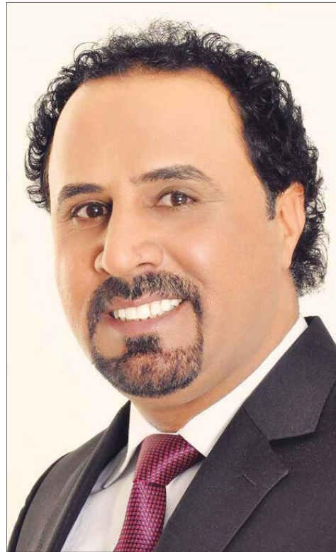
ناجيه الفتلاوي.. يعد ويقدم برنامج "جلسة فكر" في الـ 5,5 من مساء كل سبت، على شاشة تلفزيون العراقية الاخبارية imn

• سهرة يسهر مشاهدو تلفزيون العراقية الرياضية من شبكة الاعلام العراقي، مع برنامج "سهرة رمضان" في الـ 12 ليلاً، طوال الشهر الفضيل.