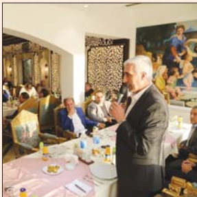
جلال من حصة وزير الشباب للاتحادات الرياضية