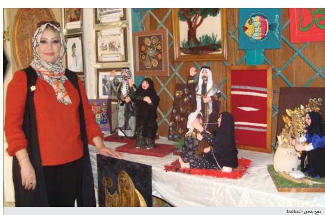
مع بعض اعمالها

مشوارى، ارت ثقافي عن امنية الدمى سراجيا اضافت الدمية تقديم الملائز سواء اكان سانحا او مواطنا عابدا معرفة فيها احساس وروية من جميع الزوايا ، وبالتالي تقدم له معرفة اكثر مما هي صورة عابرة ، نجد هناك اخصاها يمتلكون ثالثة فنية ويعملون على اقتناء تلك الدمى اسود خفيف واخر من القطن الابيض، اضافة الى القطع الاساسية لخياطة البرقع، وغفره ، ولكن مع الاسف بعد المن ثلاثت على ارض الواقع ذلك سعيت بالتعاون مع مديرية التراث الشعبي العراقي بتجسيدها على شكل مصغرات للمهن المنقرضة والحفاظ على الاربث الثقافي للحياة البغدادية. عشقها للحرفة اضافت شاركت في بداية مسيرتي بمعارض مشتركة مع عدد من الفنانين بلوحت تناولت الراء العراقية والتراث البغدادي بالرغم من اعاقتي لكاف عن تطوير نفسي بالفن، وتبعية مهاراتي وقدراتي، وممارسة هوايتي، مثلى كتمل اي شخص معانا، وانانا الاحباط والياس ان يستوطننا حياتي، مشقت هذه الحرية وانتقنها جيدا واخذت الكثير اليها من افكاري، احب عملي وايضا لرفض ان ابيع ان اعلمهم بواقعهم، وعلى هذا اساس بنجر بنا القول انه يجب ان تضع وزارة التربية خطة تربوية تقوي خيال الاطفال وعدم اهنال طاقات الصغار لانها طاقات فاعلة خالفة ان كيف يمكن لوزارة التربية ان تمتي خيال الاطفال؟ باختصار شديد يكتفيا فعل ذلك من خلال تخصيص وقت لسرد قصص جميلة، ومن الممكن استخدام التقنية الحديثة في