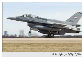
طائرة عراقية من طراز «أف - 16»