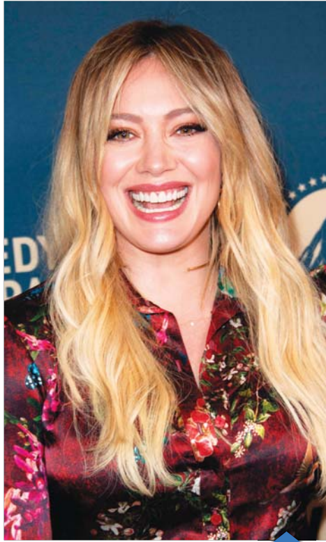
الممثلة الأمريكية "هيلاري داف" خلال حضورها احتفال يوم الصحافة الذي تقيمه شبكة بارامونت والتلفزيون الاراضي في كومبدي ستتران في لوس انجليس.... أ.ف.ب.

فهي تتفنن بكل ما أوتيت من سبل لراضته، تتقن كل الخروف ما أن تلتأ قدمه عتبة الضيف، وتعلمه الأفضل من مطعماها، ولا تتساهل عن سبب مقدمه، وتخبه بأجر عبارات الترحيب، إما إذا كان معروفاً لديها، وعظيم المنزلة والمكانة وصاحب فضل سابق عليها فيضاعف استقباله احتفاءً، وتقام على شرفه الأروام، وطبائعا كما يقال أوس، وهنا تكمن المشكلة، فالأميركان صوفيا، ونحن الذين دعوناهم بتقديم العون فلم يقصروا، خصوصاً من كرسي صدام وظلمه وتنهاله، ومن أسسه التي بناها من ترك صغيرة ولا كبيرة إلا احتفلنا من القاعات والملاعب إلى بيوت الله والبن، فكيف يمكن أن نقول لضيفنا (إرحل) ونخرج عن أعراف مضايقتنا وتقاليدنا هنا. وقبل ذلك كله، إن هذا الضيف يتصرف (بمنايه) كما يرى نفسه واحداً من أهل النار، ولذلك ليس في تيهه أن يرحل فقد جاء ليبي، ولي طوم الا انفسنا ان كان اليوم واليوم واليوم!