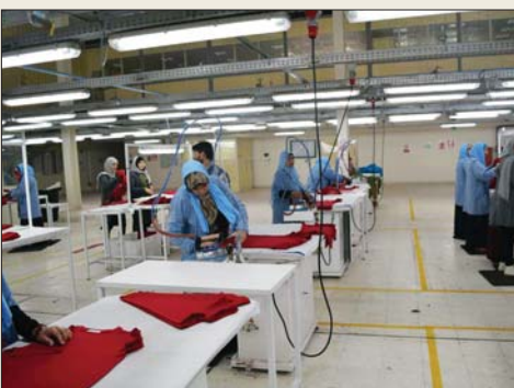
اخذ معامل وزارة الصناعة

بالايجاه الصحيح لبناء صناعة عراقية قادرة على المنافسة والإسهام بالتنمية الاقتصادية، موضحاً ان حماية المنتج المحلي، تعني فرض رسوم جمركية بنسبة 100 بالمئة على المنتج المستورد المائل بعد ان تنتجه الصناعة المحلية بمواصفات عالية وبأسعار معقولة، وبعد ان تحصل المنتجات على شهادات دولية بميزاتها. وذكر الشمرني ان وزارته اتبعت نهجاً نوعياً بالاتانج وليس كيباً بالاعتماد على معالم اللابئية، وفرنسية وبريطانية للإرتقاء، بمستوى الانتاج العام، وعن طريق مضاعفة خطوط الانتاج التي دخلت مؤخرًا الى البلاد، فضلاً عن جودة المنتج وتعزيز الخطوط الانتاجية الكفوءة لتنافس كل السلع المستوردة. في سياق متصل بين ان الاظهر الماضية شهدت ايجاز 12 مشروعاً خدمياً متنوعاً من بينها ثلاثة ملفات استثمارية بمجال الصناعات الحربية والزيوت الخبثائية واعاداً دراسة جدوى لإقامة الخلية.