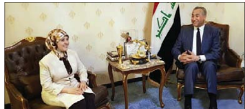
الغلاب يلتقي وكيل وزارة الصحة