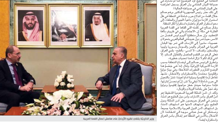
وزير الخارجية يلتقي نظيره الأردني على هامش أعمال القمة العربية