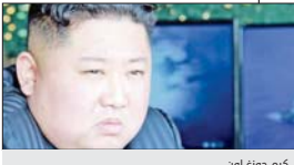
كيم جون أون

أكدت صحيفة "ستيمسمن" أمس الجمعة أن رئيس كوريا الشمالية كيم جونج أون أعدم مبعوثه الخاص إلى واشنطن وأربعة آخرين، بعد فشل المفاوضات بينه وبين الرئيس الأميركي دونالد ترامب. وقالت الصحيفة إن كيم قام بإعدام مبعوثه الذي وضع الحجر الأساس لأجتماع هامزي، ربما بالبرصاص نهبه "خيانة لأزعيم الأعلى"، إلى جانب أربعة مسؤولين آخرين الخاصة الخارجية كما أمر بسجن الترويج الخاصة له بعد أن أخطأت في ترجمة اقتراح قدمه للرئيس الأميركي دونالد ترامب، بينما قُدم وزير خارجية بلاده للعمل في أحد المعسكرات كعقوبة له.