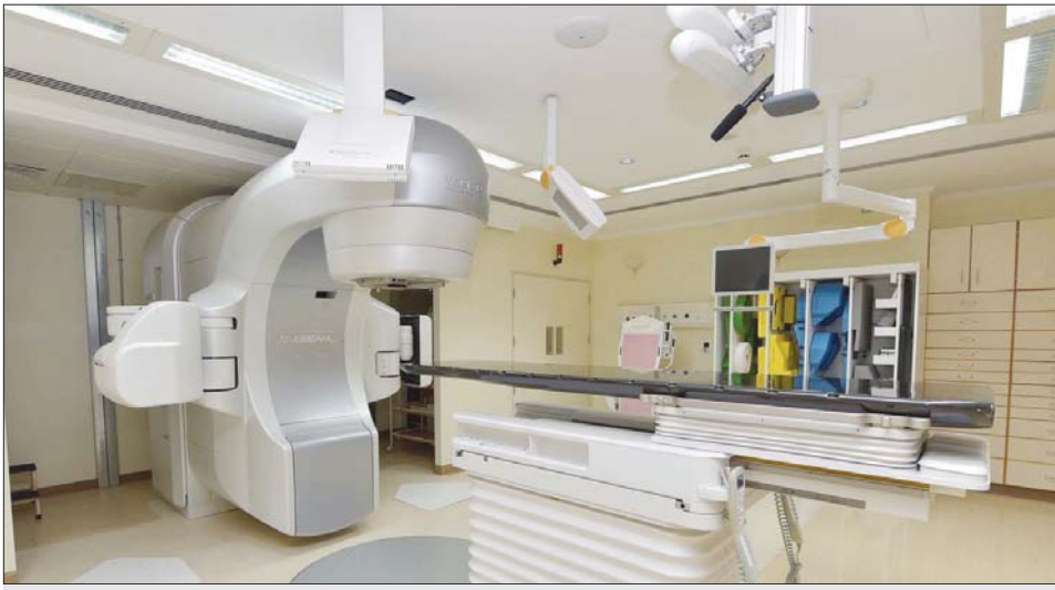
ردهة لفحص المصابين بالسرطان

واسعة، داعياً إلى اتباع طرق الوقاية من المرض كون أكثر من 95 بالمئة من حالات السرطان يمكن معالجتها بالفحص المبكر. لاسيما سرطان الثدي ومن خلال مراكز خاصة بالفحص الذاتي بجميع المراكز الصحية.