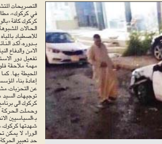
الآثار التي خلفها احد تفجيرات كركوك