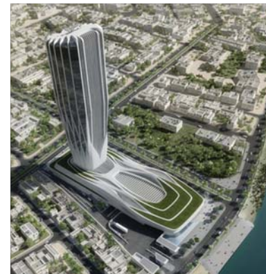
مبنى البنك المركزي الجديد

أعلن البنك المركزي العراقي، أنه عمل على توسيع قاعدة البيانات الخاصة ببنشر أسعار الصرف وأسعار الذهب، على موقعه الالكتروني. وأوضح بيان للمركزي تلقت (الصباح) نسخة منه ان هذه القاعدة باتت تتضمن المعدلات اليومية والشهريه لسعر صرف الدينار العراقي والمعدلات الأخرى تجاه الدولار الأمريكي وأسعار الذهب، وإشترار إلى "إمكانية الجروج الى هذه