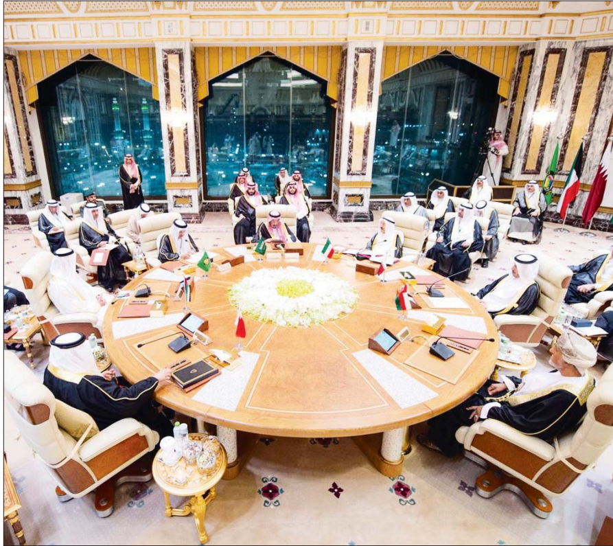
القمة الخليجية في مكة

بدوره قال وزير الخارجية الإيراني، محمد جواد ظريف، إن رسالة «يوم القدس» لهذا العام في تحويل صفة القرن إلى هزيمة القرن، مؤكداً أن القدس ليست للبيع كي تمنحها أميركا لإسرائيل. ويوم القدس العالمي، هو حدث سنوي دعا إليه زعيم الثورة الإسلامية في إيران الراحل آية الله الخميني ويعارض احتلال إسرائيل للقدس، ويجرى فيه حشد وإقامة المظاهرات المناهضة لاحتلال إسرائيل للأراضي الفلسطينية، ويصافى فيه الحشد يوم الجمعة الأخيرة من شهر رمضان المبارك.