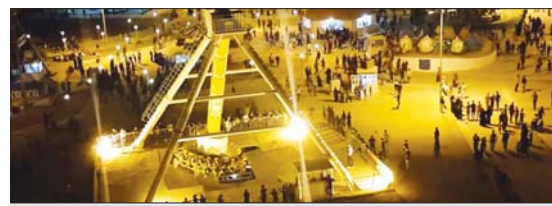
احد مدن الاعجاب في كركوك... اشراف