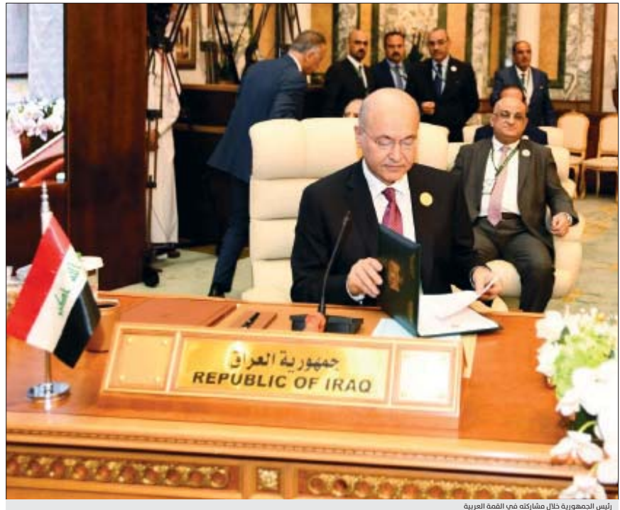
رئيس الجمهورية خلال مشاركته في القمة العربية

أبدى العراق اعتراضه على البيان الختامي للقمة العربية للطائفة التي عُقدت في وقت مبكر من فجر أمس الجمعة في مكة المكرمة بدعوة من المملكة العربية السعودية. بينما أكد رئيس الجمهورية الدكتور برهم صالح خلال كلمته في القمة أن «أمتنا مشتركة ومتلازمة على صعيد المنطقة. وأن العراق يدعم سيادة الدول وعدم التدخل في الشؤون الداخلية». مبيّناً أن «العراق سيبدل أقصى جهده ويفتح باب الحوار البناء لإنهاء التوتر في المنطقة».