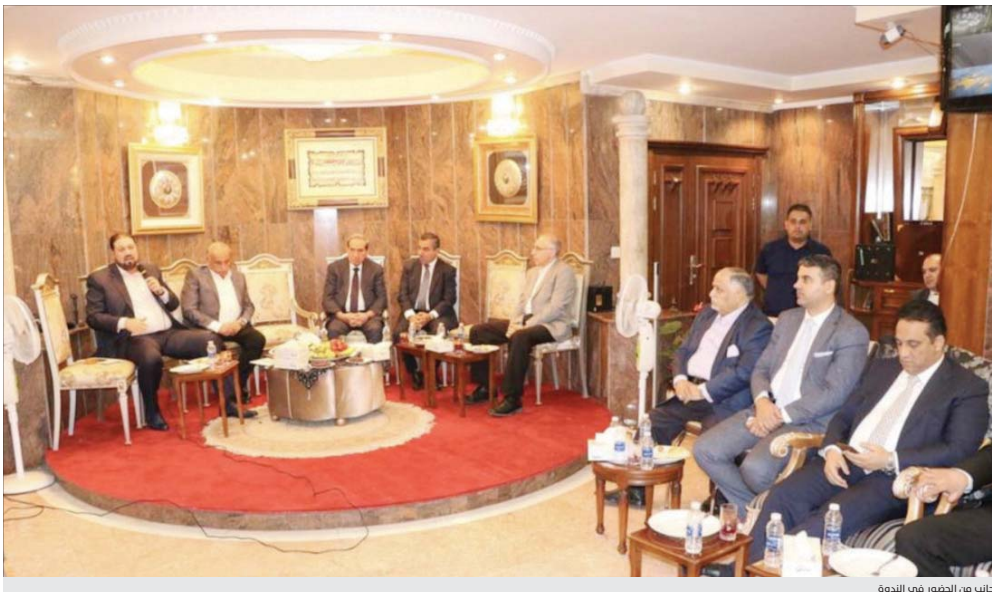
جنب من النخوة