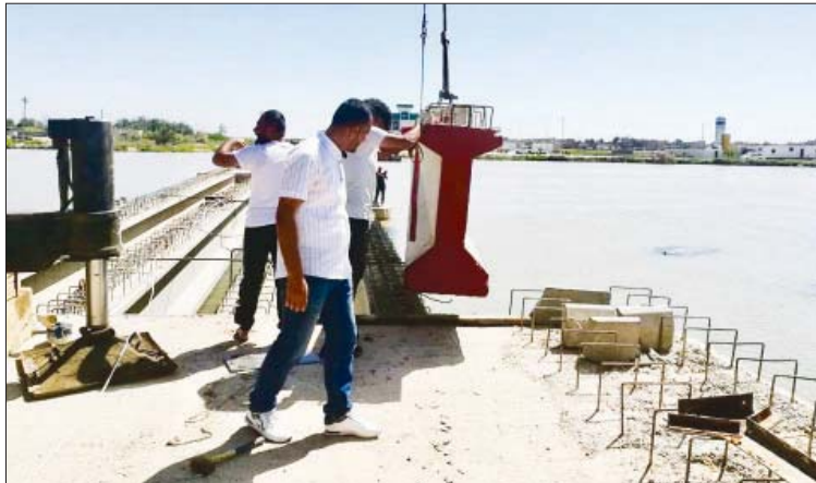
نصب روافد جسر الموقفية

العالم 2014 لاسيما ان نسبة الانجاز فيها كانت قد بلغت 68 بالمئة مؤكدا تخصيص ملياري