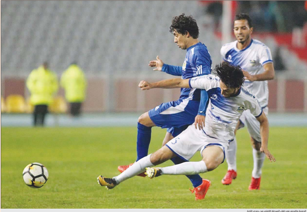
الجوية والنجف، في لقاء المرحلة الأولى من دوري الكرة