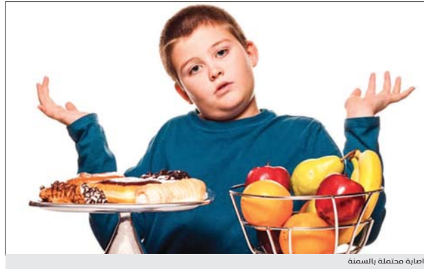
إصابة حتملة بالسمنة