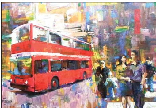
لوحة الفنان نزار العريص