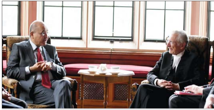
رئيس الجمهورية يلتقي رئيس مجلس اللوردات البريطاني

لقت رئيس الجمهورية برهم صالح إلى أن العراق وبريطانيا يمكن أن يلعبا دوراً فعالاً في استقرار المنطقة، محذراً من أن أي تصعيد فيها قد يؤدي إلى حروب جديدة، وفي حين جدد التأكيد على أن العراق يدعم حقوق الشعب الفلسطيني في إقامة دولة فلسطينية، نبه على أن الحرب يسهل البدء فيها ولكن من الصعب جداً التهاؤها. وفي وقت أشار وزير الخارجية محمد علي الحكيم إلى سعي العراق لإقامة أفضل العلاقات مع بريطانيا، أكدت المملكة المتحدة أنها ستعيد علاقاتها الوثيقة والتاريخية مع العراق.