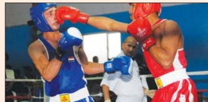
التحاد الملاكمة يستهدف التائق اسبوا

العراق ويستمر المنافسات على مدى اربعة اشهر في اربيل واربعة اشهر في بغداد وستشارك في نسخة الاولى من بطولة طال المدارس التي ستقام في الكويت مطلع اب المقبل.