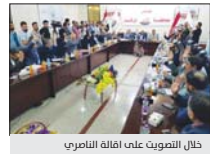
خلال التصويت على اقالة النصاري