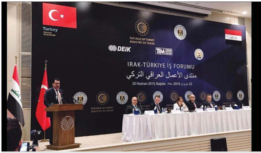
جان من المنتدى

والبضاعة التركية مناسبة للعراق. سعرا وجودة".