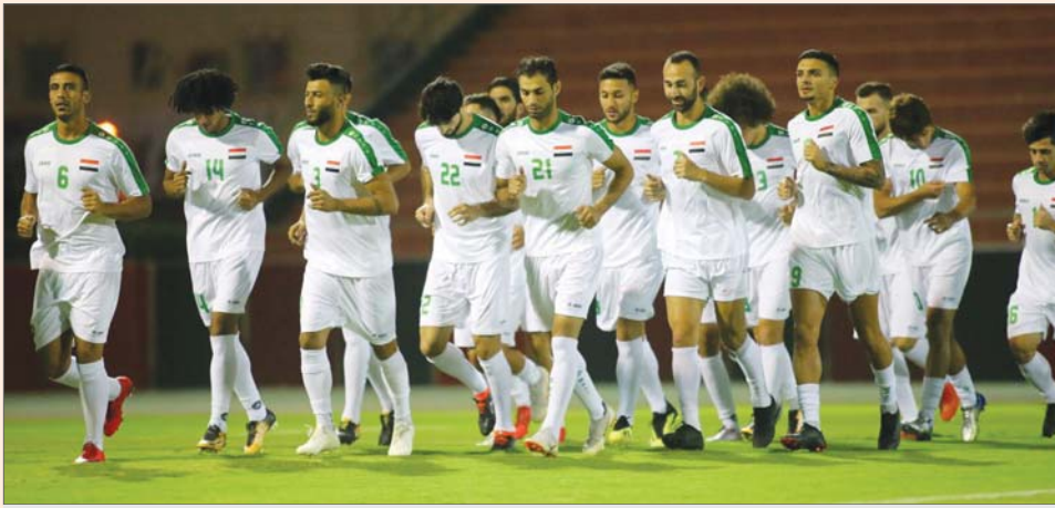
الأسود في وحدة تدريبية سابقة

بها أرضية اللعب دوريا مع منظومة السقي. واطلع الوفد على نوع السور الخاصة بالمستقبل الأخضر من نوع برمودا ومن شركة إسبانية متخصصة والمدة القياسية في زراعتها وتجهيزها بشكل كامل وفق طرق مبتكرة حديثة حسب الأجواء العراقية. وتوافق الوفد الزائر من رئيس الشركة وعدد من المهندسين.