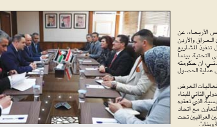
نور الدين الهميدي خلال اجتماعه مع وزير التخطيط والتعاون الاقليمي محمد المسعيس