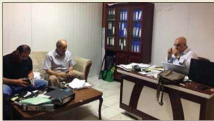
مدير دائرة رعاية ضحايا الارهاب يستقبل المشمولين

بالإضافة التي قد تسبب لهم المتاعب، وستقام بإشراف مرشدتين لهم باع طويل وخبرة كبيرة وستستمر لحين موعد تفويضهم الى الديار المقدسة بتدوره افاض مصدر مسؤول في مؤسسة الشهداء، لـ"الصباح" بان قسم شؤون الميراثات بدائرة التفتيش الشعبي التابع الى المؤسسة، يباشر تدقيق معاملات المنحة العقارية التي تشمل توزيع مبالغ بين ذوي شهداء الحشد الشعبي الذين تم منحهم قطع ارض وفق القانون رقم 2 لسنة 2016. وبين ان الدائرة تشكلت من تدقيق 35 معاملة كدفعة اولى من المشمولين لخميرة شهداء الصرصة، داعياً ذوي الشهداء، الى التواصل مع الديرات من اجل الاسراع بانجاز المعاملات، مبيناً ان مديرية شهداء واسط اكملت ايضا جميع الاجراءات الادارية والقانونية واحالتها على الواتر المختصة لسح وفرز وتجهئة الاراضي والمباشرة بتوزيعها لاسيما انها وزعت خلال العام الماضي فدفعت شملت جميع المتقدمين بطليات الحصول على قطعة ارض من الذين اكملوا الاجراءات اللازمة، بينما انجزت هذا العام جميع الطليات الجديدة بانتظار ايعاز مديرية بلدية الكوت والواتر التابعة لها في عموم الاقضية والنواحي للمباشرة بالتوزيع.