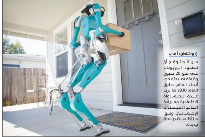
«واشنطن/ أف ب»

من المتوقع أن تستحوذ الروبوتات على نحو 20 مليون وظيفة تصنيعية في أنحاء العالم بحلول العام 2030 ما يزيد عن المساواة الناتج الاقتصادي، وفق ما أظهرت دراسة جديدة.