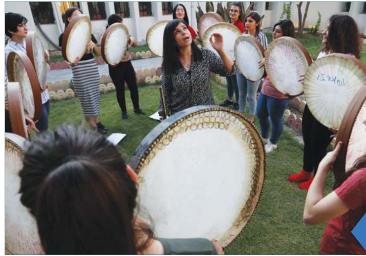
فرقة 40 Plaits التي تتم عازماً أزيدياً وعازقات مسلمات يتربون على أغنية كردية تقليدية هي دهوك... أ ف ب

يختتم منتدى الصيد الثقافي المنتبج عن نادي الصيد، موسمه الحالي بجلسة من «صحافة ثورة العشرين» بمناسبة ذكراها الـ 99. يحاضر في الجلسة د. نوري عبد الحميد العاني، في الساعة 6 من مساء السبت 29 حزيران، في قاعة المنتدى في نادي الصيد.