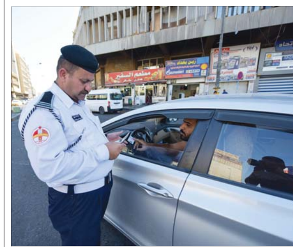
وزارة الداخلية توجه مديرية المرور العامة، امس الاربعاء، بإصدار اجازات السوق والسنوات خلال 24 ساعة