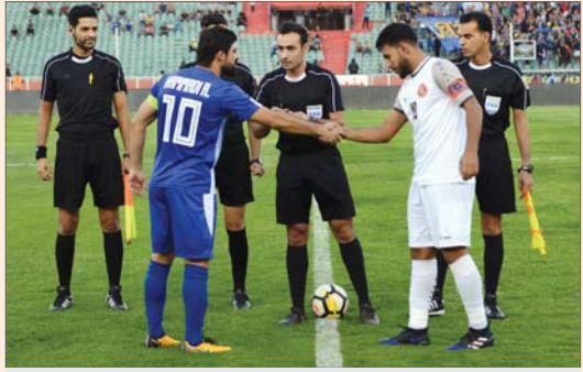
الجوية يهزم الحظاظ على امانة الضلعة في نيل اللقب