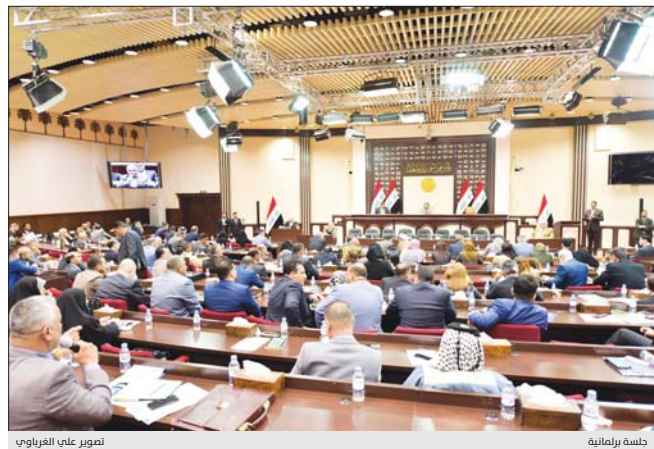
تصوير على الفرياني