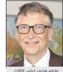
وليام هرتز رئيس الثالث

1977 الإعلان عن استقلال جيبوتي. 1991 القوات اليوغوسلافية تغزو جمهورية سلوفينيا بعد إعلانها الاستقلال. 2007 رئيس الوزراء البريطاني توني بلير يستقيل من منصبه، وجوردون براون خلفه. 2008 بيل غيتس يتخلى عن منصبه في مؤسسة مايكروسوفت وذلك لرغبته بالتفرغ لأعمال مؤسسة بيل وميلينا غيتس.2009 الرئيس اللبناني ميشال سليمان يكلف سعد الدين الحريري بتشكيل الحكومة الجديدة وذلك بعد تسميته من 86 نائباً في البرلمان. 2015 موجة حر في باكستان تقتل أكثر من 1300 شخص منذ أن ضربت البلاد منذ نحو نصف شهر. 2018 مركبة هايابوسا 2 الفضائية اليابانية تصل كويكب 162173 ريغوو في مهمة جمع عينات. 2017 سلسلة من الهجمات الإلكترونية تجتاح