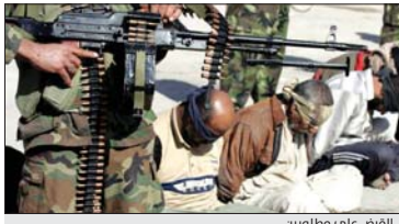
القبض على متطوعين

واضح ان «الإرهابي اعترف من خلال التحقيقات الأولية بانتمائه لعصابات داعش وتم تكليفه بالتنصت اعلا وكان يساعد في التخصيص من سكان المنطقة والأخبار عنهم ويحرض على القتل ويحث المواطنين على التطوع في عصابات داعش الإرهابية» وبين ان «القائد القبض على الإرهابي تم جراه العادل» ولقد البيان ان «قوة مشتركة من فوج طوارئ الشرطة الثاني عشر التابع لقيادة شرطة نينوى، لقت القبض على 10 عناصر من عصابات داعش الإرهابية في مناطق وأحياء الهضبة والقاهرة والزهراء في الجانب الأيسر لمدينة الموصل» وتابع ان «من بينهم اثنين كانا يعملان في ما يسمى الأمية، وأحدهم كان يعمل في ما يسمى بالشريعة، والبقية كانوا يعملون بصفة مقاتل في ما يسمى ببيضان الجند خلال فترة سيطرة عصابات داعش الإرهابية على مدينة الموصل».