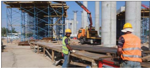
تنفيذ المشاريع الخدمية في النجف

أسرة في النجف براتب الرعاية الاجتماعية، وتمت الموافقة على فتح مركز للتلوع في النجف على ملاك وزارة الدفاع