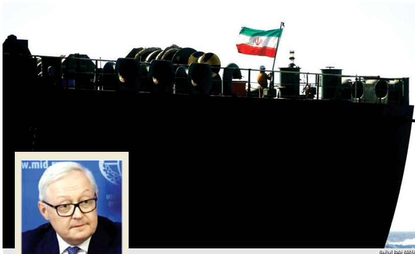
ناقله نطنز الإيرانية

حذرت روسيا من عواقب وخيمة لانهيار المحتمل للاتفاق النووي مع إيران، مشيرة إلى أن ذلك ان حصل سيؤدي إلى تصعيد حدة التوتر في العالم وقد يتحول إلى صراع مفتوح. بينما أكدت طهران أن جميع ظواهرها في خفض التزاماتها تأتي في إطار الاتفاق النووي وليس خارجه. ووافقة العقوبات المفروضة عليها من قبل أميركا بأنها فاشلة وشككت فرصة ذهبية، لتخليص الاقتصاد الإيراني من الاعتماد على النفط.