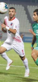
◀ بغداد/ الصباح

كما ان اللقاء المذكور يندرج ضمن نفس البطولة وبالتالي لا يوجد مبرر واضح لنقل البطولة خارج العراق. وأضاف ان «الجنة المسابقات والاتحاد العربي ليست تحت مظلة الاتحاد الدولي المنتخب العراقي إلى خارج البلاد فيس بالضرورة تكرار ذلك في الشرطة».