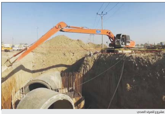
مشروع للصرف الصحي

نظرا للحصول المحافظين على صلاحيات من مجلس الوزراء من اجل الاسعالة المباشرة للمشاريع المهمة، والتي اكد ان تنفيذها سيحسن مستوى الخدمات.