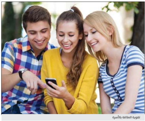
تقوية العلاقة بالأسرة