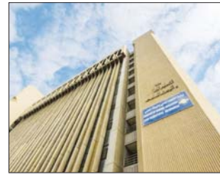
وزارة التعليم العالي

اعلنت وزارة التعليم العالي والبحث العلمي، تعميم التقديم على الجامعات والكليات الأهلية لغاية يوم الخميس المقبل الموافق الـ 14 من الشهر الحالي. واطبع بيان صحفي صادر من بادرة التعليم الأهلي الجامعي في الوزارة وتلقت "الصباح" نسخة منه اسام الاحد، ان الوزارة قررت تعميم موعد التقديم الالكتروني على الكليات والجامعات الأهلية بنا، على موافقة وزير التعليم العالي والبحث العلمي الدكتور عصي السهيل لاسميا بعد اجراء التعديلات الخاصة بتخصيص الحدود الدنيا للقبول. وذكرت الوزارة وفقا للبيان ان قرار تعميم التقديم على استمارة القبول حتى يوم