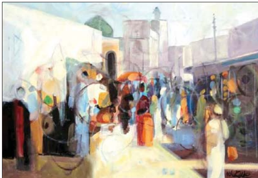
من أعمال الفنان علي رضا

كان هذا في الثمانينيات، وفي رحلة إلى المغرب العربي وبعد أن غادرت المغرب إلى تونس، كان هذفا هم المترجمون لرفد مجلتنا الثقافة الأجنبية بما تحتاج له أعادها. لكنني، رئيس تحريرها، استهوتني تونس أرتد الارتواء من غودتها الليلية على البحر ومذاق المتقنين التونسيين ووضوح القرب من فرنسا والغرب في الثقافة واللباقات.