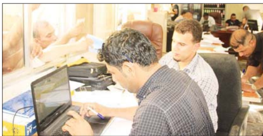
متقدمون على التفتين

ومعاونتا قانونيا ومعاون محاسب وبرمجا وكاتب حسابات. وذكر العطا ان نواتر الصحة في بغداد سوا، الكرخ او الرصافة تواجه إشكالية بالغة في عدم وجود الدرجات الوظيفية الكافية من اجل سد الشواغر، وسوء التوزيع بين اللكاات الطبية والتمريضية بين المركز والاطراف، منبها بان هذا الامر ستأخذها المحافظة بعين الاعتبار عند توزيعها لهذه الدرجات وبالتالي تقدم الوضع الصحي الحالي في المؤسسات الموجودة مجانين من على صعيد نوع صله، بين انه من ضمن قرارات المحافظة الهادفة الى رفع المستوى التربوي في المحافظة وتلافي حالات التراجع الواضح فيها خلال الاعوام الماضية فقد وجه مديريات التربية الست في بغداد للبدء بتسليم معاملات المحاضرين المجانيين من اجل تحويلهم الى عقود والباشرة بمدايرهم. ولفق محافظ بغداد الى انه جرت في وقت لاحق مخاطبة الامانة العامة لجلس الوزراء من اجل استحصاال الوقاات الرسمية بذلك ودرج التخصيصات المالية لهم ضمن موازنة العام المقبل 2020، منوها بان جميع المحاضرين مشمولون بالعمود سواء من التفتين عن العمل اضافة الى من تسلم منحة او لم يتسلمها، وايضا اياهم من مراجعة المديرية من اجل البدء بترويج معاملاتهم.