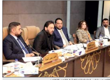
الكعبي يترأس اجتماعاً لمتابعة قانون التقاعد

الكعبي يترأس اجتماعاً لمتابعة قانون التقاعد الكعبي يترأس اجتماعاً لمتابعة قانون التقاعد الكعبي يترأس اجتماعاً لمتابعة قانون التقاعد