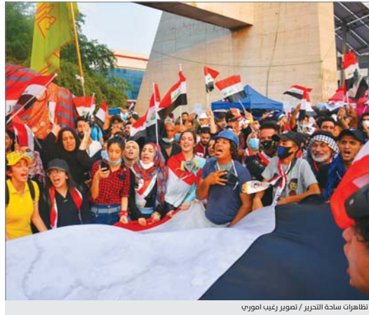
تظاهرات ساحة التحرير

ضغطت الاحتجاجات لإجراء تعديل وزاري بعيدا عن الحاصصة