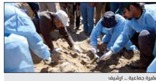
مقبرة جماعية - اربيف