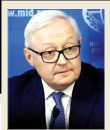
نائب وزير الخارجية الروسي سيرغى ريبكوف

بعد انسحاب ترامب من الاتفاق النووي الذي وقع عام 2015 مع طهران، وفرض عقوبات عليها، ويهددها بوقوع هجوم على إيران، فثارت قلقاً في عدد من دول العالم، إضافة إلى أسقاط طائرة استطلاع أميركية حديثة بمسارح إيران، فوق مضيق هرمز، واحتجاز طائرة حكومية مصرية، جعل طاقمها لبريطانيا نقله نطنز الإيرانية، فالتفت إيران وبحثت سوريا التي بغرض عليها الاتحار النووي، عقوبات، بينما ردت طهران باحتجاز ناقلة نفط بريطانية عند مضيق هرمز، وأعلنت وزارة الخارجية الإيرانية، الأربعاء الماضي، بدء تطبيق المرحلة الرابعة من تقليص الالتزام بموجب الاتفاق النووي، معربة عن آمالها أن تفي بول أوروبا بالتزاماتها الموقعة عليها ضمن الاتفاق.