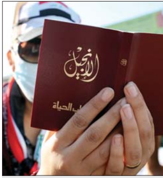
المسيحيون يتناولون العشاء مع الله بالسالم

تعدا بطريرك الكلدان في العراق والعالم الكردميسال لوس روفاتيل ساكو للشمس، مع اجل عودة الحياة الطبيعية للعراق، مطالبا الحكومة والموظفين بالتخلي عن الحكمة وضبط النفس وتغليب الصلحة العامة لحقن الدماء البرية. وقال ساكو في بيان تلقته «الصباح» اننا امام عدد القتلى والجرحى المروع وحساسية الوضع في العراق وضبابية الرؤية، ندعو جميع بنات وبناء الكنيسة للصيام ثلاثة ايام (باعتد بغداد) اعتباراً من صباح الاثنين 11 تشرين الثاني وحتى مساء الأربعاء 13 تشرين الثاني 2019، من اجل السلام وعودة الاستقرار والحياة الطبيعية إلى البلاد. واضاف ساكو اننا وبهذه المناسبة ندعو الحكومة والمتظاهرين إلى التخلي بالحكمة وحضبت النفس وتغليب الصلحة العامة لحقن الدماء البرية، والمحافظة على الممتلكات العامّة والخاصة، مهيباً بالحكومة لاتخاذ موقف شجاع واستثنائي للخروج من الازمة الحالية التي لا سمح الله، قد تقود البلاد نحو المجهول.