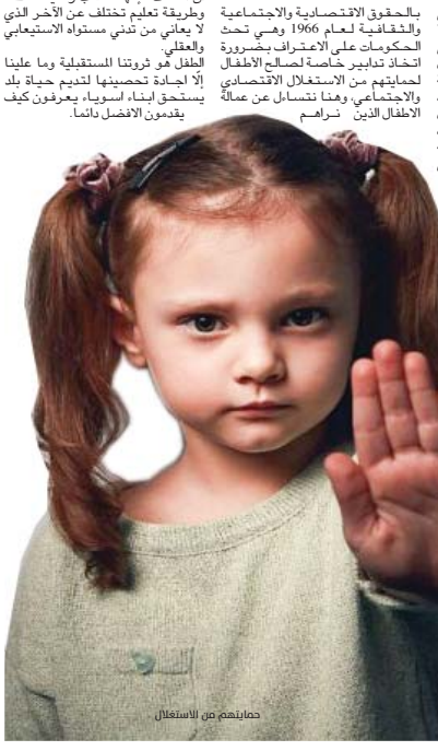
حمايتهم من الاستغلال

إعلان حقوق الطفل لعام 1959 هو نسخة منقحة من إعلان عام 1924، ويتضمن أعتماد الطفل كياناً له حقوقه وواجباته، لكن الواقع يشير إلى أنه مغفوق غالباً ما يتم استغلالها من قبل الكبار الذين لا يؤمنون بأن عليهم احترام الطفل كما يفعلون من الكبار لكونه قيمة إنسانية لا بد لها أن تنمو بغير حال من أية ضغوط نفسية وتربوية. وهناك المعاهدة الدولية الخاص