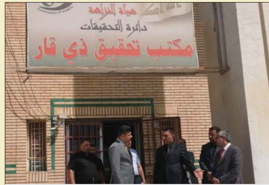
مكتب النزاهة في ذي قار