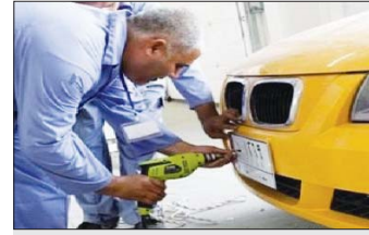
تثبيت لوحات تسجيل

مؤكدا ان التقديم سيكون من خلال موقع الوباء الالكترونية الخاصة بوزارة التعليم العالي الذي لم يضمن لهم التقديم. الخميني المقبل الموافق الـ 14 من الشهر الحالي، جاء من اجل اتاحة الفرصة للطلبة الجامعي. من مدير العلاقات والاعلام في المديرية