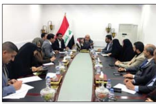
اتصال فريق اللجنة الخدمات - اربيف

مشروع قانون مجلس الاعمار وذكر بيان آخر، ان «اللجنة استعرضت الهمام التي يتولها المجلس من حيث المرافقة على المفارض والتعاقد وفق مبادئ المنافسة والشفافية ووضع الانظمة والقرارات الخطة وتنفيذها والتعاقد مع الشركات داخل العراق وخارجه» واضاف ان «اللجنة ناقشت خلال الاجتماع الذي عقد في مقرها، اهم فقرات القانون في وضع سياسة وطنية للاعمار وحل قضايا فرص العمل وتنمية مهارت العاملين فضلا عن وضع نسبة لا تقل عن 50 بالمئة للعاملين العراقيين» واوضح البيان ان «اللجنة بحثت كيفية نقل وتسليم العاملين من جميع الوزارات إلى مجلس الاعمار، إذ تكون مؤقتة قابلة للإلغاء، من قبل المدير