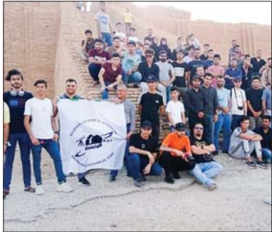
مؤسس النادي في أورو التاريخية