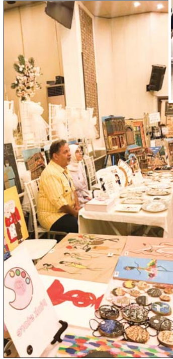
أعمال يدوية تراثية وفوتوكورية