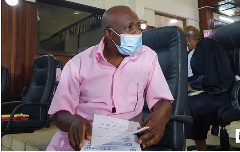
● بول خلال جلسات محاكمته

بول روسيساباغينا، الذي جعلته شجاعته خلال الإيادة الجماعية الرواندية شخصية مشهورة عالمياً وموضوع أحد أفلام هوليوود، أدين في رواندا مؤخرًا بتشكيل جماعة إرهابية وحكم عليه بالسجن 25 سنة.