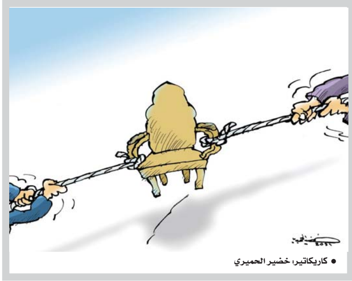
• كاريكاتير: خضير الجميري

كيف نفعل ذلك؟ نتفحّر ما يلي، في الأسبوع خمس وعشرون حصّة دراسية تقسم بالشكل التالي: سبت عشرون حصّة دراسية لدرسي العربية والرياضيات أربع حصص لدرس الإنكليزية والخمس حصص الباقية تقسم بين بقية الدروس، حيث لا يلزم التلميذ في المواد بأكتر من المقدرة على القراءة والكتابة لغوا المنهج، وتكتفي بالتأكد من أن التلاميذ قارروا على قراءة فصول المنهج، إلا وهما القراءة والكتابة. لذا لا بد لنا وللجهات صاحبة القرار أن نبدأ بجدية عالية باتخاذ ما يلزم ويتم تشكيل خلية أزمة لإنقاذ التلاميذ من هذا التراجيح الذي فرضته أوضاع قاهرة هي خارج أروانتنا. السؤال الملح: ماذا علينا أن نفعل؟ وماذا نستطيع أن نفعل؟ قبل أن أضع رأيي للحل، علينا أن نناقش ما الذي يحتاجه التلاميذ لعبور مرحلة الخطر والتدني المعرفي؟ الاجابة تكمن في القراءة والكتابة. فهذان الأساسان هما أولوية الأولويات ولا أولوية قتلها، أما الدروس الأخرى من علوم وأدب واجتماعيات التي تستطيع استثمارها وتطوير عنصرى القراءة والكتابة أيضا.