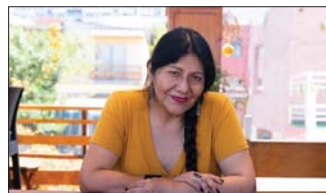
● الخياندرا في صورة لها بعد انتخابها من قبل الشعب