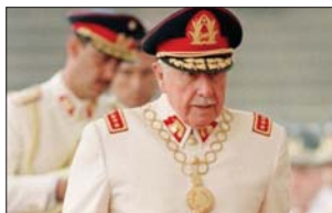
● بينوشيه ترك إرثاً ثقيلًا على الشعب التشيلي

حلم انتخاب أليسا رمزية مهمة، فالدستور الحالي للبلاد لا يعترف رسمياً بالسكان الأصليين، ويمثل التنوع المهشق للتشيل البرلماني جزءاً من جعل هذه العملية تدخل التاريخ.