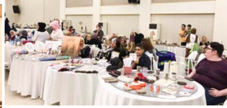
لقطة من البازار

من أجل دعم المشاريع الصغيرة وتسويق المنتجات الحرفية اقيم بازار بصمات عراقية، على أرض قاعة نادي الأطباء وبدعم من نقابة الصيادلة.