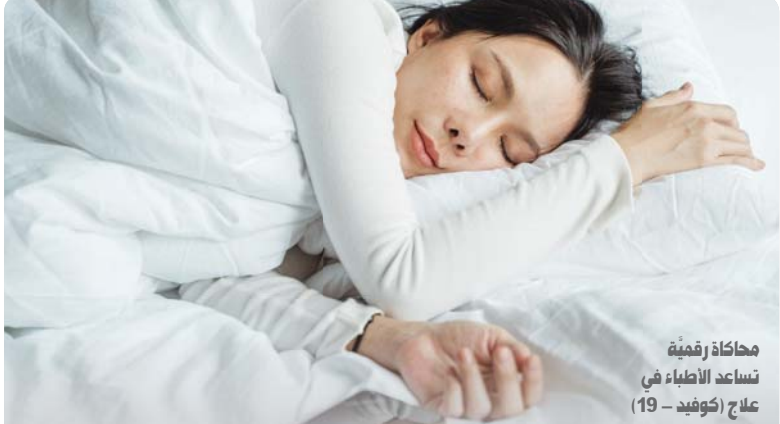
محاكاة رقمية تساعد الأطباء في علاج (كوفيد - 19)