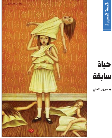
• الواقعية الخيالية لشوروي ماسنوتو

الحوار رمفوق يقوم على علاقة ثنائية بين شخصيات لها ارتباطاً موضوعية البناء، العائلك الدعم بلغ الحوار، والذي هو أساس أعمال ويسلوك مشتركة تبن الأحدث وصفة التجاردين، بطريقة يتم التأكيد من خلالها على الكلمة الرابطة بالوجودات البشرية، والتي تكون حواراً قد يتيح للمتلقي مشاهدته بعيداً عن السمع، وكذلك أنه لا يعتمد على اللغة أو النطق بالكلام بل على إيصال حقيقة بل هي أفعال تؤكّد ان الحوار يتضمن شيء ما، وهذا ما ينسحب على الحوار المسرحي الذي يجب أن يكون مختلفاً عن سواه، وذلك لأنه لا يعتمد على الكلام فقط، وإنما والموسيقي والنن والإضاءة والحركة، وهذا ما يؤكد البناء، المستر في إنتاج أفعال العرض المسرحي، على اعتبار أن للمسرح قيمة حيالية تعتمد على القيمة الفكرية التي تطرح الاستئلاء، وايضا على حوار الممثل، والقيمة الفلسفية التي ترتكز على محرك الصراع في الحوار بطريقة مختلفة، وذلك ما له أن اشغالات ذهنية تلامس العقل والعاطفة، وهذا ما تجسد بمسرحية (في انتظار غودو) لاصموذيل بيكيت، التي استمر فيها الحوار أو أحداث «الانتظار» الجملة لبعض الفصول والاستئلاء الغريبية، ليأتي مع قرب تمام المشهد الأول الموسي معايداً بأنه لن يات اليوم، لكنه غاب بالتاكيد، يميز الحوار هنا بوجود اللغة التي يثق بمعانيها كوسيلة من وسائل الاتصال المتعارف عليها، بل هي تعبر عن جوهر التجربة، حتى وان كانت في بعض الأحيان