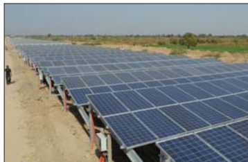
● ألواح طاقة شمسية

المنصف كما يعمل على تقليل نسب الانبعاث. إذ تقدر نسب التلوث في بغداد بأضعاف المسمب الطبيعية. والرأس إلى أن الأمل لا بُد من أعمال بالانجازات التي تدعم عملية التنمية الحقيقية بإستثمار القناتات المتطورة التي تعتمد في الاقتصادات العالمية المتطورة.