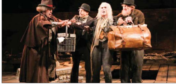
• مشهد من مسرحية في انتظار غودو لسموثيل بيكيت

أرى أن لغة الجسد أو لغة الفعل ليست بالغة المرئية، بل هي كلمات تجعل نتيجي بعد فهم كامل يستخرجها المحرر كما نستخدم الكلمات في كل ما نتكلم به عن تباديل معناه، وبالتالي يفعل الحوار عبر تباديل الكلام أو الانبعاث إليه، رغم أن الكلام هذه اللحل مفتوحة صراخاً سردية درامية، قد لا يمكن توحيدها بأعلى الحوارات اللغوية المتصلة بين الشخصيات المتحداه، وتتميز غابها تعزيز التسلسل الدرامية، وتتميز مشاعر وعواطف المتلقي.