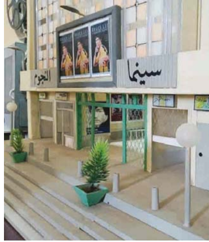
احد المجسمات المعروضة

بحضور نخبة من الفنانين والإعلاميين، افتتح معرض النماذج المصغرة والمجسمات للفنان محمد ابي رشا في قاعة الفن الحضاري في التشيلة صباح امس الاول الجمعة، والذي سيستمر لايام عدة.