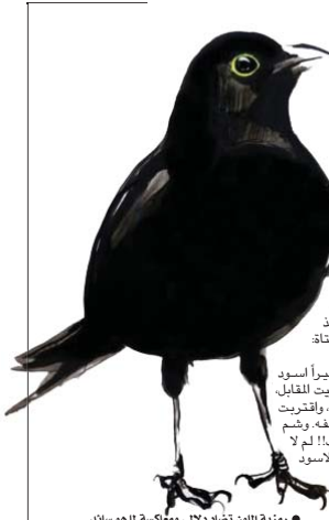
• رمزية اللون تشد دلالي ومعكسة لما هو سائد

سألتها، اين قرأت لثلة؟ اقترحت منه، وانكأت على النافذة بجانبه، انه انبه ان هنا قد ارتدت ثيابها، وبغرت لون الاحمر على شفعتها.