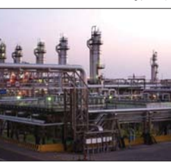
● صناعات نفطية

تغطي نقص الطلب على الفحم الحجري، وكذلك تسبب في تلبية حاجة نمو الطلب الصيني السنوي الناتج عن زيادة السكان سنوياً، فضلاً عن تحسن مستوى اليعتمات والتطور العلمي. وبين أن أهمية النفط الخام من زيادة استهلاكه في صناعة البتروكيماويات بدلاً من الغاز، كما أن الشركات النفطية العالمية معقدة جداً ومتكاملة وتسهم في توظيف ملايين الناس كذلك تلك موجبات قيمها آلاف المليارات دولار من السهولة أن تنهي أو تلغي صناعة مهمة تتجاوز عمرها 100 عاماً.