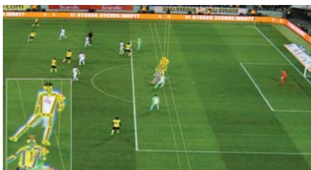
إيهاب يقتدر لتقويم لفعاليّة التسلّل في كأس العالم

تصف الآلي مستخدم في نهائيات مونديال قطر بين 21 تشرين الثاني و18 كانون الأول، للتقويم قبل اتخاذ قرار نهائي.