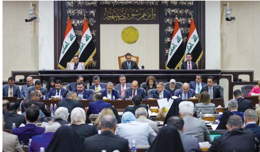
● حل البرلمان يمكن بطلب من ثلث أعضائه

فقط ثم انسحب تاركاً لنا تضمين الثانية، فإذا عرفنا أنه كان في معرض توجيه الاتهامات، وكان المثل الظالم صدام، انسحب الذهن تلقائياً إلى متهين آخرين أراد أن يوحى بهم من دون أن يستهيم.