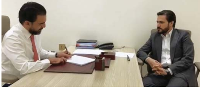
رئيس البرلمان يوافق على استقالة نواب الكتلة الصدرية