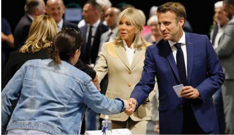
بعد شهر ونصف من إعادة انتخاب إيمانويل ماكرون، عاد الناخبون الفرنسيون إلى صناديق الاقتراع. أمس الأحد، في دورة أولى من انتخابات تشريعية يراهن فيها الرئيس على أغلبية البرلمانية في مواجهة يسار متجدد، وأبعد من ذلك، على قدرته على إصلاح البلاد. وفتحت مراكز الاقتراع أبوابها في فرنسا عند الساعة الثامنة (06:00 ت.ع.) وستنتهي التصويت عند الساعة 16:00 ت.ع باستثناء المدن الكبرى بما فيها العاصمة باريس إذ تم تمديد الاقتراع حتى الساعة 18:00 ت.ع التي يتوقع أن تصدر التقديرات الأولية لنتائج التصويت عندها.

✳️ جمهورية الصين الشعبية لدى جمهورية العراق