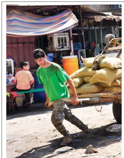
● ترك الدراسة من أجل العمل وإعالة الأسرة

الاحضر لون هذا الموسم من دون مناض، حيث يترجم على عرش الموضة سواء بالملايس او مختلف الكسورات التي تكتمل بها الأناقة، اذ يعتبر من الألوان التي تحمل تدرجات كثيرة منها الفاتح ومنها الداكن، ومنها الفلوي الجري، في كل أحواله هو سيحة لافتة لهذا الموسم من ربيع وصيف 2022. إن تسيق الحقيبة الخضراء أمر سهل، فهو لون يليق بسائر الألوان الأساسية منها والمتضاربة، حيث بات تسيق الألوان المتضاربة مع بعضها البعض سيحة معتمدة ومميّزة. كما أن الحقيبة الخضراء تمنحك لوكاً حيوياً أنيقاً ومميّزاً، وتسيق الحقيبة الصغيرة بالأخضر الفلوي يمنحك إطلالة جريئة وقوية لافتة تناسب إطلالات الصيف الحقيبة الصغيرة هي حقيبة ستايلش، تزين الإطلالة وتضفي رونقاً مميّزاً على اللوك بالمجمل كما تعتبر الحقيبة الكبيرة من الحقائق العمليّة والتي تناسب الإطلالات اليومية، المريحة الحقيبة الخضراء الكبيرة هي سيحة لافتة لهذا الموسم، حيث تمنحك إطلالة مميّزة، شيكاً وحيوية، كما أن تسيقها سهل من ألوان أساسية كالأبيض والأسود، أو ألوان متضاربة، لتحصلين على لوك عصري على الموضة.