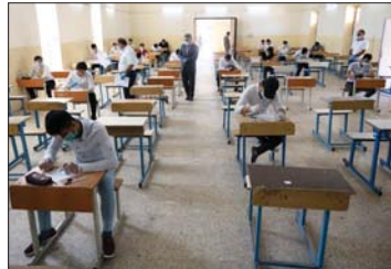
● اعادة امتحانية

خلية الازرية المتضمنة ارتداء القفازات والقمائم والتعقيم من قبل إدارة المركز الامتحاني.