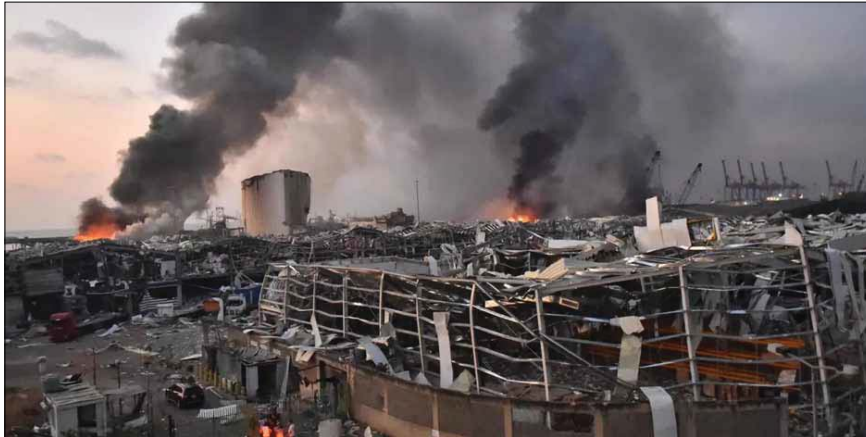
● تفجير مرقا بيروت

طلبت النيابة العامة التمييزية في لبنان إيداعها الموقوفين بانفجار بيروت لإحالتهم إلى القضاء العسكري لحين تعيين محقق عدلي، وأعطت النيابة أمس الثلاثاء، التعليمات اللازمة لإيداعها الموقوفين على أن تتم إحالتهم إلى قاضي التحقيق العسكري الأول لإصدار مذكرات توقيف، بانتظار تعيين محقق عدلي يضع يده على الملف، على أن يتابع من قبل النيابة العامة التمييزية التحقيق الأولي مع باقي الأشخاص المشتبه بهم والشهود، وإحالة الأوراق تباعا إلى المحقق العدلي.