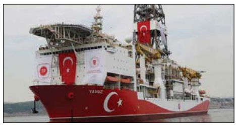
● تركيا تلعب في مياه شرق البحر المتوسط