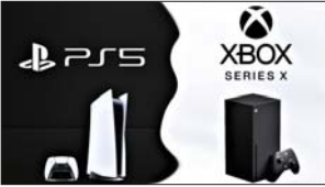
نيويورك / وكالات

إكس ريس S (Xbox Series S) هو ثاني أجهزة إكس بوكس (Xbox) من الجيل التالي الأحدث من مايكروسوفت، والذي يطلق عليه اسم (Lockhart). وسلط مستند مايكروسوفت، الذي تم نشره مرة أخرى في شهر حزيران/يونيو من الشهر الماضي، الضوء على خطط الشركة لصنع الجيل التالي من الجيل التالي (Xbox Series X devKit) جهاز مايكروسوفت الذي يحمل الاسم الرمزي (Dante)، لطوري الألعاب بتسكين وضع (Lockhart) خاص بحدي على ملف تعريف للآباء الذي تريد مايكروسوفت تحقيقه باستخدام وحدة التحكم الثانية هذه ومن المتوقع أن تشمل وحدة التحكم (Lockhart) على 7.5 جيجابايت من ذاكرة الوصول العشوائي والبطارية للاستخدام، ونحو 4 تيرافلوب من أداء وحدة معالجة وحدة التحكم المركزية نفسها الموجهة في الشهر الماضي عبر الإنترنت ذراع التحكم (Xbox Series X)، وشعاع إن مايكروسوفت ستكشف النقاب عن المنصة الجديدة (Xbox Series S) في وقت ما في شهر أيار. من المحتمل أن تلعب هذه النصة دوراً كبيراً بالنسبة لخطط الاشتراك (Xbox All Access) الخاصة بشركة التي تضم وحدة التحكم (Xbox Live) و (Xbox Game Pass Ultimate) موالٍ رسوم شهرية.