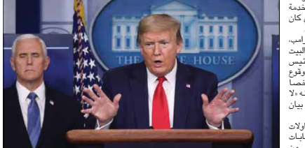
● المؤتمر الصحفي لترامب

اضطر الرئيس الأميركي دونالد ترامب إلى قطع مؤتمره الصحفي للطاق ومن ثم العودة مجدداً لإكمال عمله عقب تلقيه عبر أحد عناصر الخدمة السرية بحادث إطلاق نار أمام البيت الأبيض، ونشر مستخدمو مواقع التواصل الاجتماعي مقاطع فيديو وثقت لحظة السيطرة على شخص من قبل الخدمة السرية للبيت الأبيض، في الوقت الذي كان فيه ترامب يتحدث في مؤتمر صحفي، وأصطحب أفراد من الخدمة السرية، ترامب إلى خارج غرفة الإحاطة اليومية بالبيت الأبيض فجأة، وبعد دقائق عاد الرئيس الأميركي لقاعة الصحافة وأشار إلى وقوع إطلاق نار قرب البيت الأبيض وأن شخصاً أصيب في الحادث، وأصبح ترامب أنه لا يشعر بالقلق من الواقعة وأنه سيصدر بيان بخصوص ما حدث. وقال ترامب خلال المؤتمر: إن «الحالات الأكثر خطورة وللتأثير في الانتخابات الرئاسية في الولايات المتحدة لا تأتي من روسيا بل من داخلها»، وأضاف،