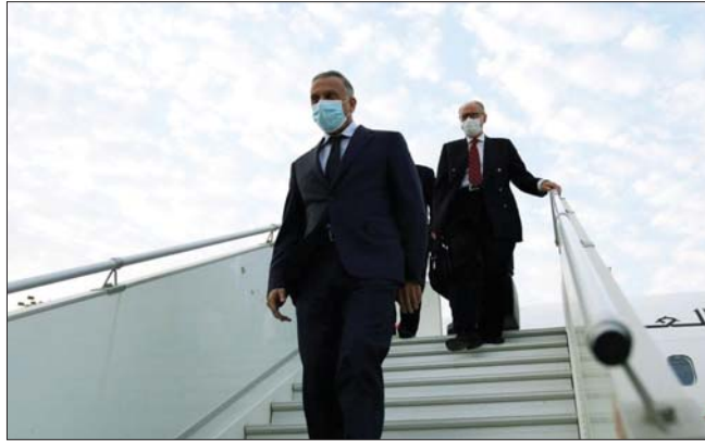
● تطلعات سياسية للتراجع مصفرة خلال زيارة الكاظمي لواشنطن

الأميركي واحترام سيادة العراق وإبعاده عن الصراعات.