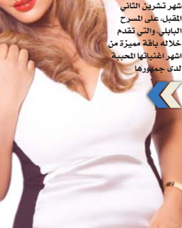
بغداد، رشاد عباس

تختتم النجمة العراقية شذى حسون، فعاليات حفلات مهرجان بايل الدولي، بحفل غنائي يوم الاثنين الموافق 1 من شهر تشرين الثاني، المقبل على المسرح البابلي، والتي تقدم خلاله باقة مميزة من اشهر اغانيها الجميلة لدى جمهورها