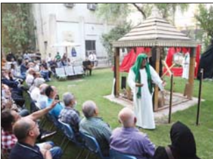
جانب من المسرحية

بنسقا الاقتراضي الخاص بواقع الطف، وإبعاده الروحية المقدسة والمسؤولية القنترية بمواقف بطولية وفكرية تميز الصالح من الطالح بدلالة تعبيرية تواصلية مع الجمهور. أما عميد الكلية، مضاد الاسدي فأشار الى أن عرض المسرحية بهذا التوقيت كان مقصوداً، كونه يمثل مسك الختام وبين في النهاية الأمام الحسين (ع) يعيون الأكاديميين وهو يمثل الحق والجمال والضمير الحي الذي يقودنا الى أن نتقدي به ونقدم أعمالنا. وأضاف: «العرض خرج من القاعات المغلقة التي الحدائق في الهواء الطلق، كجزية مغفرة من جهة، ولتجنب تنفسي فيروس كورونا من جهة اخرى».