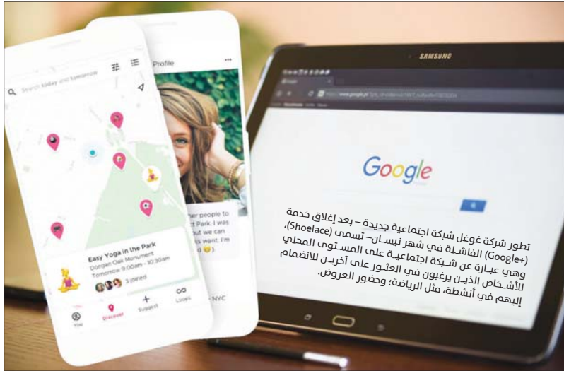
تطور شركة غوغل شبكة اجتماعية جديدة - بعد إغلاق خدمة (Shoelace) الفاشلة في شهر نيسان- تسمى (Shoelace) وهي عبارة عن شبكة اجتماعية على المستوى المحلي للأشخاص الذين يرغبون في العثور على آخرين للانضمام إليهم في أنشطة، مثل الرياضة، وضور العروض.

تعليقات المستخدمين. وتغير الشركة أيضاً الطريقة التي يمكن من خلالها الوصول إلى أرباح التطبيق من خلالها، وأوضحت المجموعة العملاقة أن خبراء لغات يستمعون إلى تسجيلات مستخدمي خدمة المساعدة الصوتية بغيّة تحسين فهمها للغات والكتابات المختلفة. وهو عمل ضروري لاستحداث منتجات مثل (اسبيكست غوغل). وكشفت وسيلة الإعلام البلجيكية في آر تي أنه تستغل لها الاستماع إلى أكثر من ألف تسجيل مأخوذ من أجهزة في بلجيكا وهولندا، نحو 153 منها مسجل عن طريق الخطأ. وتشمل تلك التسجيلات محادثات بين مستخدمين عن حياتهم العاطفية أو أولادهم، والبعض منهم يقدم معلومات شخصية، مثل عناوينهم. وكشفت غوغل عن أنها تحقّق في كيفية تسريب هذه التسجيلات من جانب موظف كمثال، وبالمساعدة المعلن بها في مجال أمن المعلومات، مشيرة إلى تحقيق شامل في هذا الخصوص أطلق لغائي تكرر هذه الحالة. وأوضحت أن موظفيها ليس في وسعهم النفاذ إلا إلى 0.2% من التسجيلات وأن هذه الأخيرة ليست مرتبطة بحسابات المستخدمين. وعادة تفلّح خدمة المساعدة الصوتية من «غوغل» عندما يتوكّل عليها المستخدم، وأقرت المجموعة بأن هذا التطبيق قد يسجل عن طريق الخطأ، عندما يرصد تعابير في الخلفية قد يستخدمها كلمات مفتاح.