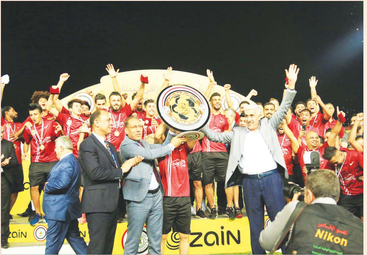
الشرطة يتوج رسمياً بلقب دوري الكرة الممتاز