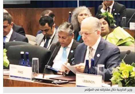
وزير الخارجية خلال مشاركته في المؤتمر

* رئيس وزراء إقليم كردستان تلقى من صحيفة (واشنطن بوست) الأمريكية 2019/ 7/ 17