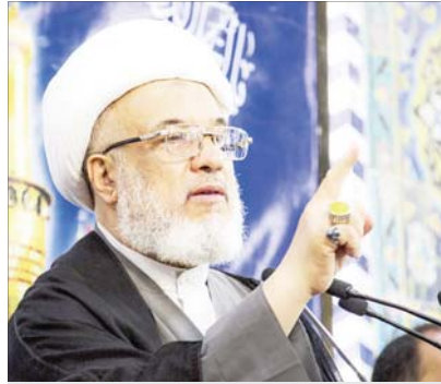
الشيخ عبد المهدي الكربلائي

وتابع الكربلائي: إن "هذا الانخفاض له انعكاسات نفسية سلبية على الطلبة وإرباب الامور والكوادر التعليمية ومؤسسات الدولة وعلى الوضع النفسي العام في البلد لأنه يولد حالة من الاحباط النفسي وضعف الثقة بالنفس والقدرة التعليمية والتربوية في العراق على النهوض بهذا الجيل والتربوي الاقليمي والدولي، وكذلك يؤثر في مستوى العراق حضارياً وفي مجالات وإشراق الى ان هذه الحالة النفسية التي