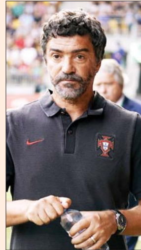
مدرب البحرين فيليو سوزا