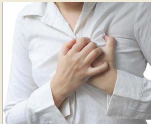
ارتفاع الكالسيوم يؤثر في القلب