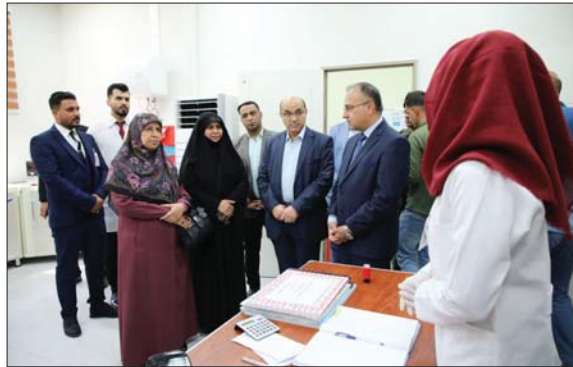
مركز النهروان الصحي