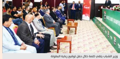
وزير الشباب يشرح كلمة خلال توقيع عقد رعاية البطولة