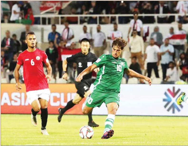
صيني، يسعى للتألق في التصفيات المشتركة

لغاية 2015 وإيران على رأس حربة وخلفه محطة مع سرعة التحولات من وسط الميدان