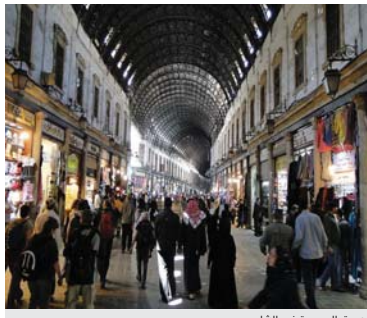
سوق الحميدية في الشام

حيوا الشام . بكل ستاتها . ورجالها الشجعان . الماترير عزابهم . ولانتكسر عصتهم . حي الله ايراهيم . الحرا ( يوسف ) و ( من ) عدنان . هاي الشام . هاي ام حضان دافي . هاي اول اتراب اندرفي ( هابيل ) . وياصخرة الوادي الكهد اكير هام . اول ياسمينه اترعت اهيل الكون . ومفنه الجوري خضر صار ورد الشام . ( قاسيون ) . يا اجمل جبل حبيبه يوم الضيح . قاسيون عينه امفحه ومفاح . ويا اجمل قصيدة انكالت امن اتران . وصارت للشعر وله نيع الهام . ويا عذب نهر مابه زال اجنان . صافي والبشرية ما اظن ليضام . باردا ( بردي ) ايطفي ليهيب الكف . وياخذ الجمر من تيب منه انسام . هاي المرزه ( والمرجه ) وهذا السوك . الي ( برداش ) بنده : ياها بكرام . ( تكرم عينك ) انفضل تعال وشوف . هاي الحميدية . البهيه خاص وعام . وهذا ( الجامع ) وموضع ( الراس ) اشكك ( رقيه ) الرقيه . اشويه امشي ليجام . هذي الشام حيوا الشام .!