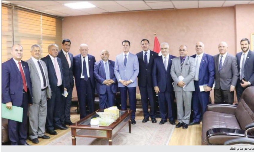
جانب من ختام اللقاء

تكريس وتبادل الثقة بعدما توثقت جملة من المسائل منها تكريس وتبادل الثقة بين القطاع العام والخاص من خلال التثقيف والتعاون المشترك، وتمكين القطاع الخاص من رسم سياسة واضحة للقطاع الخاص من ذوي الخبرات للعمل في القطاع الأفضل. كما جرى بحث موضوع تأهيل الخريجين لدخول سوق العمل من خلال زجهم في دورات تدريبية ليصبحوا مهنيين للعمل في القطاع الخاص، التي جابت دراسة إبتكارية تحوّل بعض موظفي القطاع العام من ذوي الخبرة للعمل في القطاع الخاص. وقد انعقدت جلسة العمل على هذه المقترحات باسكافية بحضور وفد من مجلس الوزراء العراقي والقطاع الخاص من قبله، على إجازات أعدد 4 سنوات من القطاع العام ليعملوا في القطاع الخاص شريطة أن يعملوا بعد إلتحاقهم إلى القطاع لدى الجهة ذاتها التي عملوا معها أثناء إجازة الأربع سنوات.