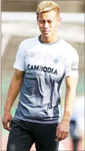
مدرب كمبوديا هوندا

من الأمور اللوجيستية التي يجب ان نأخذها بنظر الاعتبار هي التخطيط الصحيح للمباريات ليسما القارات التي تقام خلال خمسة أيام وما يترتب عليه من اجهاد وإعياء، فمثلا سيجوز منتخبنا ذاتي ومواجهته أمام هونغ كونغ في الصمرة وبعدها بخمسة أيام سيلعب ضد كمبوديا أي الخامس عشر من تشرين الأول وأنا ما الخامسة مسار الرحلة التي سيكُون من