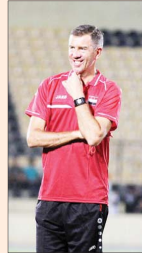
هل بنج كاتانتشيس بقيادة الأسود بلوغ الموندبارل