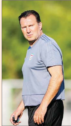
مدرب ايران الجديد مارك فيلموتس