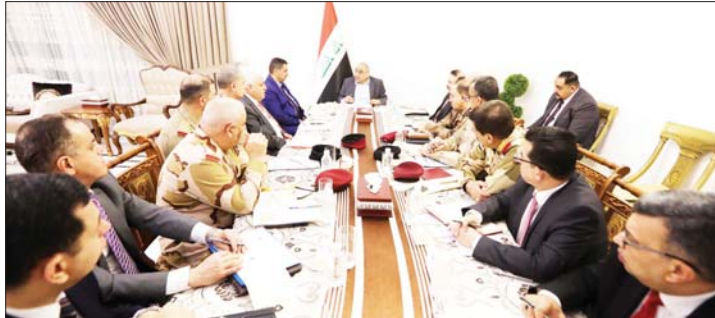
عبد المهدي خلال رؤس اجتماع مجلس الأمن الوطني

في أعقابها، وإن هذه الجريمة لا يمكن أن تؤثر العلاقات الأخوية والعميقة بين البلدين والشعبين العراقيين، سيؤدي إلى أن الأجهزة الأمنية تواصل تحقيقها وموازنة على الوصول إلى الجرمين وتقديمهم للقضاء، ليتألبوا جازمهم المعلن. من جهة "أخبار الرئيس التركي بموقف الحكومة العراقية ومتابعتها لحوادث الاعتداء، من أجل الكشف عن تفاصيل الاعتداء الإرهابي وحماية الفاعلين". مؤكداً أن "الأرهاب لن ينجح في تحقيق أهدافه وإن البلدين مستمران بالتعاون ضد الإرهاب إلى جانب الحرس على تطوير العلاقات الثنائية في جميع المجالات". إلى ذلك أصدرت حكومة إقليم كردستان الخميس، بياناً بشأن حادثة الهجوم على موظفي القنصلية التركية في أربيل، مؤكداً أن الحادثة كان عملاً "إرهابياً مذبذباً ومقصوداً". وأضافت حكومة إقليم كردستان "إننا نؤكد للرأي العام أن الجهات المعنية حققت تقدماً في تحقيقها بالباطم، نود التأكيد أيضاً على أن الجهات ذات الصلة، ما زالت متواصلة في التحقيق، كما سنحيط الجميع علماً بمراحله تبعاً". في السياق نفسه، كشف مصدر أمني، أمس الأول الخميس، عن هوية منفذ الهجوم على الدبلوماسيين الأتراك في أربيل، وقال المصدر في حديث صحفي، إن "إسبائش أربيل دعمت المواطنين الذين يمتلكون معلومات عن المنفذ (مطلوب باج) خلال 1992 كبرى من أربيل، وذلك تعازيه للشعب التركي طيب أردوغان، عن "خالص تعازيه للشعب التركي للاعتداء، على القنصلية التركية في أربيل". معبراً عن "حزنه العميق وسروراته لعائلة معاون القنصل التركي وصحبايا الحادث الأجراسي". وأكد عبد المهدي محسب بيان مكتبته "اعتزاز العراق بالاحلاقات العراقية التركية والحرس على حماية أمن البعثات الدبلوماسية العاملة في العراق ورفض