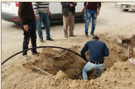
عملية اصلاح كابل فوني

وإذ إن القلع الذي حدث في أحد أجزاء الكابل الضوئي يؤثر في تجهيز ونقل ساعات الانترنت مما يضرر الخدمة في بقية المحافظات الأمر الذي جعل المديرية في نينوى أن تعمل على إصلاحه بشكل سريع لتلافي حدوث خلل في الخدمة ومن أجل استمرارها للمؤسسات الحكومية في المحافظة وعدم تأثر عملها بهذه القطوعات خاصة الدوائر الخدمية مثل الجوازات والمرور مما يعجز عن سهولة وسرعة من دون عناء المواطنين لأكمال معاملاتهم فيها. وتابع البستاني أن الوزارة مستمرة بإجراء إصلاحات لصيانة القطوعات في الكوابل الضوئية لإسبوعاً أن الوزارة قامت بإطلاق حملة كبيرة لصيانة الكوابل الضوئية في المناطق