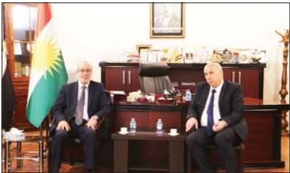
حداد يلتقي محافظ أربيل

بين بغداد وأربيل. كما التقى حداد، محافظ أربيل نوزاد هادي ومند، والمسؤول في المحافظة، وأعاد بيان مكتبته، بأنه "جرت خلال اللقاء، مناقشة واقع المحافظة وبحث المشاكل والعقبات والحاجات الأساسية، وسبل تقديم أفضل الخدمات للمواطنين وإطلاق التخصصات اللازمة في ميادين تنمية الإقليم من أجل إكمال المشاريع المتأخرة، موضحاً أن المرحلة المقبلة هي مرحلة البناء والإعمار والأزهار والاستقرار الأمان". حداد أشار في سياق الحديث إلى "ضرورة التنسيق والتعاون المستمر بين محافظات الإقليم ومحافظات الوسط والجنوب، وبينها وبين مجلس النواب في المسائل التي تخص الحكومة الاتحادية". من جهة أخرى قدم حداد التهنئة والتبركات للمحافظ بمناسبة توديع "عقد تراثية وشراكة عمل" من محافظة أربيل والعاصمة الفرنسية باريس. تضمن اللقاء، مناقشة الأوضاع الراعية في مجالات عديدة على الصعيد الحكومي والاقتصادي والتشريحي وحماية البيئة