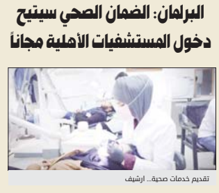
تقديم خدمات صحية.