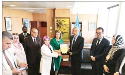
الوفد العراقي خلال زيارته الى اليونسكو

وعقد وفد لجنة المساعدة العراقية - الفرنسية الثقافية برئاسة النائب الإقليمي، وبحضور اعضائها أسس الأول اجتماعاً مع السيدات برنان كارو رئيس اللجنة النظرية في مجلس الشيوخ الفرنسي بمشاركة عدد من رؤساء الشراكات الفرنسية وممثلين عن الحضارة والكتابة الفرنسية. وبدكرت النائب الطالباني في كلمة لها خلال