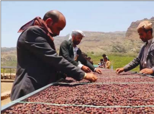
● مزارع القهوة في اليمن