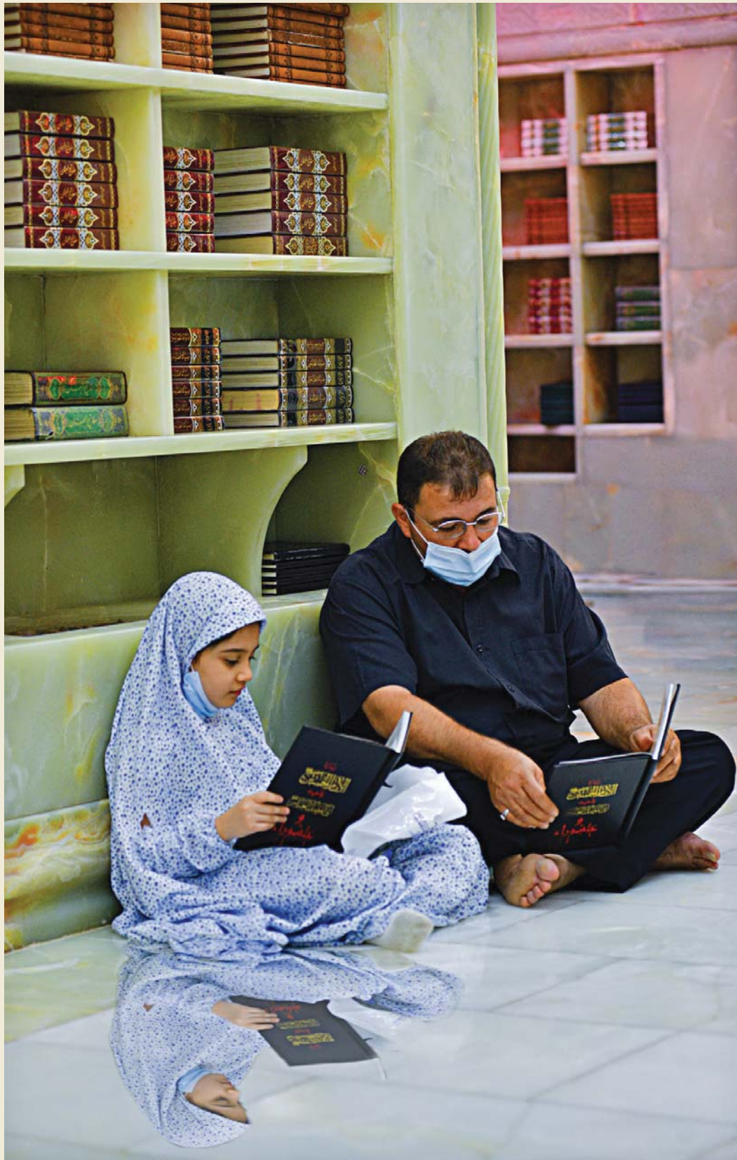
موقع العتبة الحسينية