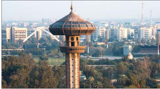
● برج بغداد..