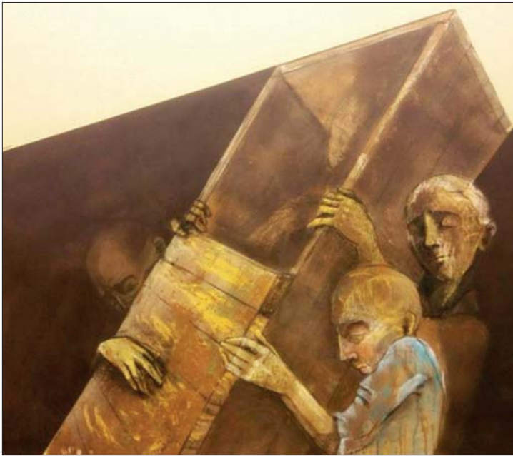
من أعمال الفنان سمير المصدي

يبدو أن أكثر الناس لهم ميل لأفكار الماضي. هي لا تشارفهم وقد اتقلوا من زمن زمن، واختلفت الثقافات وتغيرت ظروف العمل وظروف العيش. حال لا يسهل تفسيرها ولا مجال للتسرع في تحديد السبب.