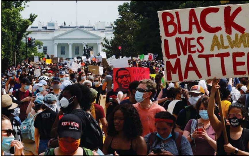
• احتجاجات ضد العنصرية

دهست سيارة مجموعة من المتظاهرين المناهضين للعنصرية في نيويورك مساء أمس الأول الخميس، ما أدى إلى إصابة ثلاثة أشخاص. ويومجبت التقارير عن الحادث، فقد تجمع مئات الأشخاص في ساحة "تايمز سكوير" بمنطقة مانهاتن بنيويورك مطالبين بالعدالة العرقية على خلفية الكشوف عن مقتل رجل من ذوي البشرة السوداء على يد الشرطة في مدينة وتشيستر في وقت سابق.