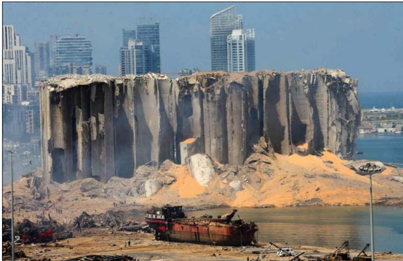
● مرفأ بيروت