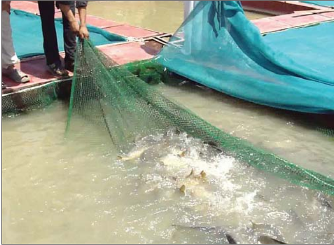
● تربية الاسماك

ويجد النفايف التاكيد على ان الموزارة على استعداد للتصدير عند الطلب وان نفوق الاسماك لا يؤثر كثيرا في المخزون السمكي لدينا لانه تعادله الى الاجيا، اللبية الاخرى في الهور كالجماموس والطيور.