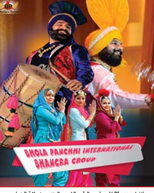
بهاغرا Bhāgra لموسيقى والرثس الشعبي الهندي من ولاية البنجاب. (سفارة الهند في بغداد بالتعاون مع المجلس الهندي للعلاقات الثقافية ICCR)

في عام ٢٠٢٠ كان من أكبر المزارعين مع الهند الولايات المتحدة، الصين، الإمارات العربية المتحدة، المملكة العربية السعودية، روسيا، ألمانيا، هونغ كونغ، أندونيسا، كوريا الجنوبية والبرازيل، والهند اتفاقيات تجارة حرة مع دول كثيرة باعتبارها دولة صناعية متقدمة ذات باع كبير في التجارة الدولية. الهند بلد صناعي كبير للعديد من الصناعات منها صناعة المنسوجات والاصالات والنظ والسيارات وقطاع التعدين، وتعتبر الهند أكبر منتج للفحم المستعمل ثاني أكبر منتج الحديد الصلب وثالث أكبر منتج الكبريت، كما انها أكبر مُصنِّع في العالم للاوديوي و طابع الصلابة اكر من ٢٥٠ من الطب العالمية. كما ان الهند نشاط في سينايا حيث إنتاج في صناعة الآلات (بايود، جين و سنج) يحقق إيرادات تصل إلى (٣) ثلاثة مليار دولار بالسنه.