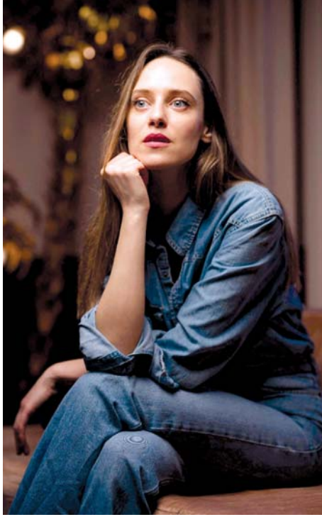
المغنية اليزا كريداتي أثناء جلسة تصوير في باريس استعداداً لإطلاق أغنيته الجديدة «لوحة معاصرة» وكانت المغنية اليزا قد دخلت مشهد البوب الفرنسي بشكل ملحوظ وحقق نجاحاً واسعاً.

وليد حيوش يشكل العامل الجمال لكافة الانحدار القومي والبيانات التي تخلفها موجة الأسف، فهو يحمل رسالة أخلاقية وفنية في الفن والإعلام، وترفع عن العزف خلف مغنين من الدرجة الثالثة في الملاهي الليلية، وراح ينشر الهبة في نفوس المستمعين ويعمل على تنمية الذوق الفل الفل، ملتصقاً بترتة الوغن، على الرغم من هجرة الكثير من قارائه، وأبانه، قويمته، ليكون أومانياً لتحتذي الإنساني بواجبه قدره والحوارة الجادة والمثمرة لتغييره بكل ما أوتي من ثقافة وخبرة في الحياة.