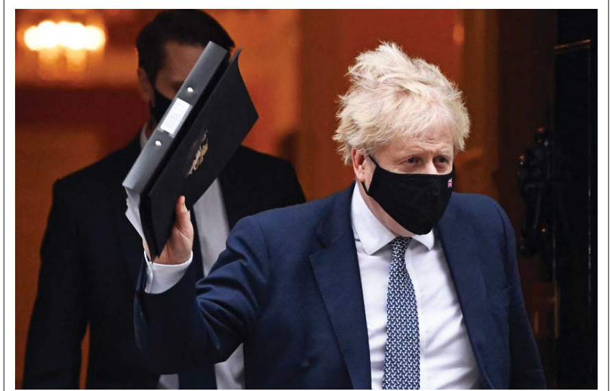
يحتزم رئيس الوزراء البريطاني بوريس جونسون أن يتعاون بالكامل مع تحقيق الشرطة الذي فتح في قضية تنظيم حفلات عدة في داويناغ ستريت خلال فترات الإغلاق. وقال ناظم باسم جونسون لصحافيين أمس الثلاثاء: إن رئيس الوزراء «سيتعاون بالكامل، مهما كانت الطريقة التي يسيلب فيها ذلك».

أعلن رئيس مجلس السيادة السوداني عبد الفتاح البرهان، التزامه وعمقه لعمق حوار سوداني شامل للخروج بالبلاد من الأزمة التي تمر بها، وأوضح البرهان خلال لقائه بمبعوث منظمة التعاون الاقتصادي والتنمية في الخرطوم، أن عملية الحوار تشمل القوى السياسية والمنظمات المجتمعية، عبدا المؤتمر الوطني، بينما قال المبعوث البريطاني إنه قدم خلال اللقاء تويراً شاملاً حول مخزجات مؤتمر أصدقاء السودان الذي عُقد في العاصمة السودوية الرياض.