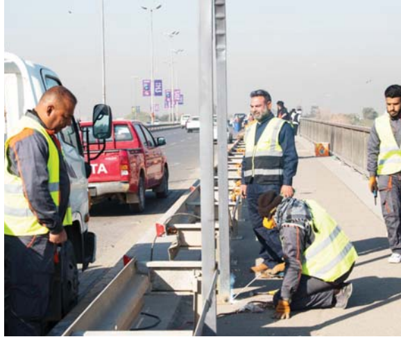
● صباح إشناني وقائي لحماية البنك المركزي الجديد بطول 2600 متر على جانبي جسر الجادرية تصوير على الفريابي