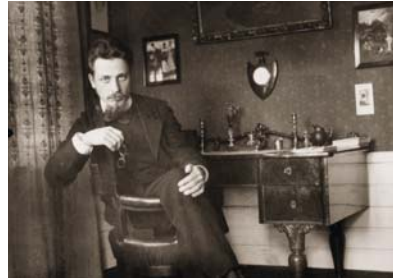
● ريلكه، أوراق مبشرة

السؤال الذي يطرح نفسه، ماذا يصنعون بكل هذه الوجوه العديدة؟ إنهم يحفظون بها، يرثونها أطفالهم الذين يرتدونها، قد يحدث