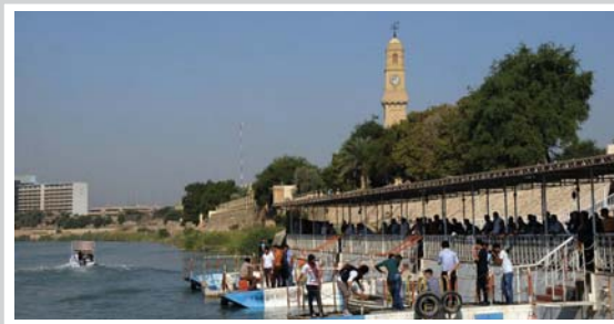
صورة وتعليق القشلة تحففي بزوارق دجلة بعدها الصباح