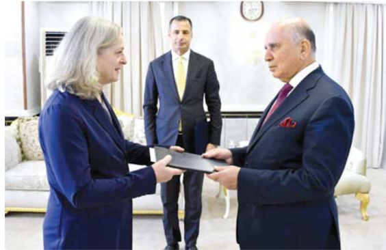
• وزير الخارجية يتسلم أوراق السفارة الأميركية الجديدة

وأشار حسين، بحسب البيان إلى مستجدات الأوضاع في العراق، ومنها الوضع الأمني، موضحاً أن الوضع الأمني في العراق في تحسن مقارنة بالماضي، لافتاً إلى أن الحكومة تبذل جهوداً كبيرة لعودة ما يقف من الناظرين، وتهيئة بيئة آمنة لعودتهم إلى مناطق سكنهم. وتابع، أن الطرفين ناقشا أيضاً عدداً من القضايا الدولية والإقليمية، والمفاتيح ذات الاهتمام المشترك وفي مقدمتها