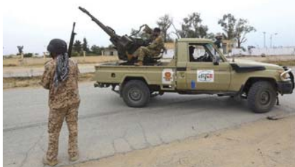
● قوات الحكومة المدعومة من الأمم المتحدة في طرابلس

يؤسس الاتفاق آلية وطنية شفافة ستوجه الإيرادات من البنك المركزي لتمويل أولويات داخلية، مثل الرواتب والإعانات وإعادة الاستثمار في البنية التحتية لقطاع النفط