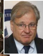
● السفير الأمريكي في ليبيا ريتشارد فورلاند