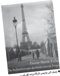
● وصل إلى باريس تاركاً وراءه كل شيء

ويلكه، الشاعر النمساوي الكبير، كتب رواية وحيدة وغريبة إلى حد ما، ضمت واحدا وسبعين نصاً سردياً. أو كما قال ريلكه عنها (أوراق مبشرة). رغم ذلك تعد أولى الأعمال الأدبية الألمانية في سياق «الكتابة الإبداعية». بالفعل، النصوص تبدو غير متجانسة، لكن خطوط «مالته» الذي نُرِّح إلى باريس في بداية القرن العشرين، باحثاً عن مناخ جديد لأعماله الأدبية، وجد ضالته بين الكتب في المكتبة الوطنية، بين الحنين والعزلة.