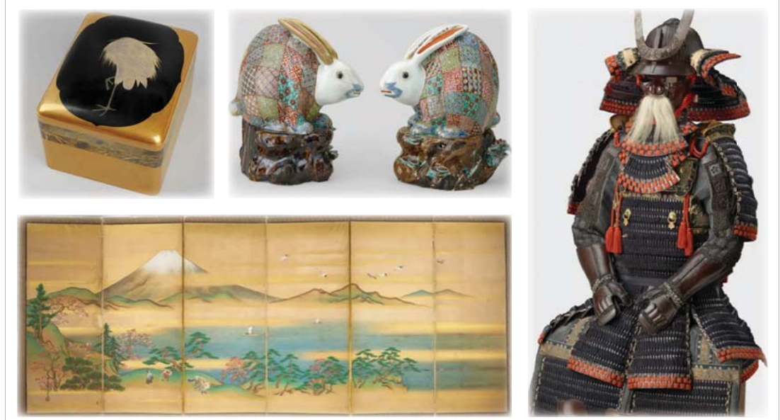
• من أعمال المعرض

أقيم في (معرض الملكة) الخاص بعرض الأعمال الفنية الملكية في قصر باكنغهام -معرض المعامل البريطانية في لندن- معرض تشكيلي عن الفن الياباني يروي قصة قرون من التبادل الفني والثقافي بين الشرق والغرب. ويضم المعرض أربع لوحات فنية وهو الأول المخصص للأعمال الفنية من اليابان في المجموعة الملكية، والتي أُعيد تصميم صالات الملكة الخاصة بها بشكل خاص في حين أنه ليس مسخراً شاملاً للفن الياباني، حيث لا يوجد من قبل الكيمونونوت واحد قطع من منمنمات تشسوكي، فإنه يكسب عن قصة مثيرة للديبلوماسية والصدق والثقة من خلال الفن والحرفية ويظهر مدى افتتان الغرب بالفن والثقافة والأشياء اليابانية.