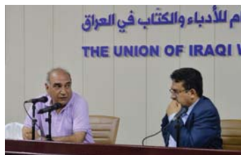
البيضاني، قصة طويلة حولتها إلى رواية ذات مسارين