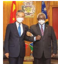
● رئيس وزراء جزر سلومون يستقبل وزير خارجية الصين

لكن الصين صعدت من تيرتها مؤخرا، وكشفت تسريب لاتفاق اقتصادي وأمني طموح بركن توقيع 10 دول اتفاقا سيبدل جذريا ميزان القوى في منطقة تمتد لثالث العالم تقريبا. وتواجه دول المحيط الهادئ خيارا سيبيدا صياغة شكل منطقتهم لعشرات السنين المقبلة.