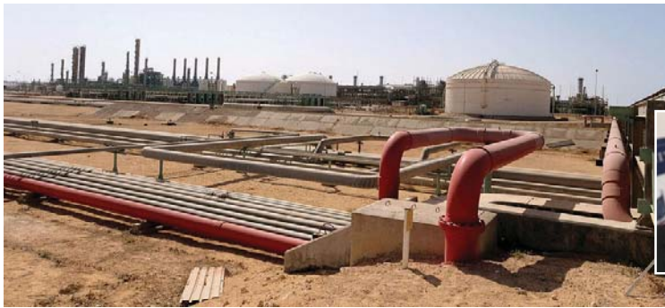
● مقال راس لانوف النمطى