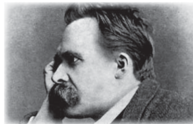
نيتشه، الفيلسوف طبيب الحضارة