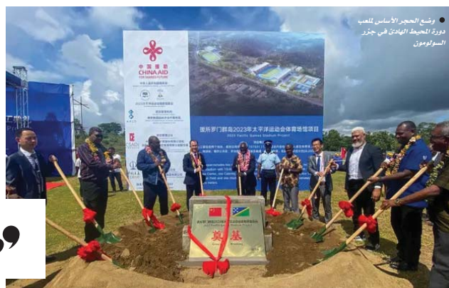
● وضع الحجر الأساس للمبني دورة المحيط الهادئ في جزر سلومون