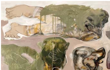
● تخليط يدق مارج

أخر بيت سكنه أهلي لم يكن بعيداً عن دار المختار، كنت نكلك سكباً، والمازكا نستاجر وننتقل من بيت إلى آخر بيتاً عن أهلنا فأتنا كم الأكثر غرماً بعد أن ازداد عدد أفراد العائلة كل شهرين أو ثلاثة تسكن في شارع محظوظ ولنا عنوان غير سيبق. كانت في نخاف من أي طريقة باب غير مألوفاً، وبالخصوص إيلا خشية أن يعود أجدنا، نحن إنناها الثلاثة محمولاً في نعشه، كان الدعاء لا يفرقنا شيئاً: محروسين بالله وكثيره ورسلا تخرج الكبات كأنها نداء استغاثة مصحوبة بتهدئة تشقّ عنان المسامح من كل غروب شمس، كأنها تزيمة يصممها كل الجيران إننا! كانت تالم ولا تمام، دائماً متوقفة وتحاول تغضير الأصوات التي تسمعا في الشارع بناء على حسنها، وصلت محلاتنا منصف الليل وتوجهت لدار المختار مباشرة أسأله عن أهلي في أي دار يسكنون إننا، أم في البيت نفسه! طرقت الباب بهدم متوجساً، خوف أن يكونوا أنما الحياة