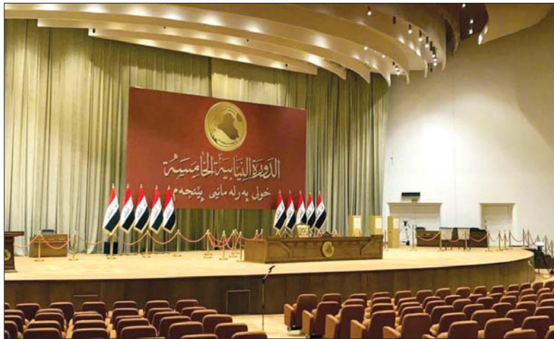
الاندساد السياسي يعود إلى تمسك الكتل الكبيرة بمواقفها