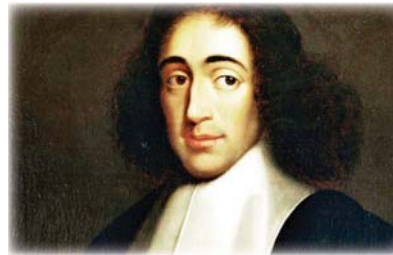
سيغموند، الإنسان الحز متشغل بالحياة لا بالموت

الجسد من القيام بالعمل وتيقن حركته وحركة الفكر أيضاً، وهناك الحزن الذي يهدمنا ويعيد تشكيل ذواتنا من جديد، بعدما تتحول صورة الشخص المفقود في داخلنا إلى صورة ضبابية باهتة لكنها لا تخول من العنين والمحنة التماسية، وهذا الحزن هو عاطفة إيجابية تعيد تشكيل ذواتنا من جديد من خلال عمليتي الهدم والبناء، وأخلق المتجدد، هنا يحدث ما يسمى بعملية ارتقاء باوعي والفكر الذي يستطيع فهم الأشياء والأحداث من حوله من دون تأثر والفعال، وهذا ما يساعد على تكيف الأحاسيس وتقبليتها من شوائب العالم الخارجي، ومن كل ما هو ضار للطبيعة البشرية.