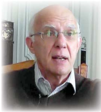
• بيكسال ملرشان

على النسخة التي يتصدر منها المرشح أومن الجناح الموالي للغرب أو الموالي لروسيا. إلى أي خبية يعود هذا التقسيم الفعلي للبلاد؟ المشكلة الأساسية هي أنه حتى عام 1991، لم تكن هناك دولة أوكرانية تتكون أوكرانيا في عام 1999 من مساحات كانت دائما في نطاق الإمبراطورية الروسية في الشرق، وأخرى في الغرب كانت تسيطر عليها بولندا أو الإمبراطورية النمساوية المجرية، والتي بالنسبة للبعض لم تكن أبدا تحت وصاية موسكو قبل عام 1944. هناك العديد من التبعات المحلية للغة الأوكرانية، فهي قريبة من البولندية في الغرب ومن الروسية في الشرق في أواخر القرن التاسع عشر، طلب إمبراطور النمسا من جامعة ليمبرغ (نفي الأ)، في الجزء الخاص بها من أوكرانيا، استحدثت تجانس في لغة الأوكرانية واحدة هذا هو أساس اللغة الأوكرانية التي اختارها كيف في عام 1991، في حين كانت اللغة الأوكرانية الرسمية في أوكرانيا السوفيتية قريبة من الروسية. في عام 1917، في فوضى نهاية الحرب العالمية الأولى، استقلت بولندا، انهيار الإمبراطوريتين النمساوية المجرية والروسية للتوسع في المناطق السلافية الأوكرانية وزرع الكاثوليكية هناك. لم ائتج صراع بين المناطق الغربية من أوكرانيا، المناصرة للبولنديين، وبقك الواقعة في الشرق الموالية لروسيا. استولى السوفيت أخيرا على جميع الأراضي في عام 1924، وجمعا بين السكان الذين لم يعيشوا معاً من قبل. أما الحدود الحالية لأوكرانيا فهي نتاج التقسيمات الفرعية التي قام بها ستالين، لكن الذين يعيشون في غرب البلاد، انتخب الرئيس الأوكراني بيكساليسكي