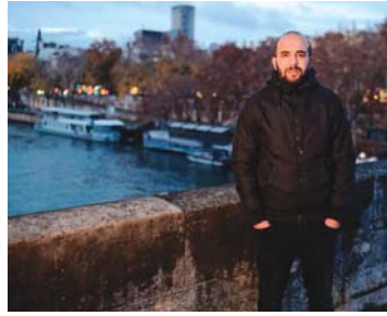
نشطاء جزائري في فرنسا

السبب المرجح للهجرة ببساطة هو أن الألاف الأشخاص ممن يخاطرون بحياتهم شعاراً «الجزائر الجديدة» الذي شارك في تلك التظاهرات مئات الآلاف الأشخاص بعموم مناطق البلاد