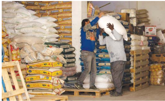
● تجار وضعاف نفوس تهتمون باحتكار المواد الغذائية بنية رفع أسعارها

وكتب اجتماع برلماني حكومي مشترك أمس الاثنين، قال النائب الأول لرئيس البرلمان حاكم الزاملاني خلال مؤتمر صحفي مشترك مع وزير