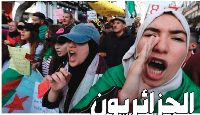
تظاهرات في الجزائر عام 2020