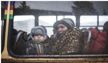
إمرأة وطفلتها يخرقان من منطقة دونيتسك، 2015