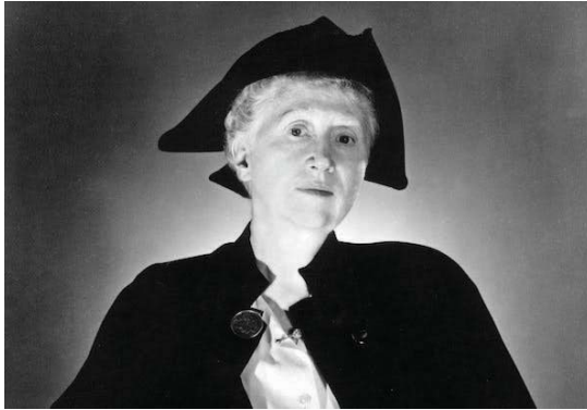
ماريان مور نحن نجعلها نجعلهم

(الشعر) هي واحدة من أشهر قصائد ماريان مور، وقد ظلت الشاعرة تتفحصها وتحلّف منها على مدى خمسة عقود من الزمن. النسخة التي تركّز عليها القراءة هنا تتكون من ثلاثة أبيات فقط، وتوجد نسخ متعددة أخرى متواترة في الطول لهذا النص، واحدة منها هي الأشهر وتتكون من خمسة مقاطع باليهمات الأصلية للقصيدة ذاتها التي نشرت للمرة الأولى عام 1919 في ديوان (الأخرون) واستمر نشرها بنسخ متباينة الطول، حيث عمدت مور في آخر الأمر إلى اختزال النص إلى ثلاثة أبيات فقط، ملحقة النص المؤلف من خمسة مقاطع في آخر أعمالها الكاملة ما جعل طريقة التعامل مع القصيدة معقدة بعض الشيء بالنسبة للقراء.