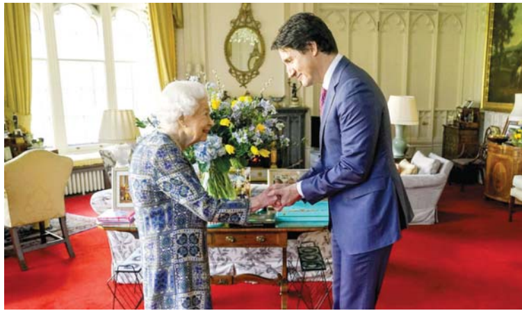
عقدت الملكة البريطانية إليزابيث الثانية، أمس الاثنين، أول لقاء شخصي لها بعد شفائها من فيروس كورونا، وكان مع رئيس الوزراء الكندي جاستين ترودو، واستقبلت الملكة الياقة من العمر 95 عاماً، ترودو في قلعة وندسور.

إن ما يجري على الجبهات غير ما يجري في المدن، فالحرب بين "الكيار" حذرة، والعوف من امتدادها التنويري يجعل من الدول نجحت عن أفتمة أخرى للحرب، لكن الواقع الاقتصادي والإنساني في المدن، وعلى حدود الدول التي يلجأ إليها الآريون من تلك الحرب، له توصيف آخر، فالفضائيات تنقل صوراً ترسم ملامح سوداوية، ووقائع قابلة للتجسس، لتضع العالم أمام كارثة إنسانية من الصعب السيطرة عليها.