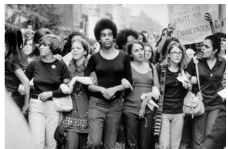
الحركة النسوية تسهم في تعريف المرأة بيوثيا

التي تتلقت من أي فم تردد على مدى واسع من فوه يوم ثم البحث عن مصادر ومرجعيات، والسبب الآخر هو المد الديني الذي أتبع منه الشقيط وتسميه الخصم وابتكار التهم والتبيل من المحتوى بالصالح ما شاء على المظهر. مرت فترة من الزمن لم نر في العراق ردة فعل