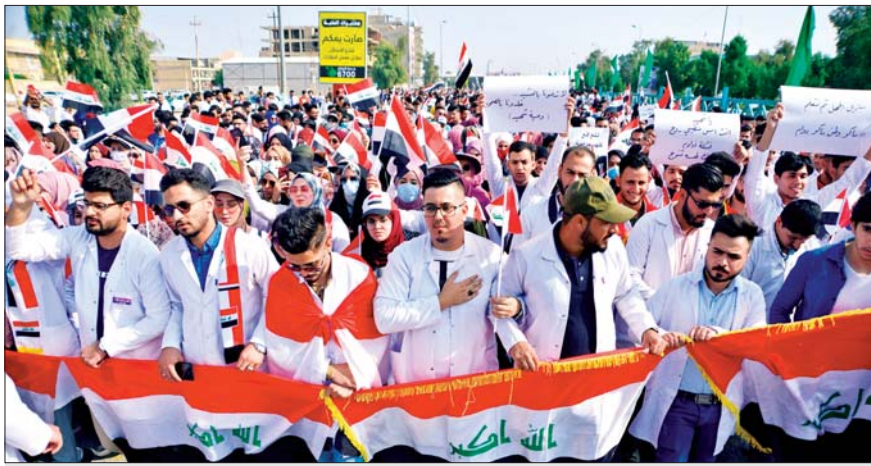
تظاهرة طلابية في محافظة النجف، الأشرفية

دعا زعيم التيار الصدري السيد مقتدى الصدر أمس الأربعاء، البرلمان لإقرار الإصلاحات الجذرية، كتغيير مفضية الانتخابات وفاتونها، وتغيير بعض بنود الدستور، والعمل على تطبيق ما أقر من إصلاحات من خلال إقرار قوانينها فوراً، كما دعا السيد الصدر، المتظاهرين لإبعاد من وصفهم بـ «الناشطين القابعين خلف الكيبورد، الذين تحرك أناملهم بأخذات استعمارية أميركية»، وفي وقت جدد فيه أعضاء في مجلس النواب والتأكيد على سعي السلطة التشريعية لإسناد الإصلاحات بقوانين وتشريعات ترسخ مطالب المتظاهرين، وتواصلت التظاهرات والتجمعات الاحتجاجية في بغداد ومحافظات الوسط والجنوب.