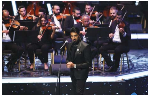
أحبا المطرب همام إبراهيم، حنلاً غنائياً في الليلة العاشرة من فعاليات مهرجان الموسيقى العربية في دورته 28، والمقام على المسرح الكبير بدار الأوبرا المصرية، وهي المشاركة الثالثة على التوالي لإقام في هذا المهرجان.

تقيم دائرة الفنون التشكيلية بوراة الأولى من شهر كانون الثاني وعلى قاعة القصر العباسي المعرض التشكيلي «إبداعات تشكيلية في أروقة عباسية» المعرض بمشاركة فيه مئة فنانة وقنان من مختلف الأجيال، ويضم أعمالاً مختلفة من مناهج ومدارس الرسم واللوحات المائية والتعبيرية والسريالية.