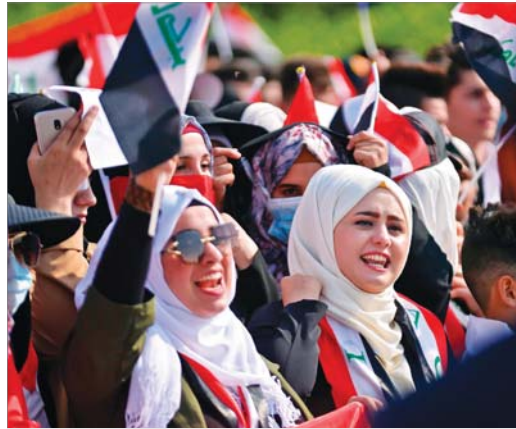
تظاهرة طلابية في محافظة النجف الاشرف

جسد رئيس مجلس النواب محمد الجلوبوسي، تأكيده سعي السلطة التشريعية لإستناد الإصلاحات بقوانين تستجيب لطلب المتظاهرين، فيما أكد المضي بوضع خارطة طريق لتشريع القوانين خلال فترة زمنية قصيرة، لمعالجة أزمة الفساد والتركاسة، أوضح أن المجلس ينتظر من الحكومة إرسال مشروعات قوانين الضمان الاجتماعي، والنظ والفغان، ومعالجة أزمة السكن، والوزارة العامة للعام (2020)، معرباً عن الاستعداد التام لتشريع جميع القوانين التي تستجيب لطلب المتظاهرين، إلى ذلك، دعا زعيم التيار الصدري السيد مقتدى الصدر من وصفهم بـ "الترار" إلى إبعاد شبح التدخل الخارجي الأميركي وغيره بل وحتى بعض الناشطين قابعين خلف الكيبورد، الذين تتحرك اناملهم وفق أجندات استعمارية أميركية وغيرها، في حين نفى الناطق الرسمي باسم القائد العام للقوات المسلحة الأرقام التي تتحدث بها بعض المنصات الإعلامية بشأن أعداد الجرحى والشهداء في التظاهرات. وذكر بيان للوزارة الإعلامية لمجلس النواب، تلقته "الصباح" أن الجلوبوسي أكد خلال جلسة البرلمان أمس الأربعاء، على المضي بوضع خارطة طريق لتشريع القوانين التي تقدم الواقع الاجتماعي وتسهل في حل المشكلات المترتبة التي يمر بها البلد، لاسيما قوانين (من أين لك هذا)، والحكمة الاحتمار، وتنشيع الاستعمار، ومجلس الاعمار، والضمان الصحي، وقانون مجلس