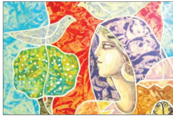
من أعمال الفنان حسن ملحم