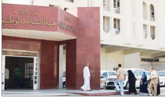
مبنى هيئة التقاعد العامة