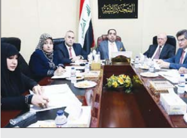
لجنة الصحة والبيئة النيابية

بحث لجنة الصحة والبيئة النيابية، برئاسة نقيبها الجيوسوري أسعد الأبراهيم، خلال استجوابها وزير الصحة والبيئة معتر صادق علاي، وأخبار عمل الوزارة، وإكمال ما يخصه من مشاريع مستشفيات سابقة من الأقسام المخصصات المتلكئة في بغداد والمضائق والحدود قديماً منها بهذا الخصوص، لإلتا في انها «ستزود قوائمها بجميع الأوليات والطلبات التي تم التوصل لها بغية الإسراع في تحقيق نتائج إيجابية»... وأضاف البيان ان «الجانين ناقشا سبل دعم الصناعة البوئية والسنكزات المحلية والحلية وإيلائها الأولوية لجهيز المؤسسات في العراق».