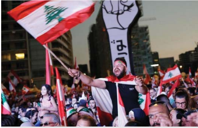
استمرار التظاهرات والاحتجاجات في لبنان طيلة الايام

وأشار المنسق الخاص إلى ضرورة أن تعطي السلطات الأروبية لتدابير عاجلة للحفاظ على الاستقرار النقدي والمالي والاقتصادي والعملة وكذلك وضع الإصلاحات الضرورية والسلم الرشيد وأنها، والسماح بين الإعلام من العقاب على الفساد والفساد والسرقة بطريقة شفافة. إن الوضع المالي والاقتصادي غير ولا يمكن للحكومة والسلطات الأخرى انتظار فترة أطول بل، معالجته، بدءاً من الإجراءات التي تمتد إلى كافة قطاعات ومن مخرجاتها الشريعة على الحياة آمنة وصحية يمكنهم مواصلة عملهم الطبيعية. إن العقاب الملزم المستمر للتصدي التشريعي يزيد من تقادم الأزمة ويسهم في عدم الاستقرار الاجتماعي».