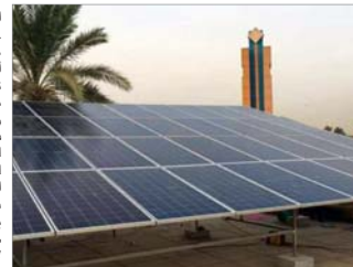
منظومة توليد كهرباء تعمل بالطاقة الشمسية

تباشر وزارة الكهرباء، خلال الة المقبلة، عملية نصب 2000 وحدة شمسية على سطوح منازل الفقراء في بغداد والمحافظات، بقيمة 12 أمبيراً لكل وحدة، بينما استبعدت إمكانية تالاع