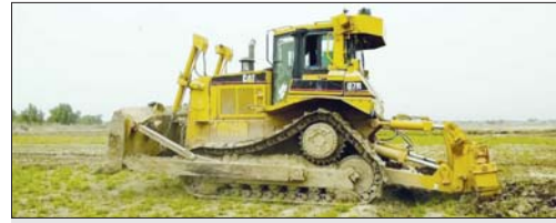
عملية نثر للاراضي