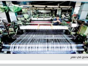
مصنع في مصر