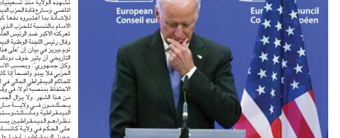
جاء بايدن المرشح الديمقراطي الأخر

بثقة لدعم مرشحيه وأطاح الديمقراطي أندي بشير الذي تصدعوا باقل من نصف نقطة مئوية بعد صدور كل الأصوات بماثناه الجمهوري يهين حاكم ولاية كنتاكي الجديدة تشير إلى أن الثالث العام بشير جيسس ما أعلنت حاكم كنتاكي التندج، وأعلن بشير الذي كان والده آخر حاكم ديمقراطيون