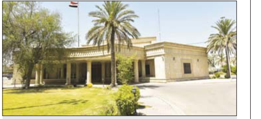
مبنى هيئة النزاهة

والوكيل الفني ومدير عام السابقين في وزارة الاعمار والإسكان، وبينت ان القرار صدر استناداً إلى أحكام المادة «340»، من قانون العقوبات العراقي عن تهمه عدم تنفيذ التهمين للدفع الخاص بالتصميم الأساس لذمية التنفج... وفي بيان اخر فان «محاكمة تحقيق الكرخ المختصة بالنظر بقضايا النزاهة في محافظة بغداد اصدرت أمر استخدام بحق رئيس الهيئة الإدارية لنادي القوة الجوية الرياضي»، موصحة ان «لتهم ارتكب مخالفات في العقد البرم بين الهيئة الإدارية للنادي وشركتي تعهدات وتجارة عامة، واستمارات عقارية وصناعية لاستثمار الأرض المخصصة للنادي»، وأضافت البارتان ان «مساحة الأرض المخصصة لاستثمار تبلغ قرابة (50) دنوماً، خُصصت لإنشاء ميان رياضية وتجارية».