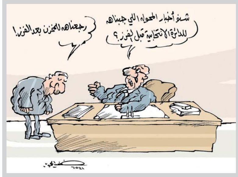
• كاريكاتير: خضير الجميري

برغم ما تعانينه وبلغه الخط البياني وياعتراف الجميع بهذه الصيبة التي تعد واحدة من حال العراقيين متعدد المواجه، الا جالسة كوروتا زادت المواجه وحضرت ملك التعليم الانتدائي والعالي والصميم، ما تطلب من الوزارات المعنية وبقية المؤسسات واللاكات تبذل جهود جبارة خلال سنتين خلت وقد ادوا ما عليهم قدر المستطاع الا ان واقع الحال ينشئ بالكثير في الموسم القبل الذي لا تفصلنا عنه سوى ايام يجب ان تنتهض بها الدولة، بالرغم من مسؤولياتها، فالنظام الانتدائي هو الاساس وعلى الاخوة المعنيين اخذ ذلك بنظر الاعتبار والسماح لكل الراغبين بالدراسة والدوام ممن تعطلوا أو رسبوا أو تسيبوا لظروف امية أو صعبة، ان يعيدوا ولو برسم ماهي معين رمزي يكون كفارة لهم على ان يسامعهم للعودة لخصار العلم وعدم التسيب اكثر والضياع، فقد لاحظنا ان هناك اعدادا لا يستهان بها من الطلبة سعارا وكبارا، قد اجبروا على ترك مقاعد الدراسة لظروف تاهرة متنوعة، نادراً ان يسامع لهم بالعودة الى مقاعدهم الدراسية والابتداء منهم كأجود مستحقون التعلم والذاتي والمسامة في تخصيص الأوضاع العامة للبلد، لا سيما في قطاع التربية والتعليم، والله ولي التوفيق.