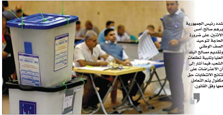
شدد رئيس الجمهورية برهم صالح، أمس الاثنين على ضرورة الحاجة لتوحيد الصف الوطني وتقديم مصالح البلد العليا وتلبية تطلعات الشعب، فيما أشار إلى أن الاعتراضات على نتائج الانتخابات حق مكفول يتم التعامل معها وفق القانون.