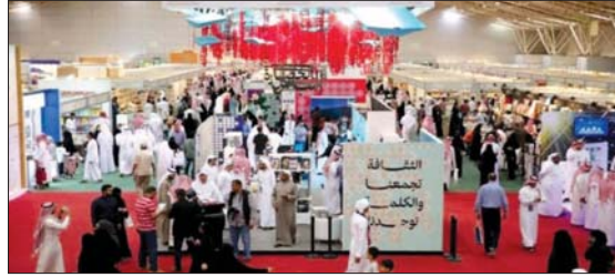
العراق ضيف شرف في معرض الرياض الدولي للكتاب