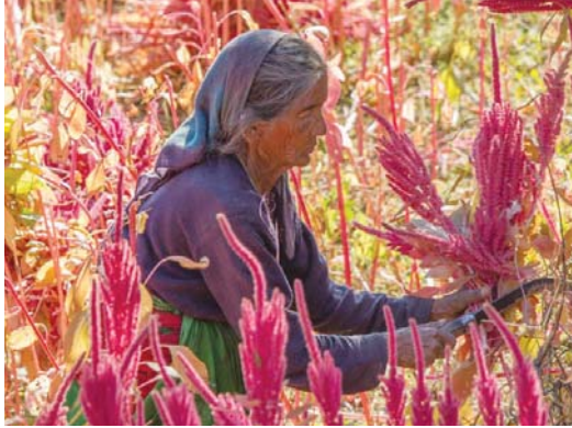
● امرأة مسنة تقطف محصول القطنية في أوتارانشال الهندية