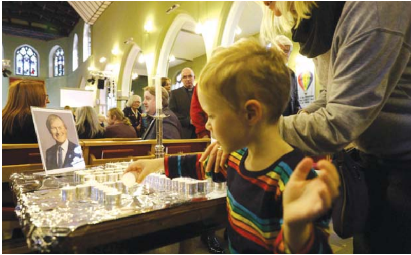
● دعمت أسرة النائب البريطاني فيديدا أميس، الذي طعن حتى الموت خلال اجتماعه مع ناخبين من دائرته داخل كنيسة يوم الجمعة الماضي، البريطانيين إلى التسامح بغض النظر عن المعتقدات العرقية أو الدينية أو السياسية.

أزيد استقرازي أي فريق". وبخصوص أحداث الطويلة المألّمة ذكر مقياتي أنّ ما حدث قد حدث ولا بد من العمل على معالجته، والمعالجة سياسية، وطالما أنا موجود لن أسمح بظلم أي فريق، وإيمان بلد التوازنات، وعلى الجميع الاحتكام إليها". وعن الأخبار التي تشاع بخصوص استقالته، أكد مقياتي أنّها "غير مطروحة"، ولا يمكن ترك البلد في هذه الظروف، ولا جعل الفراغ يشمل السلطات كلها، ونحن لدينا مهمات أساسية واضحة (وضع خطة الإصلاح الاقتصادي، وإجراء الانتخابات البلدية في موعداً)، وأنا ملتزم بهاتين المهمتين".