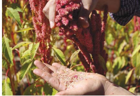
● بانف العروس زهورها كنز

جميع النباتات باستثناء تلك المعدلة وراثيا، لكن وبطريقة ما، نجت القطنية منه كما نجت منها إنتاج المئات من البذور، إذ يمكن لحفنة منها أن تنحدر إلى كيس بوزن مئة مرة رطل خلال الموسم الثاني من الحصاد. بالنسبة للكثير من المزارعين المحليين من السكان الأصليين في الولاية الشمالية، فإن زراعة القطنية أسهمت بتوفير درجة من الاستقلال الاقتصادي، لكنها في جانب ذلك مهدت طريقا للسيدة الغذائية، فقد عبرت من حياة الأسر مسكت المزارعين الغواتيمالية من إعالة أسرهم من مزارع أسلافهم، بل من العمل في العاصمة أو مزارع البن والرز الساحلية.