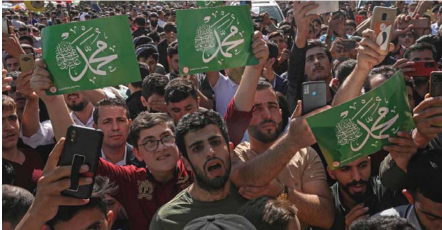
● بغداد: الصباح ● المحافظات: مراسلو الصباح

هنا رئيسا الجمهورية والوزراء الشعب العراقي بمناسبة ذكرى المولد النبوي، بينما دعاوا الى توحيد الصف الوطني وتخليص لغة الحوار والصلاة العامة ضمانا لتحقيق تطلمات الشعب. وقال رئيس الجمهورية برهم صالح في بيان صحفي: إن هذه المناسبة عظيمة لاستلهاهم القيم النبيلة والروس العبر من عطاء وسيرة الرسول في الانتصار للسلام والمحبة والتأخي بين البشر. وتابع: ما أخوجنا اليوم للاقتداء بالسيرة العظيمة للنبي الأمين وإن نتمثل بأخلاق العدل والإنصاف والقيم الإنسانية السمة لدينا الحنيف. وبين أن النبي الأكرم أسس دولة واستطاع بصدق عزيمته محض الظلم والجور والفساد وإظهار الحق وإقامة العدل وخلق مثالا في سمر الأخلاق وقوة الإرادة، مشيرا إلى أننا نتخلف بالذكري العطرة للمولد النبوي. من جهة، دعا رئيس الوزراء مصطفى الكاظمي الى تغليب المصلحة الوطنية ضمانا لتحقيق آمال العراقيين. وقال الكاظمي في تغنيته بمناسبة ولادة الرسول (ص): تهني الأمة الإسلامية بذكرى ولادة رسول الإنسانية محمد (ص)، هو الرسول الأعظم الذي جسّد الإنسانية وهدي الإنسانية إلى خير الصالح والعمل. وبعد الكاظمي الجميع لأن يكون المولد النبوي الشريف مناسبة تعزيز وحدتنا وبنائنا بلدنا وتغليب المصلحة العامة ضمانا لتحقيق آمال أبناء شعبنا. وشهدت مدينة الأنظمة في بغداد احتفالات واسعة بهذه الذكرى، شملت الفاء كلمات والتأنيب تحدث على التأخي والتعاون والوحدة الوطنية وبنيد الثاقفة.